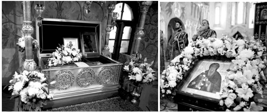
Мощи преподобного Евфимия Суздальского в Спасо-Преображенском соборе Спасо-Евфимиева монастыря.

12 апреля Светлое Христово Воскресение. ПАСХА Воскресенский кафедральный собор 00.00 Крестный ход. Утренняя, Божественная Литургия Преображенский собор Спасо-Евфимиева монастыря 00.00 Крестный ход. Утренняя, Божественная Литургия Успенский храм 9.00 Божественная Литургия Смоленский скит в Веретьево 9.00 Божественная Литургия Воскресенский кафедральный собор 17.30 Великая вечерня. Встреча благодатного огня