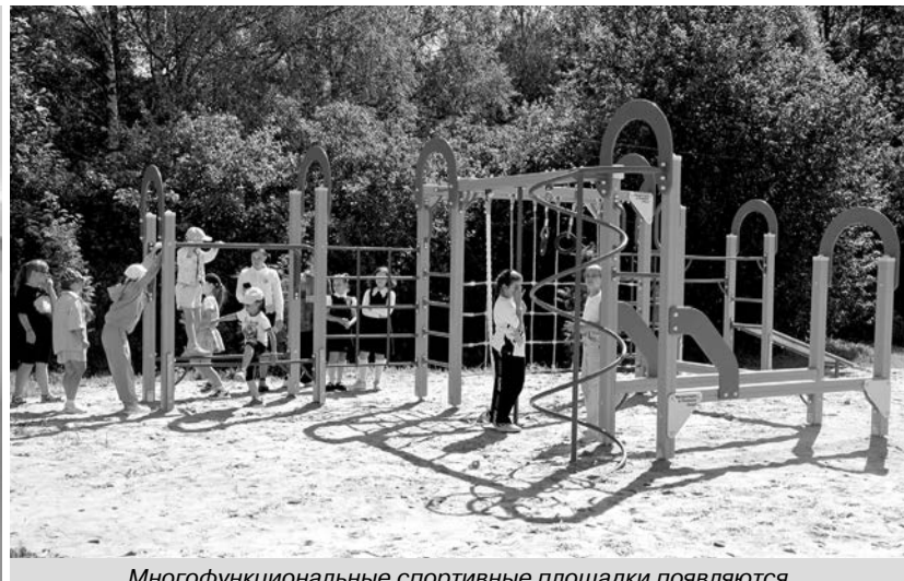
Многофункциональные спортивные площадки появляются в рамках проекта «Центр развития семьи».