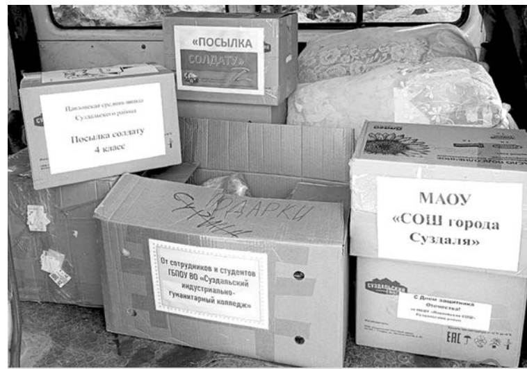
Гуманитарная помощь, собранная жителями Суздальского района.