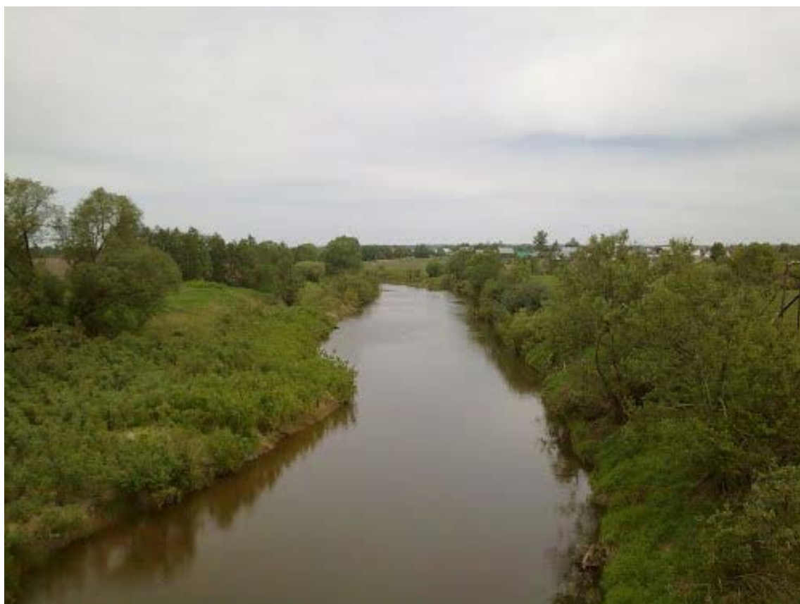
Рисунок 6.1. Река Колокша в районе перехода ВСМ-2, Вариант 1

http://www.panoramio.com/photo/82396023?source=wapi&referrer=kh.google.com