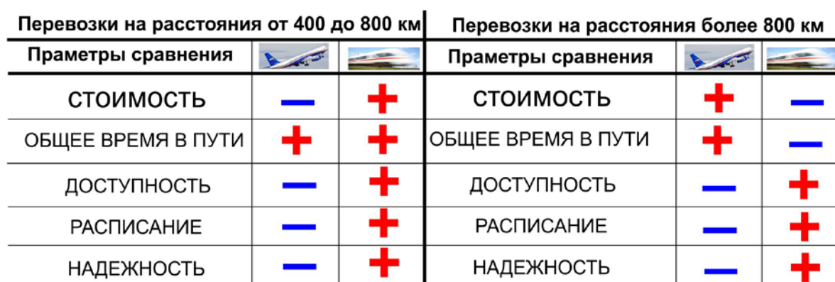
Таблица 2.1. Сравнение привлекательности перевозок для пассажиров авиационным и высокоскоростным железнодорожным транспортом в зависимости от расстояния.

Практика показывает, что высокоскоростной железнодорожный транспорт экономически эффективен и привлекателен для пассажиров по соотношению «цена/скорость» при перемещениях на расстояния от, примерно, 400 км до 1200 км (в среднем -около 800 км) при скоростях от 200 до 400 км/час, соответственно (табл. 2.1). Себестоимость перевоз железнодорожным транспортом оказывается ниже, а объем перевозок выше, чем альтернативными видами транспорта.