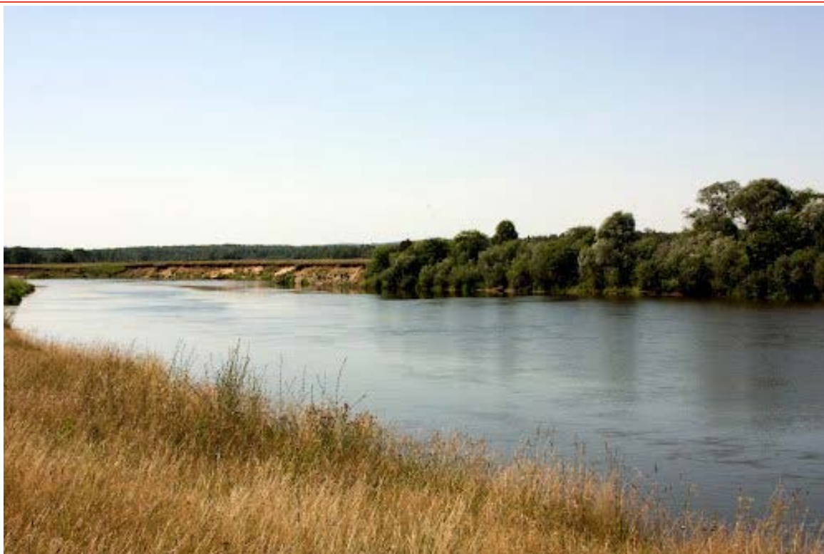
Рисунок 6.2. Река Клязьма в районе перехода ВСМ-2, Вариант 1 в районе Владимира