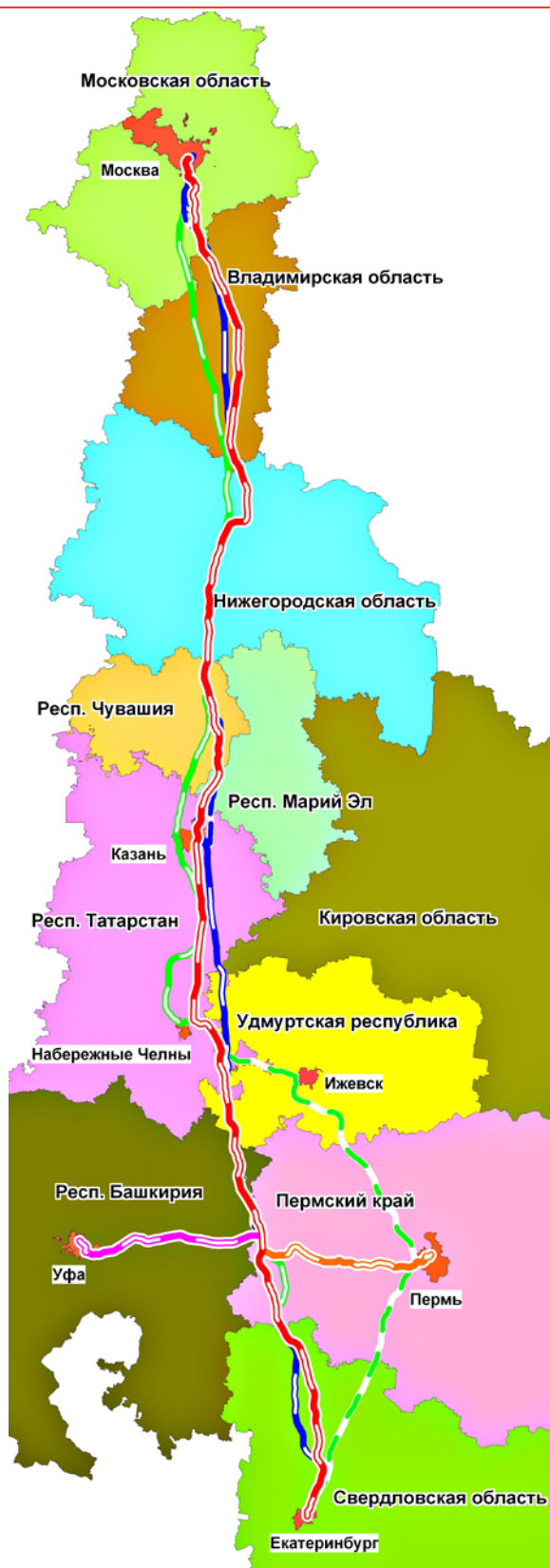
Рисунок 1.1. Схема рассматриваемых вариантов ВСМ-2.