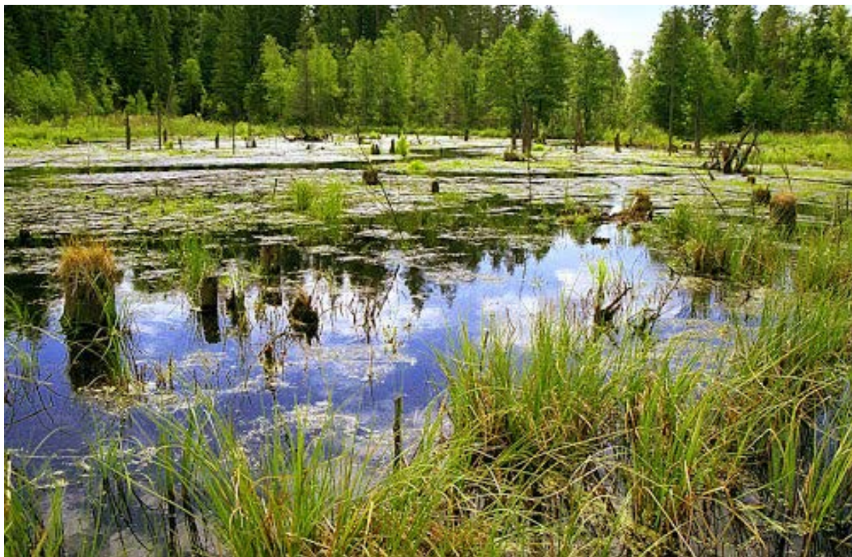
Рисунок 6.3. Заболоченная пойма реки Бужа в районе перехода ВСМ-2, Вариант 2

являются недостаточно очищенные хозяйственно-бытовые и промышленные сточные воды городов, а также сельскохозяйственные стоки, поступающие непосредственно в реки или через их притоки.