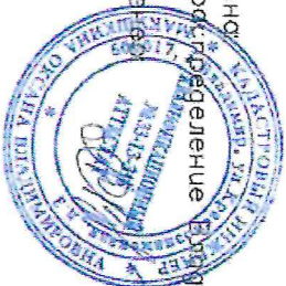
Схема подготовлена АО "Газпром газораспределение Владимир" Кадастровый инженер Макушкина О.В.