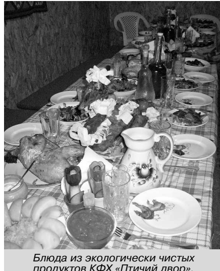
Блюда из экологически чистых продуктов КФХ «Птичий двор».