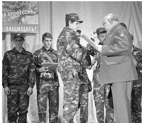
Учащиеся школы на Дне призывника, 2016 г.