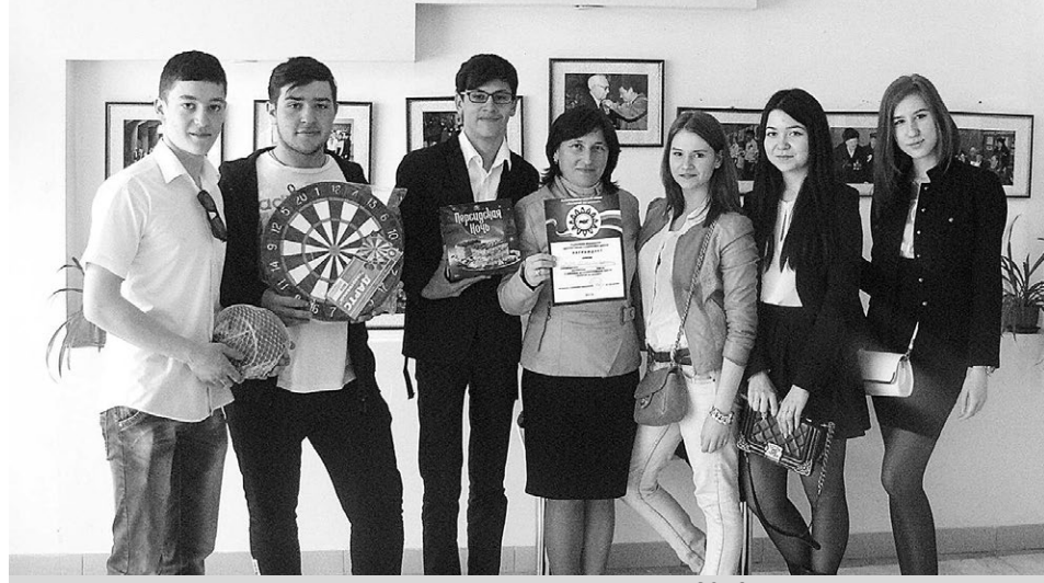
Антинаркотический квест, 1 место, 2016 г.