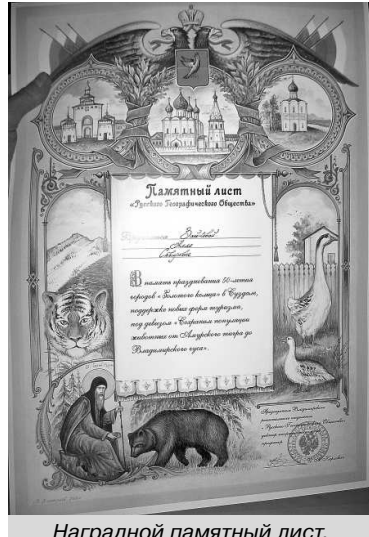
Наградной памятный лист.