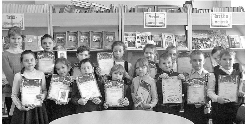
Участники-призеры городского конкурса поделок из природного материала «Дары осеннего Суздаля», 2016 г.