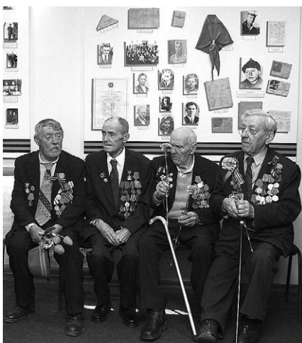
Суздальские ветераны в школьном музее боевой славы.