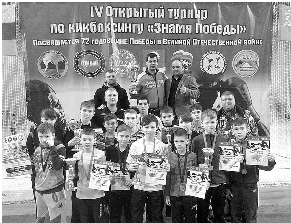
Суздальские спортсмены и их тренеры.

От юбилеев в жизни не уйти. Они настигнут каждого, как птицы, Но главное - сквозь годы пронести Тепло души, сердечности частицу. У Вас сегодня юбилей! Мы от души Вас поздравляем! И в жизни главного желаем: Здоровья, счастья, радости И лет до ста - без старости!