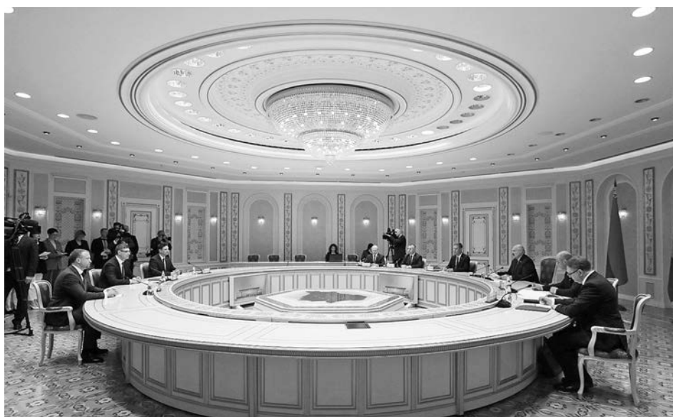
Рабочая встреча губернатора Владимирской области Александра Авдеева и Президента Республики Беларусь Александра Лукашенко.