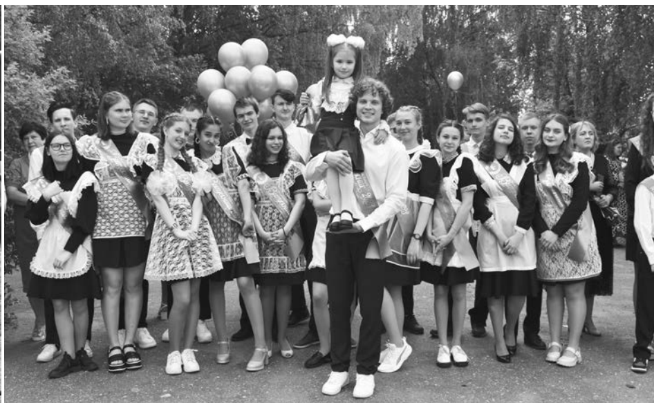
Одиннадцатиклассники Суздальской средней школы №2 простились со школой.