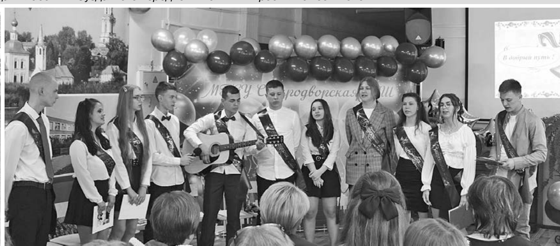
Последний звонок прозвенел для девятиклассников Суздальской средней школы №2 и Стародворской средней школы.