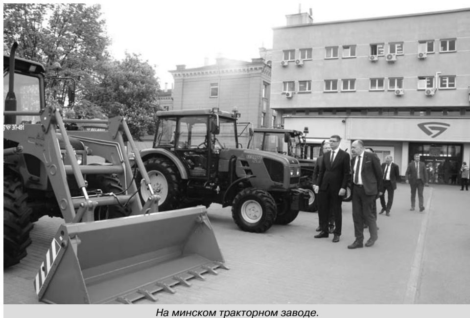
На минском тракторном заводе.