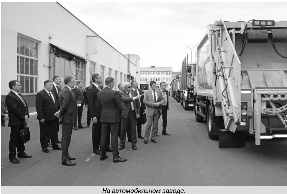
На автомобильном заводе.