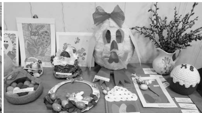
Выставочные сувениры, выполненные в различных техниках.