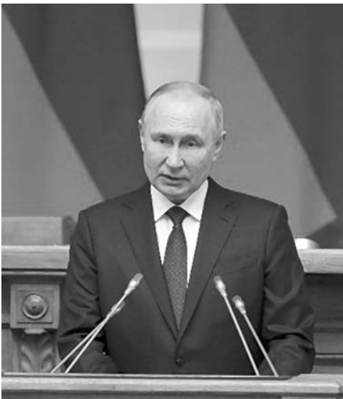
Выступление Президента РФ Владимира Путина перед участниками заседания Совета законодателей при Федеральном Собрании РФ.

К сожалению, до сих пор многие семьи военнослужащих не в курсе того, какие льготы им положены, и какие возможности предоставлены. Поэтому информирование людей должно быть в приоритете. Кроме того, среди одобренных на Совете законодателей мер: улучшение реабилитации военных (в том числе психологической); обеспечение качественного протезирования путем открытия в России собственного производства протезов (наработки