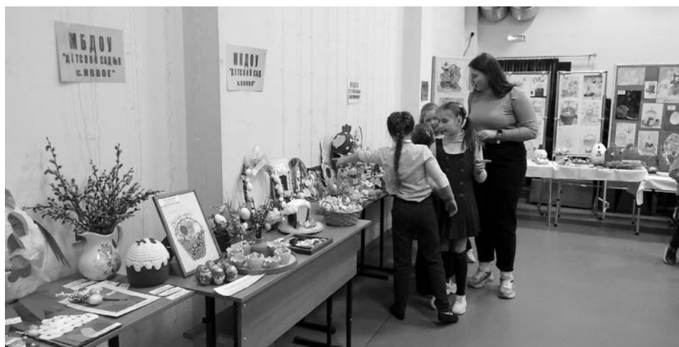
Выставка декоративно-прикладного творчества вызвала большой интерес.