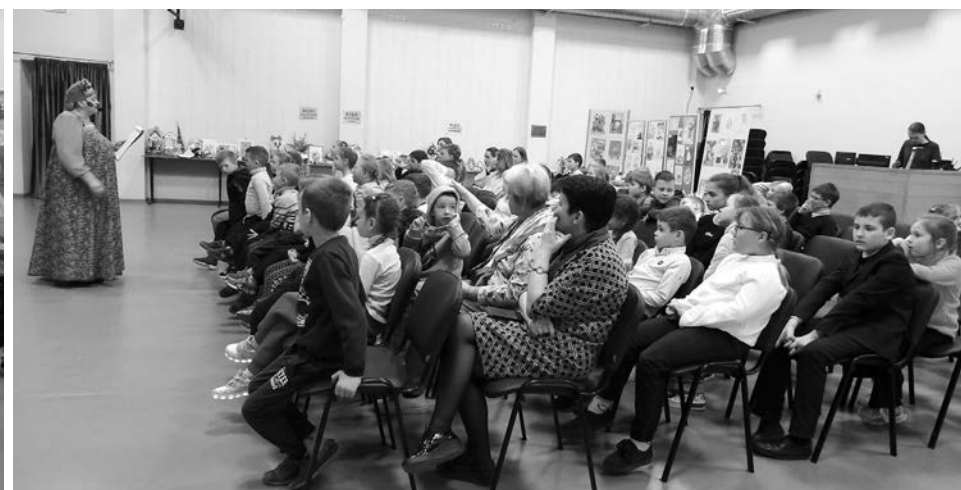
Дети очень внимательно слушали работников Боголюбовского ДК.