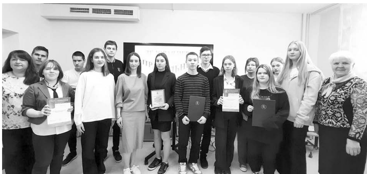
Участники деловой игры «Правильный выбор» в селе Новое и деловая игра «Мы - будущее России!» в селе Новоалександрово.