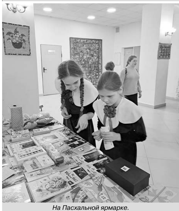
На Пасхальной ярмарке.