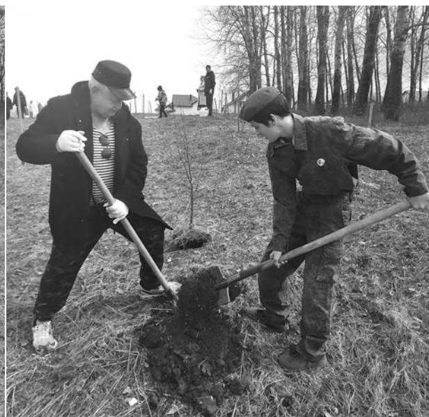
«Сад Памяти» - наша благодарность за мирное небо над головой.