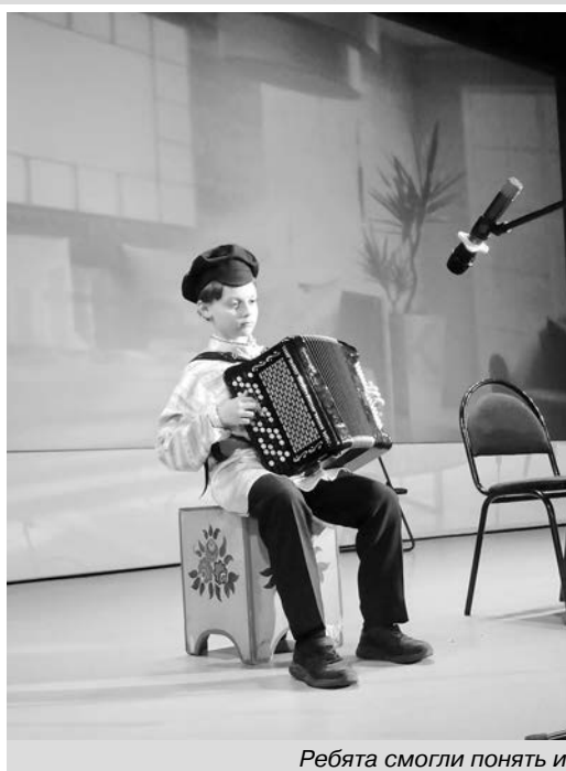
Ребята смогли понять и передать Пасхальную радость в своих выступлениях.