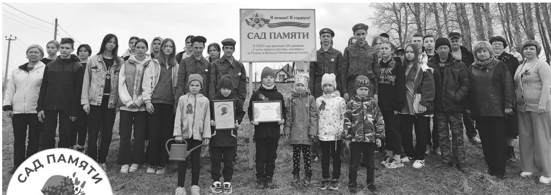
Участники международной акции «Сад Памяти» в МО Павловское.