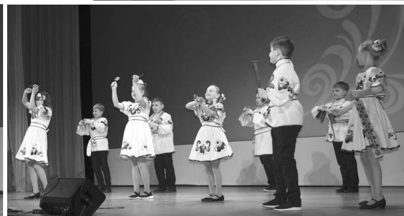
Детский шумовой оркестр «Кораблик».

Самому светлому весеннему празднику добра, жизни и любви был посвящён праздничный концерт, который состоялся 7 марта в Центре культуры и досуга г. Суздаля.