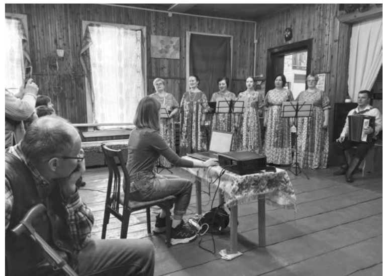
Народный ансамбль русской песни «Бабье лето» в клубе села Крапивье.