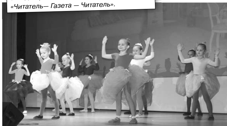
Группа «Фэнтези» танцевального коллектива «Талисман».