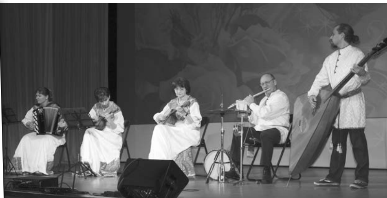
Ансамбль русских народных инструментов «Русская душа».

Повсюду — в Домах культуры, сельских клубах прошли мероприятия, посвященные Международному женскому дню. Артисты подарили виновницам торжества букет ярких эмоций, прекрасное настроение. О некоторых праздничных мероприятиях мы сегодня расскажем в нашем приложении «Читатель — Газета — Читатель».