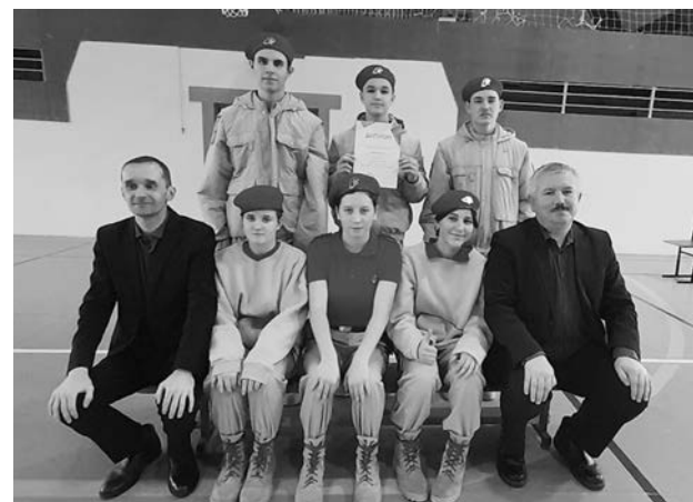
Юнармейцы п. Садовый - победители соревнований.

Участвовали 11 команд. 1 место - п. Садовый. 2 место - с. Новое. 3 место-с. Павловское.