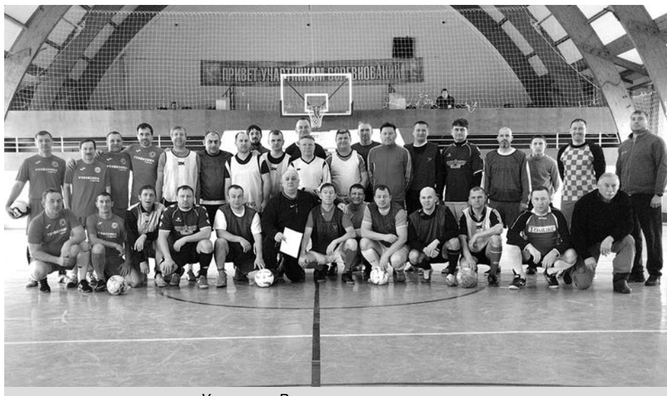
Участники Рождественского турнира.