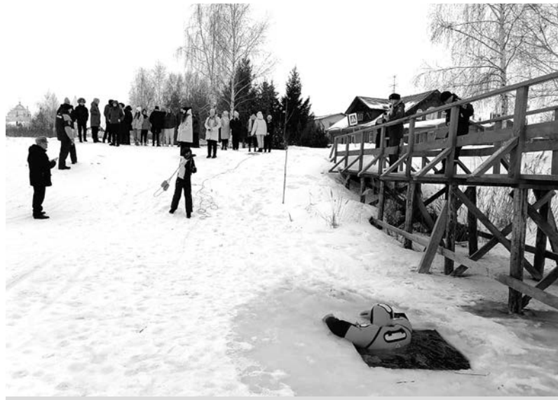
Занятия по правилам безопасного поведения на водоемах в зимнее время сотрудники МЧС проводили в формате открытого урока.

Недавно очередное занятие было проведено для учащихся средней школы № 2 в Суздале. На реке Каменка сотрудники МЧС и спасатели РОССОЮЗСПАС рассказали о правилах безопасного поведения на воде и продемонстрировали школьникам приёмы спасения при провале под лёд. Они показали метод спасения провалившегося под лёд при помощи специальных спасательных устройств и при помощи подручных средств.