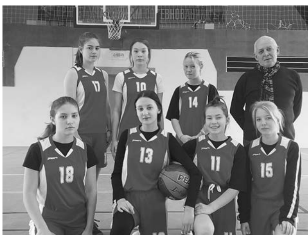
Команда п. Садовый - победители «КЭС-БАСКЕТ» 2022 г.