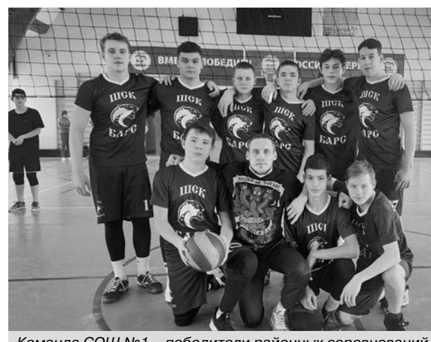
Команда СОШ №1 - победители районных соревнований по волейболу среди юношей.

Участвовали 9 команд. 1 место - СОШ №1 г. Суздаль. 2 место - СОШ №2 г. Суздаль. 3 место - с. Поречское.