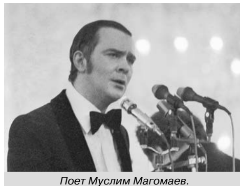
Поэт Муслим Магомаев.