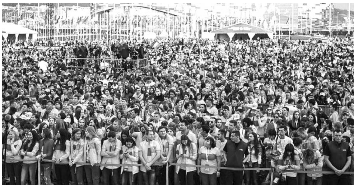
Всемирный фестиваль молодежи и студентов, 21 октября 2017 года.

Президент РФ Владимир Путин считает, что в перспективе будет возможно вновь провести Всемирный фестиваль студентов и молодежи. Однако, по его словам, в современных условиях не так просто осуществить эту идею.