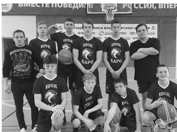
Команда СОШ №1 г. Суздаль - победители «КЭС-БАСКЕТ» 2022 г.

Результаты (девушки): 1 место - п. Садовый. 2 место - СОШ №1 г. Суздаль. 3 место - п. Боголюбово.