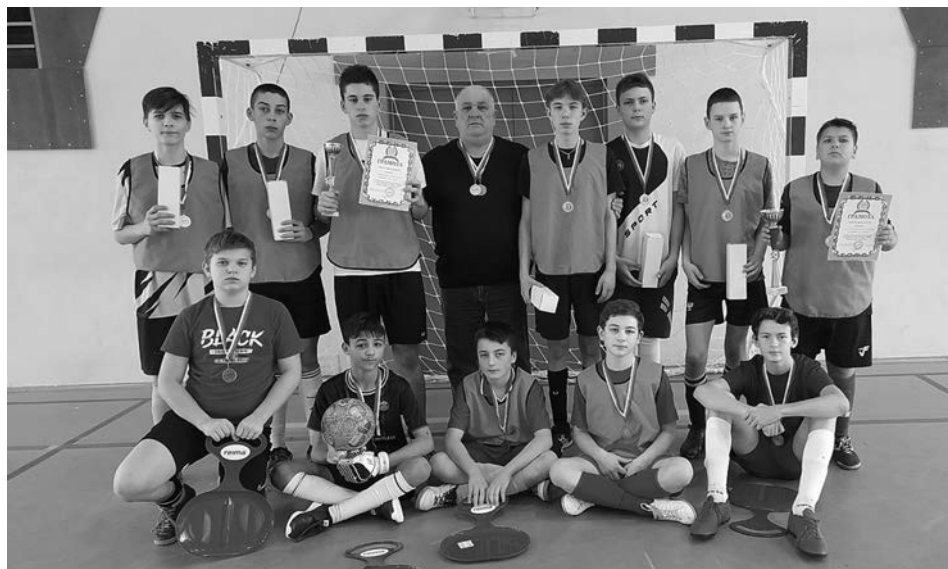
Команда с.Павловское – победители турнира по мини-футболу «Новогодние надежды».

1 место – с. Павловское. 2 место - п. Лухтоново, Судогодский район. 3 место – г. Ковров.