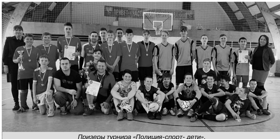
Призеры турнира «Полиция-спорт- дети».

3 место – СОШ № 2 г. Суздаль. 4 место – СОШ № 1 г. Суздаль. 5-6 место – с. Новое, п. Сокол.