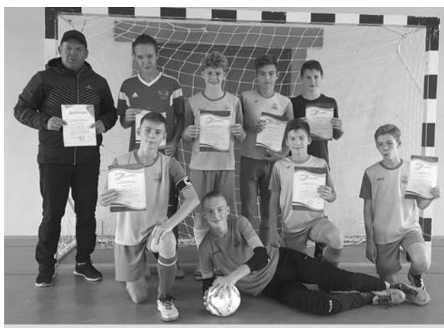
Победители первенства - команда п. Боголюбово.

Участвовали 7 команд школьных спортивных клубов. 1 место - п. Боголюбово. 2 место - СОШ №2 г. Суздаль. 3 место - с. Павловское.