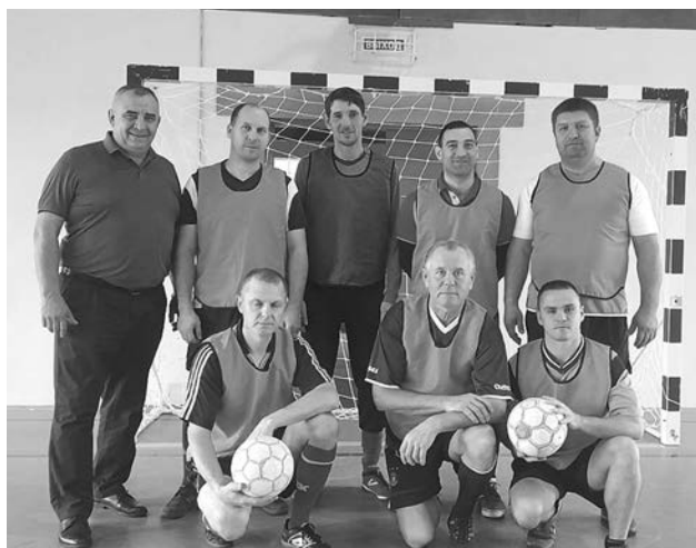
Победители турнира - команда родителей.

1 место - сборная родителей. 2 место - с. Павловское. 3 место - индустриально-гуманитарный колледж г. Суздаль.