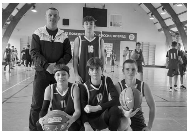
Победители первенства - команда СОШ №2 г.Суздаль.

Участвовали 11 школ. 1 место - СОШ №2 г.Суздаль. 2 место - п.Садовый. 3 место-п.Сокол.