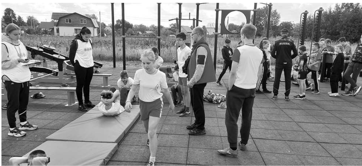
В фестивале участвовали сборные команды 7 Детских домов области.