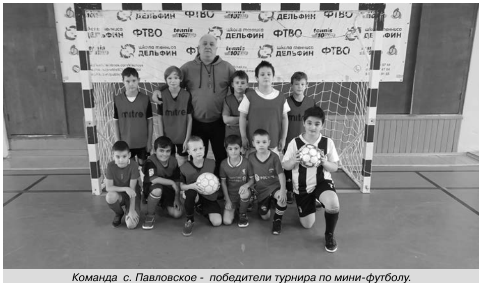
Команда с. Павловское - победители турнира по мини-футболу.

1 место - с. Павловское. 2 место – п. Ильино Судогодский район. 3 место –г. Владимир