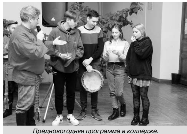
Предновогодняя программа в колледже.