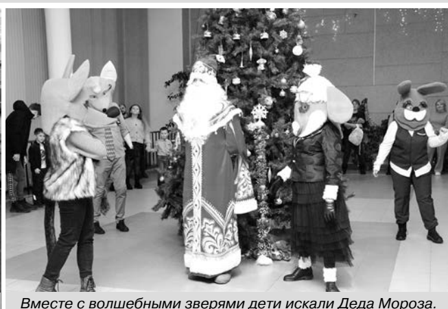
Вместе с волшебными зверями дети искали Деда Мороза.