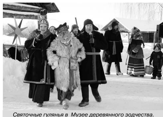
Святочные гулянья в Музее деревянного зодчества.