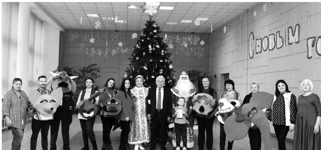
Частицу новогоднего волшебства подарили артисты межпоселенческого культурно-досугового центра жителям Суздальского района.

В канун Нового года, когда каждый день озарен верой в чудо, добро и любовь, сотрудники Межпоселенческого методического культурно-досугового центра в селе Новое подарили жителям нашего района - и маленьким, и взрослым огромный заряд позитивного настроения, крупицу волшебства, которого в это время все очень ждут.