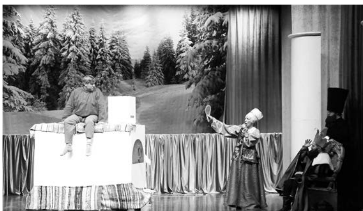
По щучьему велению чудеса происходили на глазах у зрителей.

Добро порождает доброту – вот какую мысль хотели донести до маленьких зрителей артисты межпоселенческого культурно-досугового центра, и это у них получилось.