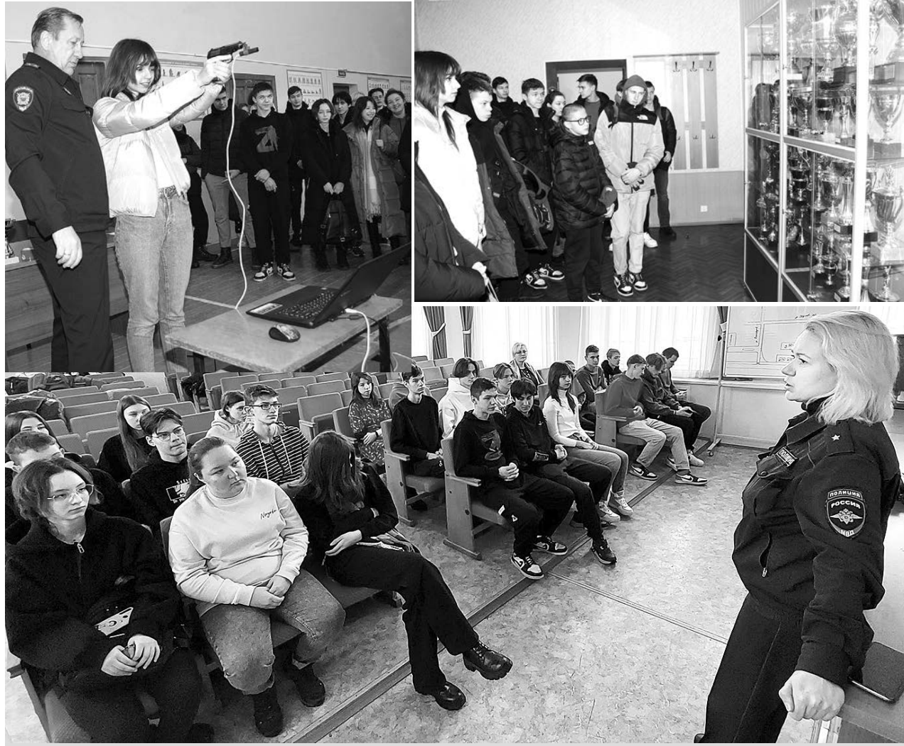
Участники акции «Студенческий десант» у суздальских полицейских.