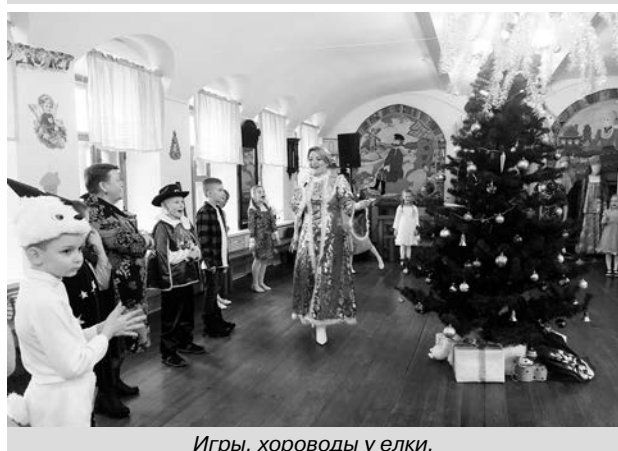
Игры, хороводы у елки.