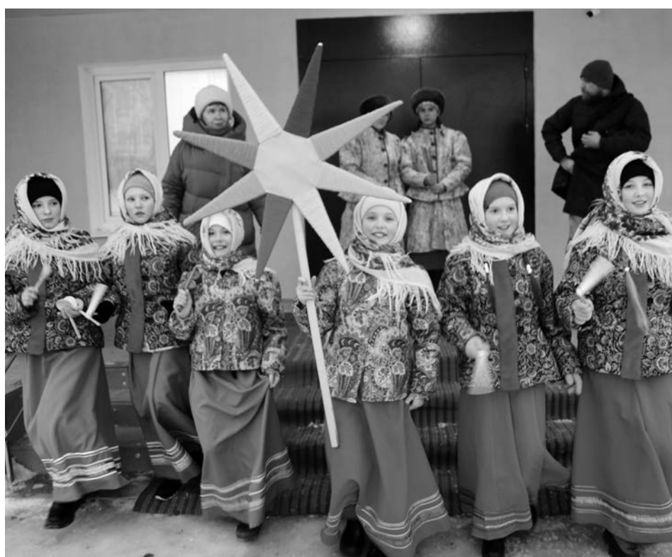
Святочные гуляния возле Дома культуры.

ООО «Вектор», ООО «Делина», ООО «Вайтен».