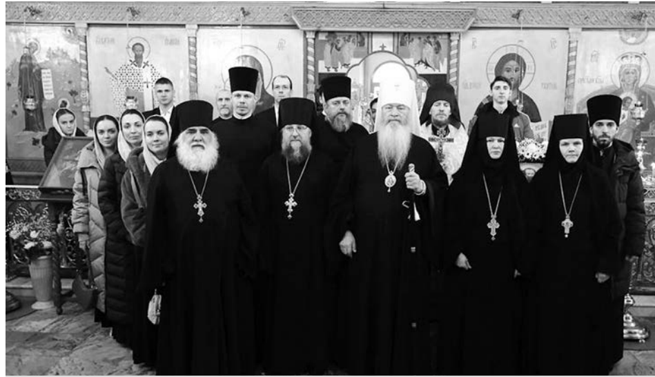
Фотография на память с владыкой Тихоном после Божественной литургии в день памяти святителя Василия Великого.

В завершение митрополит Тихон поздравил молящихся с престольным праздником обители и обратился к присутствующим с архипастырским словом.