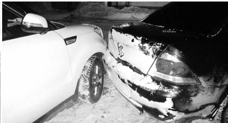
Пример самых характерных ДТП в праздничном Суздале.

од и без ДТП. Так за 8 первых дней января 9 ДТП было зафиксировано в Суздале, 15 – на территории района. К счастью, это были в основном ДТП с материальным ущербом, лишь транспортные средства получили механические повреждения. Безусловно, по отношению к виновным были применены законные решения (в том числе и привлечение к административной ответственности). Специалисты считают, что дорожные происшествия произошли из-за невнимательности водителей и пренебрежения ПДД в трудных погодных условиях. Вот пример. Днём 2