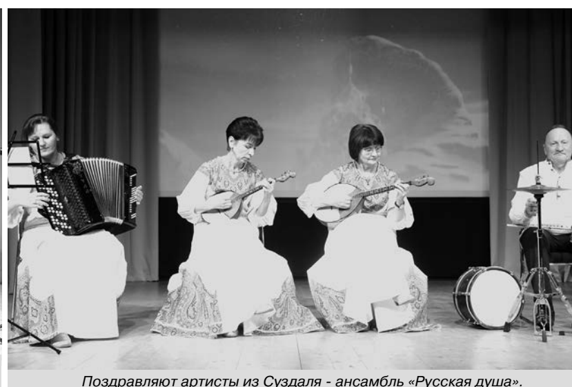
Поздравляют артисты из Суздаля - ансамбль «Русская душа».