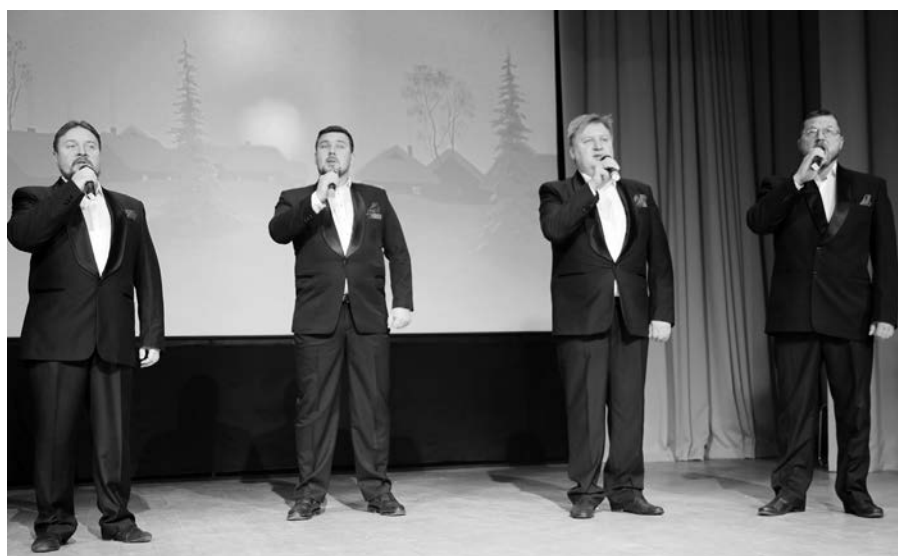
Выступает мужской хор Спасо-Евфимиева монастыря.