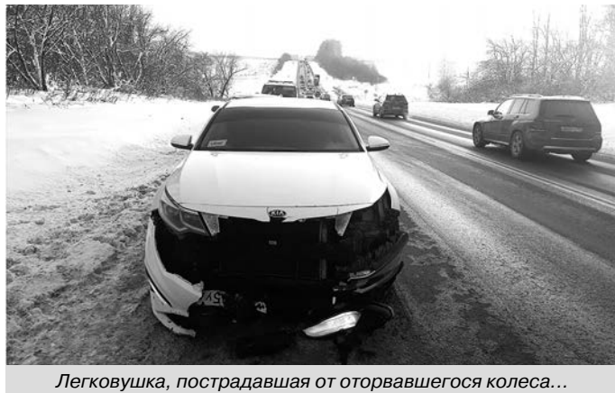
Легковушка, пострадавшая от оторвавшегося колеса...