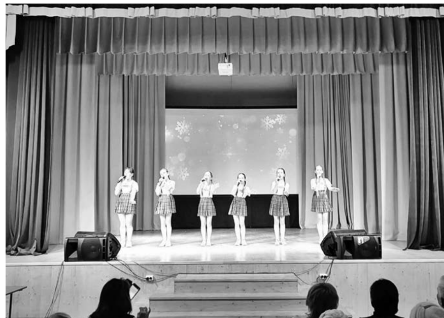
Новая сцена в отремонтированном, современном центре досуга.