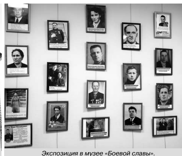
Экспозиция в музее «Боевой славы».