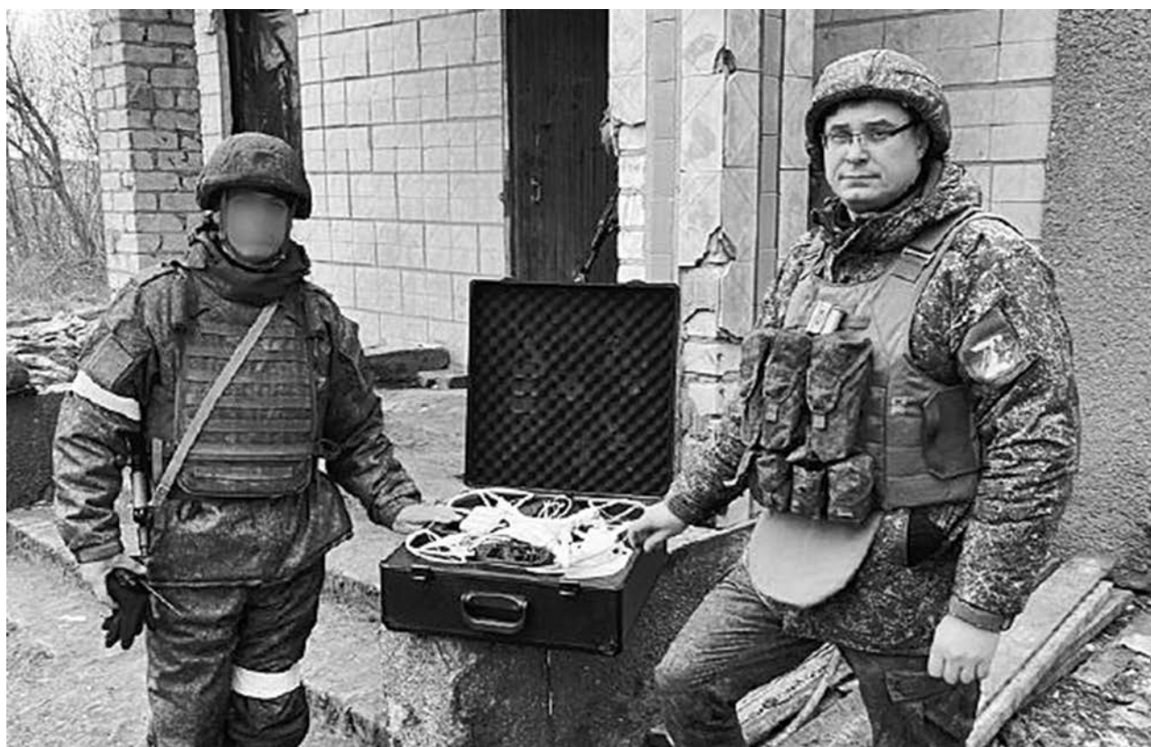
Владимирская область продолжает оказывать гуманитарную помощь братской территории.