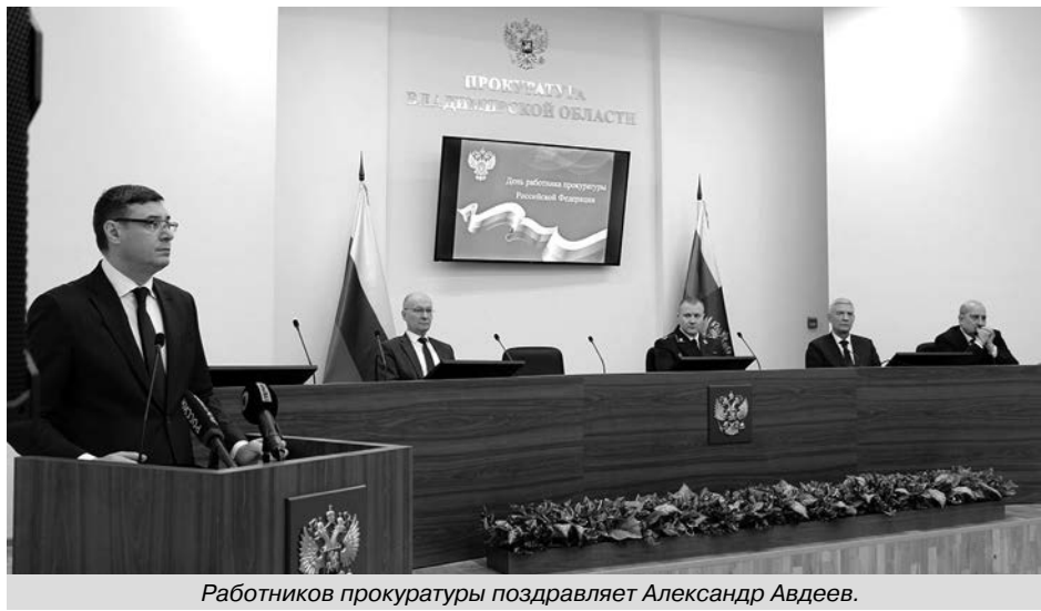
Работников прокуратуры поздравляет Александр Авдеев.

Глава региона подчеркнул, что взаимодействие органов исполнительной власти и прокуратуры в решении актуальных вопросов в сфере обеспечения прав и свобод граждан носит конструктивный характер. Владимирская область демонстрирует интенсивное развитие во всех сферах, реализует государственные программы и нацпроекты,