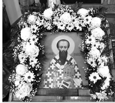
Икона святителя Василия Великого.