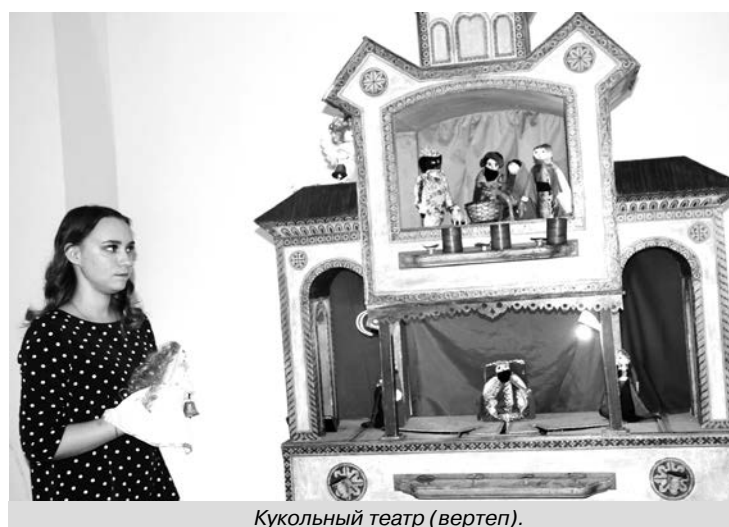
Кукольный театр (вертеп).