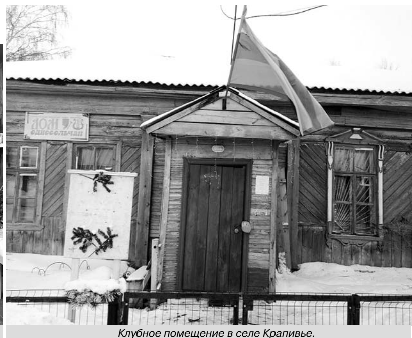
Клубное помещение в селе Крапивье.

Крапивье... Небольшое село недалеко от Суздаля. Село старинное, с храмом Георгия Победоносца, который является памятником архитектуры 17 века. Недалеко от церкви, около дороги стоит старейший деревянный дом, выращенный когда-то зеленой краской, с кирпичного цвета оконными наличниками. Этому дому не менее ста лет. Много повидал он на своем веку: жил в нем когда-то псаломщик, была здесь школа, бегали ребятишки-школьники, которые выпитывали знания своих учителей... Не один десяток лет собирались в нем молодые и пожилые люди, которым он давал приют, с ним связаны события веселые и грустные. Дом этот поистине можно назвать Домом односельчан. И это - сельский клуб.