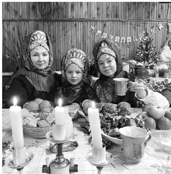
Рождественский сочельник в сельском клубе.