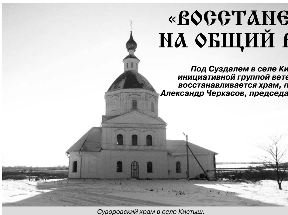
Суворовский храм в селе Кистыш.