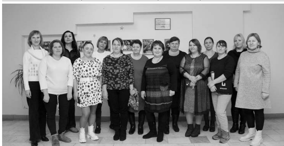
Участницы праздничного мероприятия МО Селецкое.