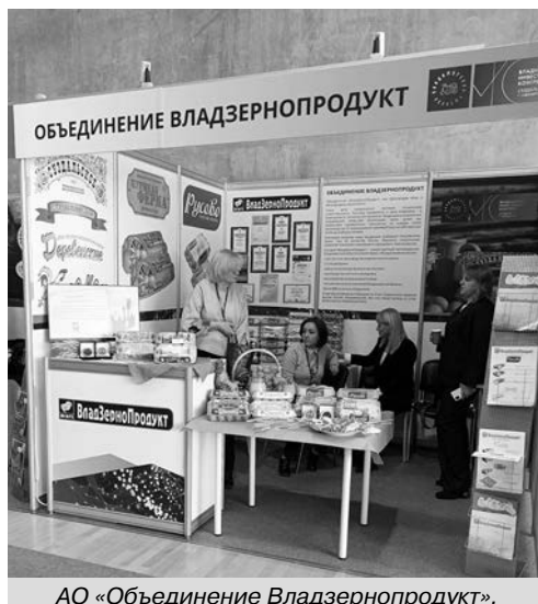
АО «Объединение Владзернопродукт».