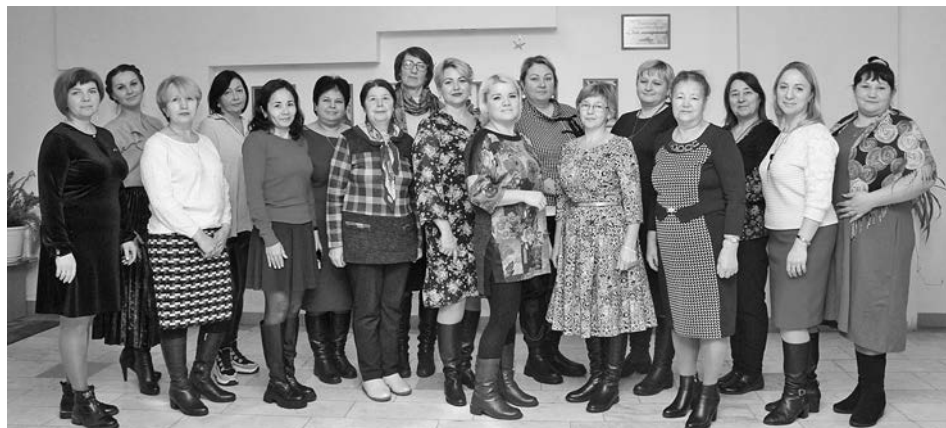
Участницы праздничного мероприятия МО Павловское.