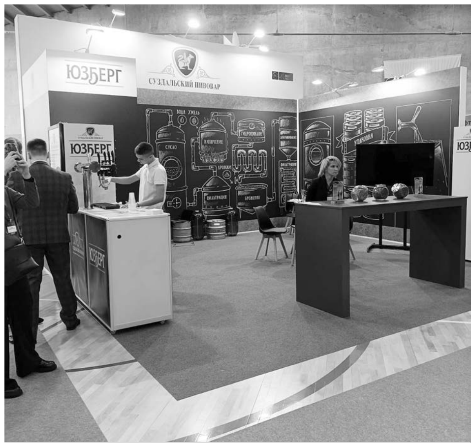
ООО «Суздальский пивовар».

В рамках конгресса была организована выставка-презентация экономического и инвестиционного потенциала Владимирской области. В числе участников были и предприятия Суздальского района.