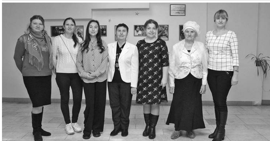
Участницы праздничного мероприятия г. Суздаля.