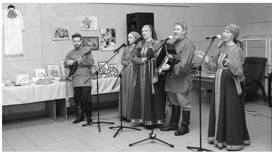
Ансамбль фольклорной песни «Радуница».