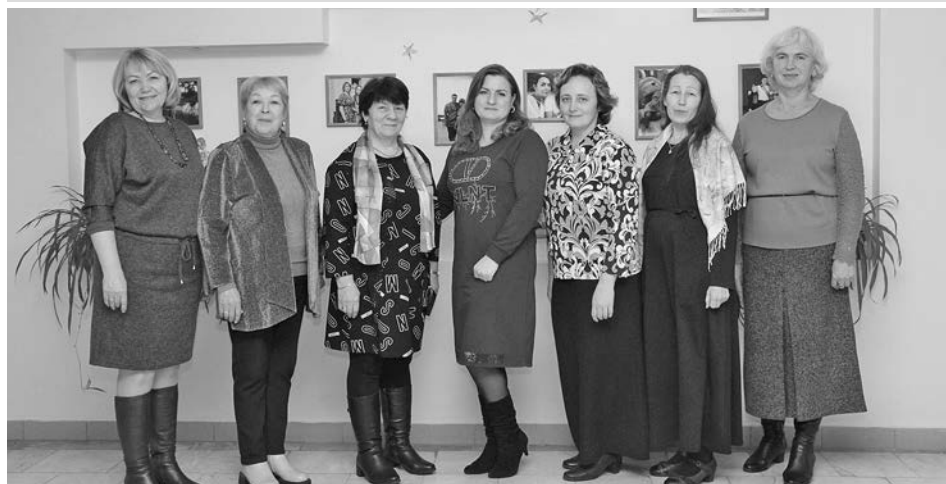
Участницы праздничного мероприятия МО Боголюбовское.