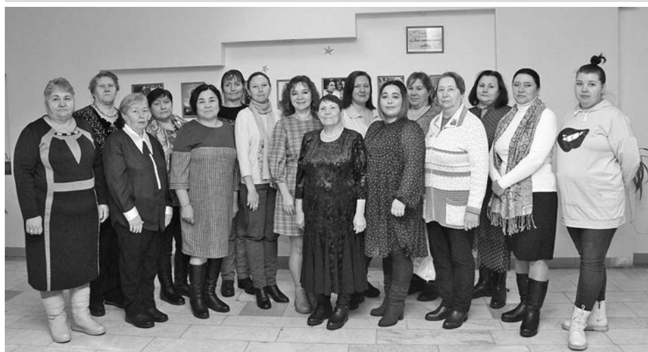
Участницы праздничного мероприятия МО Новоалександровское.