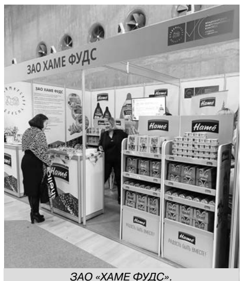
ЗАО «ХАМЕ ФУДС».