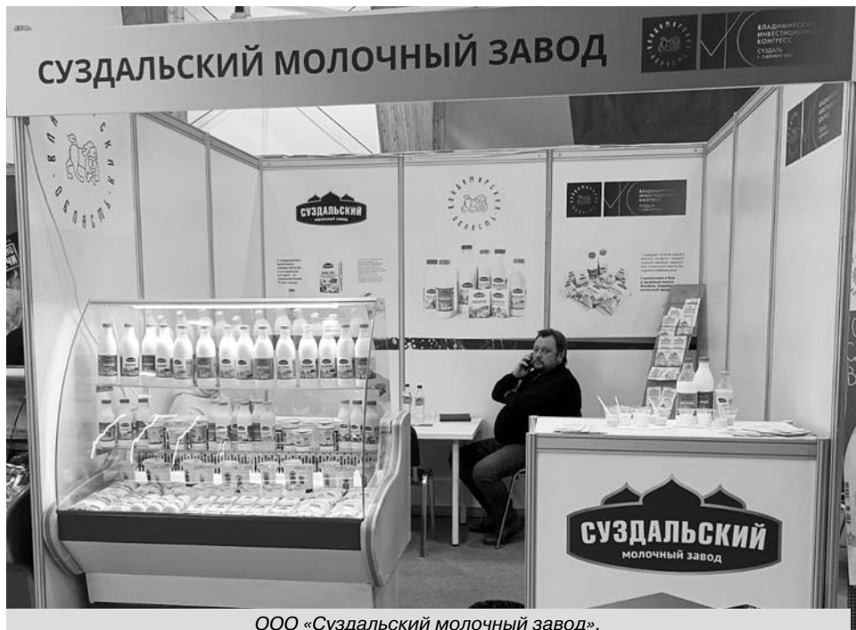
ООО «Суздальский молочный завод».