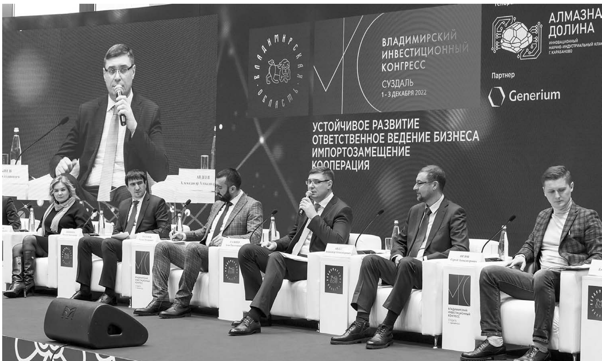
На Владимирском инвестиционном конгрессе выступает Губернатор области Александр Авдеев.