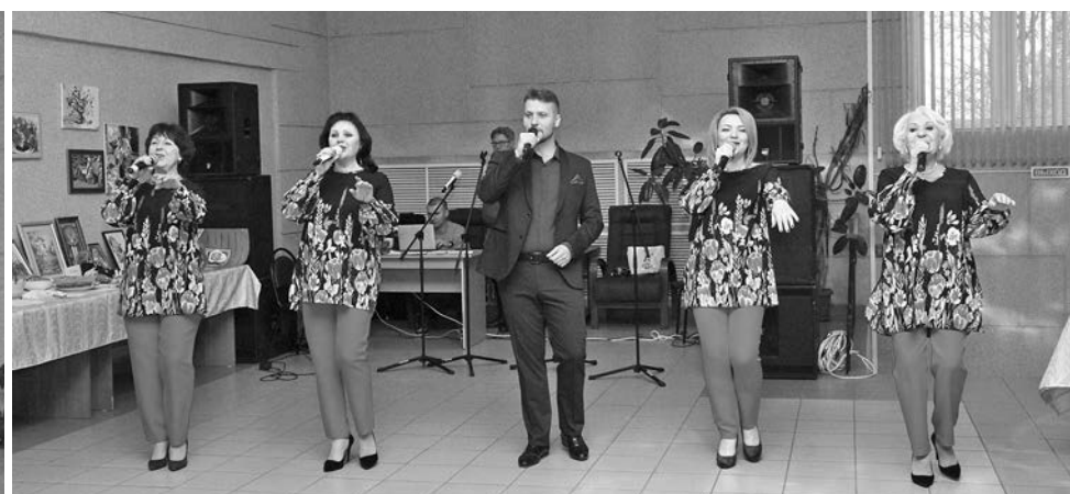
Солисты межпоселенческого культурно-досугового центра Суздальского района.