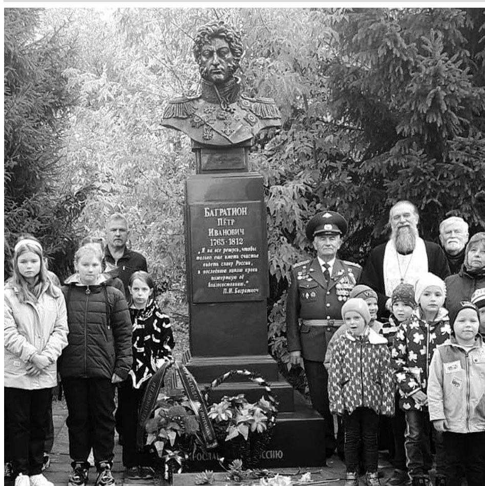
Памятник П.И. Багратиону в селе Сима.