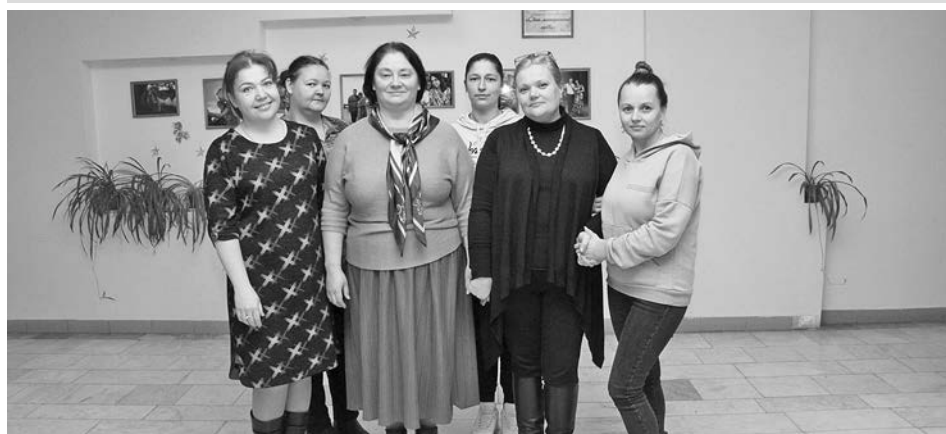
Участницы праздничного мероприятия общественной организации «Свет жизни».