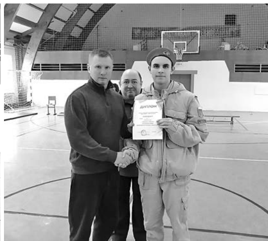
Победителям соревнований вручили дипломы.