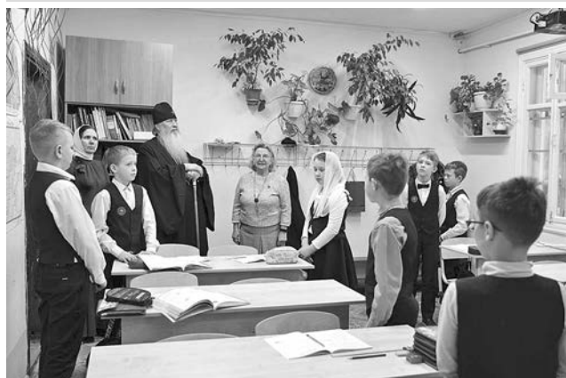
Во время экскурсии по гимназии.