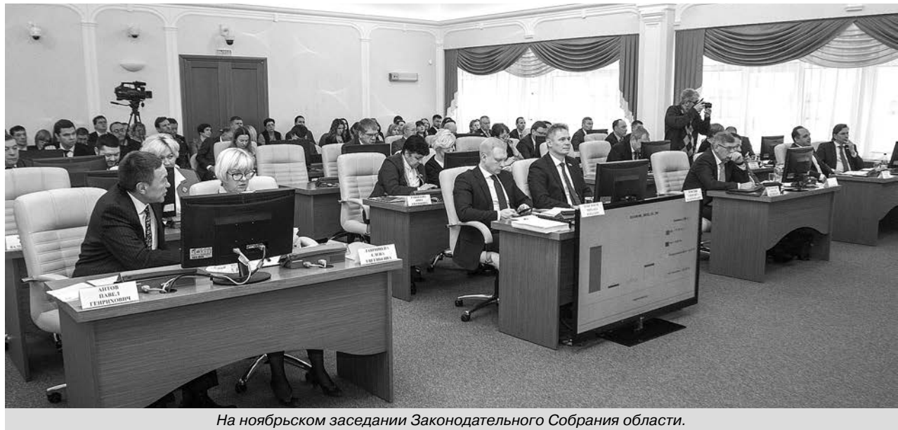
На ноябрьском заседании Законодательного Собрания области.