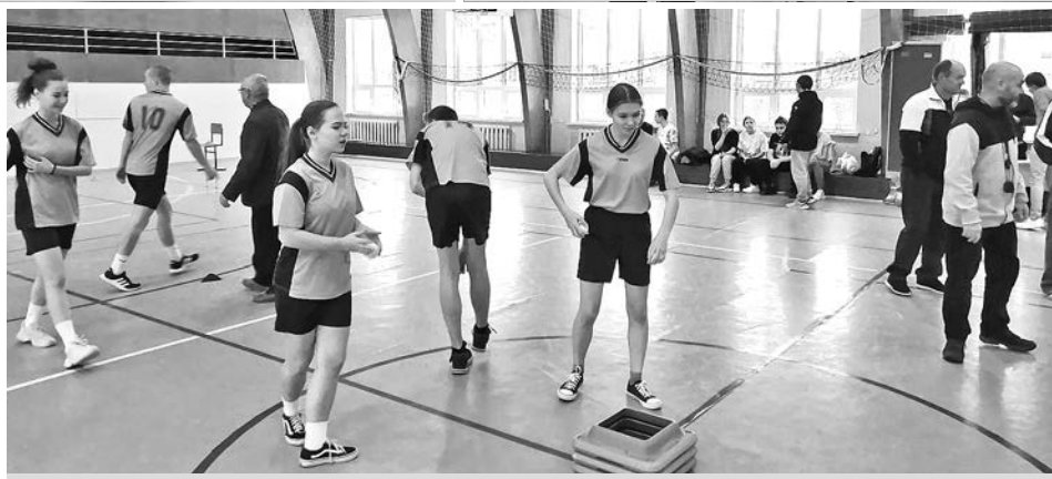
Специальная эстафета состязаний.