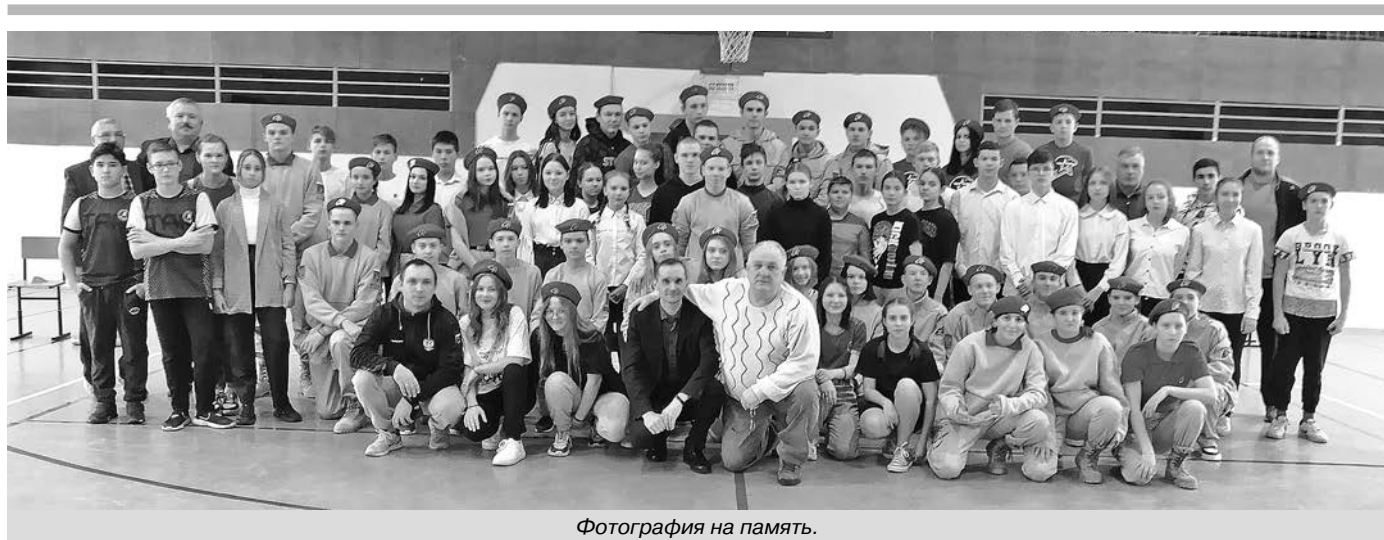
Фотография на память.