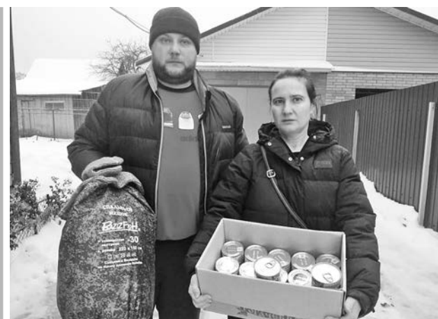
Жители с. Борисовское готовят подарки военнослужащим.