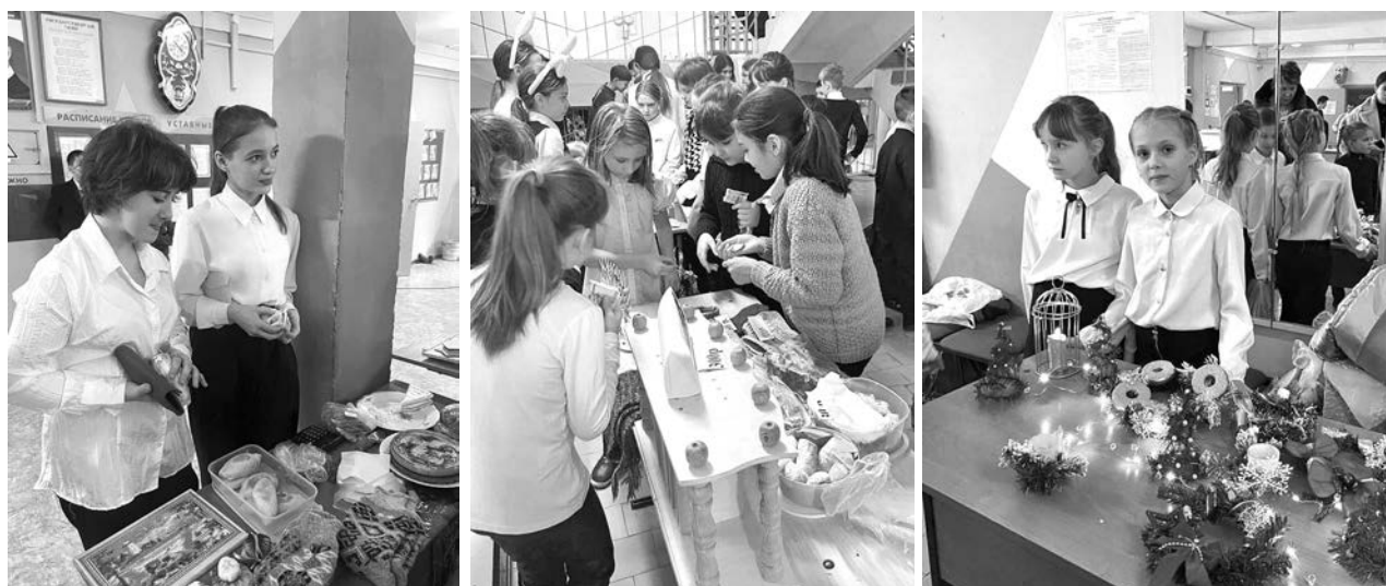
Ученики с большим желанием приняли участие в акции.

Назначение платежа: Добровольные пожертвования для укрепления материально-технической базы военнослужащих при осуществлении мобилизации на территории РФ.