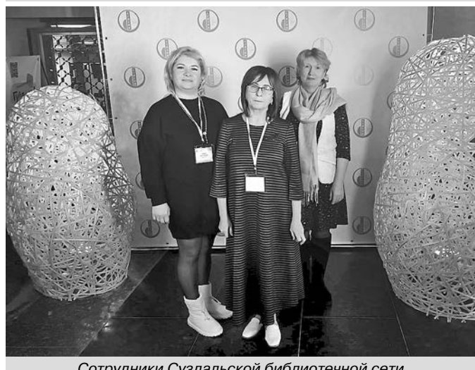
Сотрудники Суздальской библиотечной сети, участники конференции.