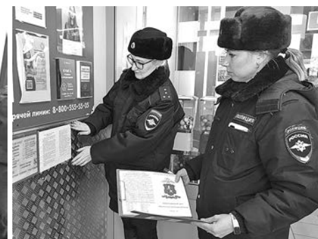
Моменты агитационного мероприятия.