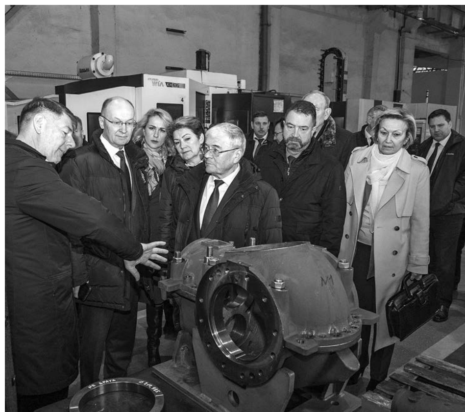
Участники заседания на «Муроммашзаводе».

«Вертикаль власти - это когда не делится полномочия на местные, региональные и федеральные, а когда для жителей власть едина, а она уже между собой делит функции, кто чем занимается. Кто отвечает за контроль, кто отвечает за организацию. Но в целом - это одно государство, одна власть, которая отвечает перед жителями. Поэтому у нас сегодня проблема не с вертикалью власти,