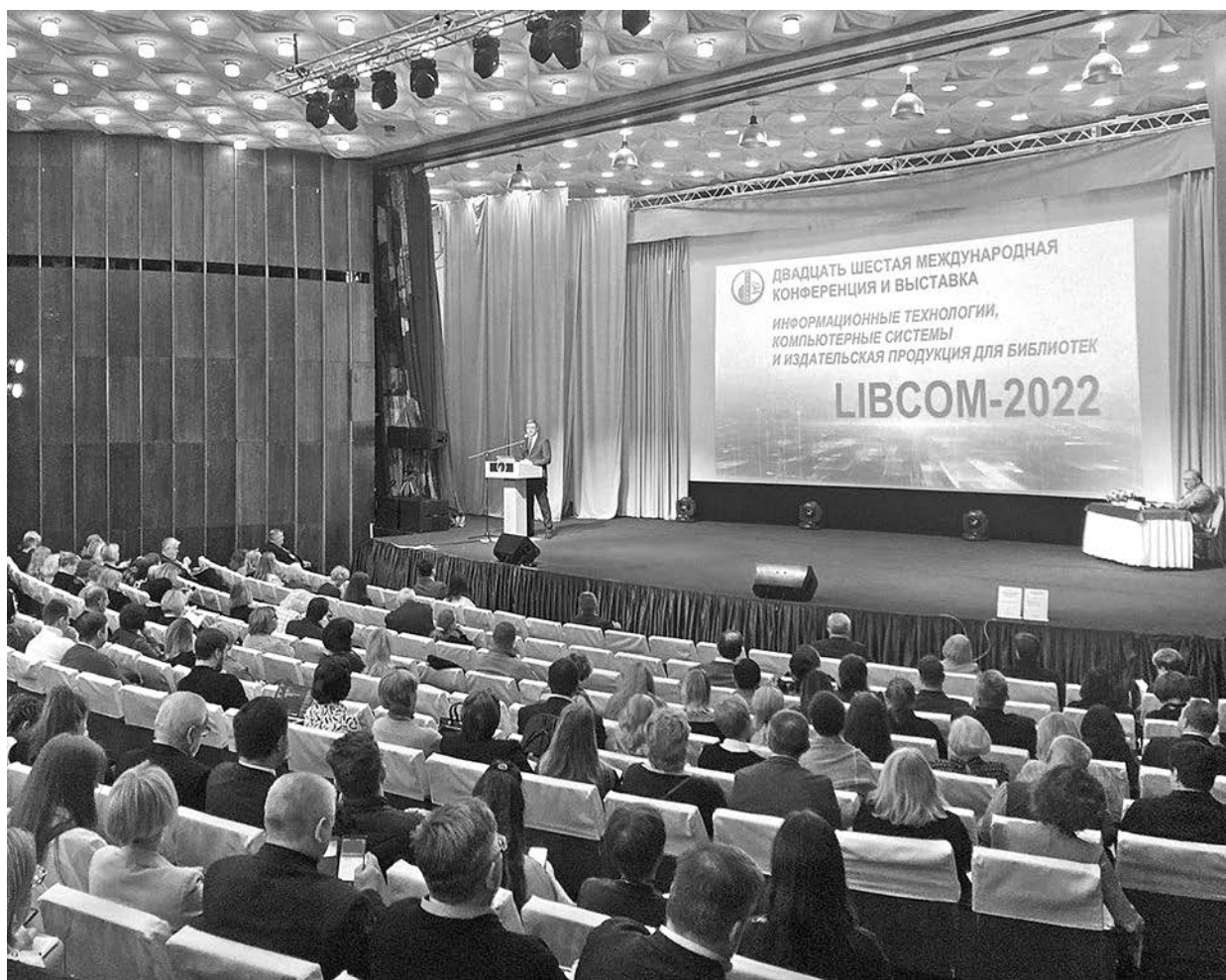
На международной конференции в Суздале.