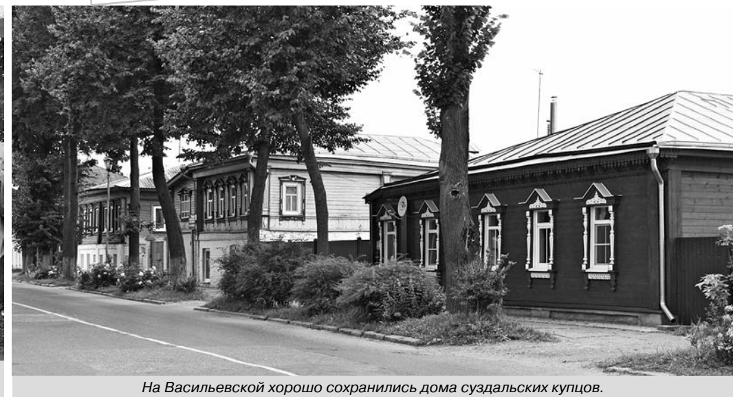
На Васильевской хорошо сохранились дома суздальских купцов.