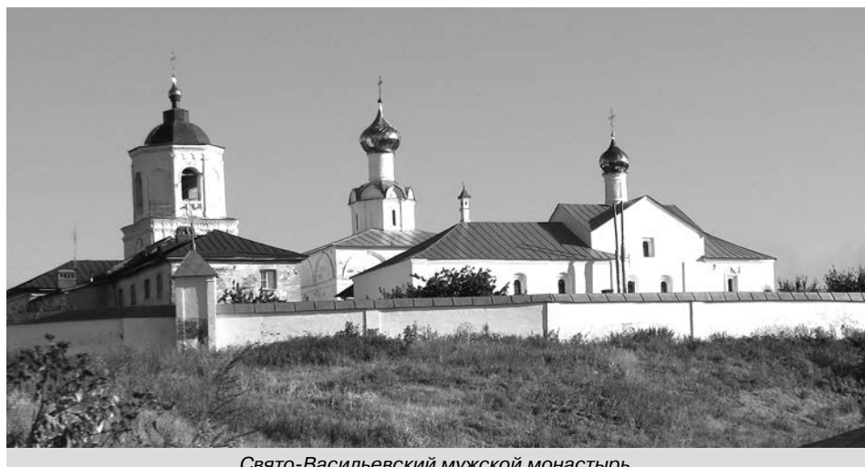
Свято-Васильевский мужской монастырь.