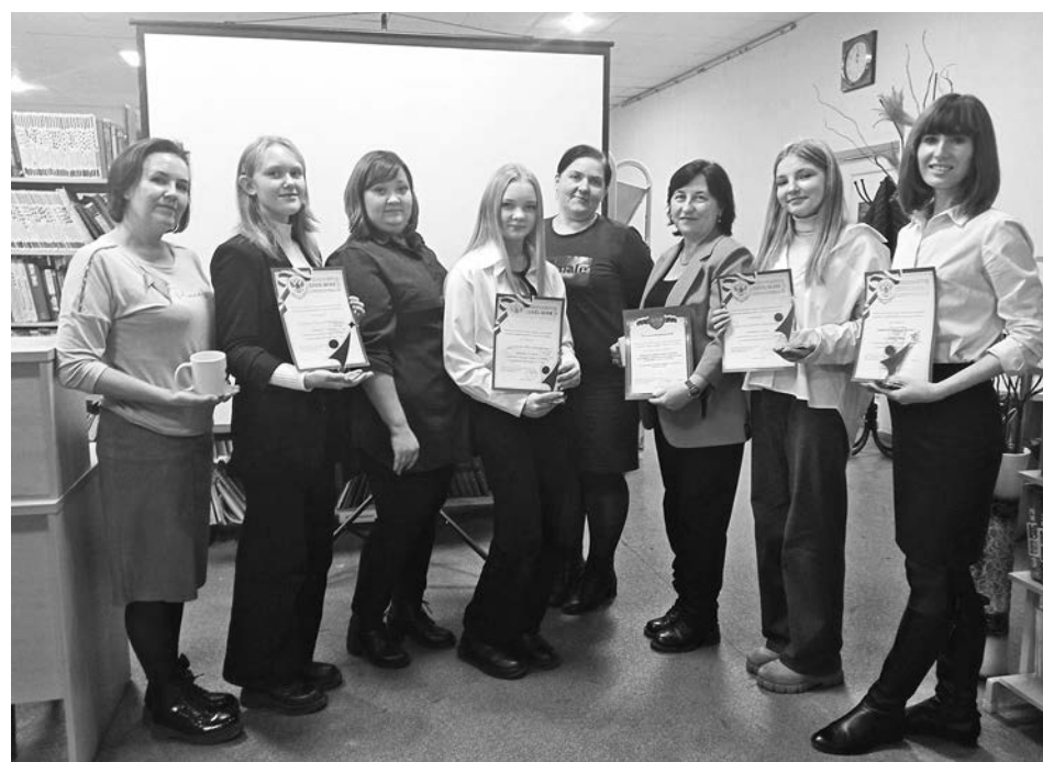
Победители районного конкурса «Лидер XXI века» с членами жюри.

Победители и лауреаты конкурса были награждены дипломами, сувенирами, а руководители - благодарностями за подготовку участников конкурса.