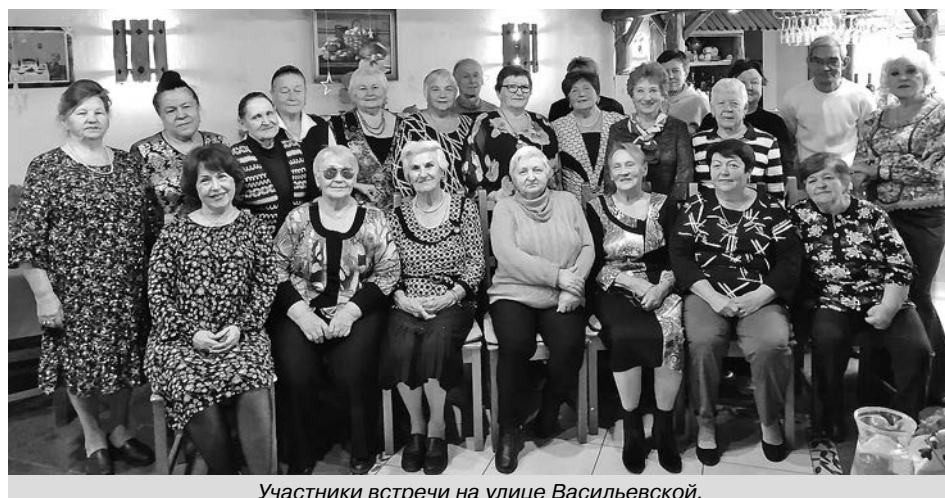
Участники встречи на улице Васильевской.

На улице Васильевской находится дом народной артистки РСФСР Веры Михайловны Фирсовой. На деревянном фасаде его установлена мемориальная доска, на которой написано: «В этом доме родилась и провела детские годы народная артистка РСФСР Вера Михайловна Фирсова». В.М. Фирсова – русская и советская певица, обладающая лирико-колоратурным сопрано. Солистка Большого театра,