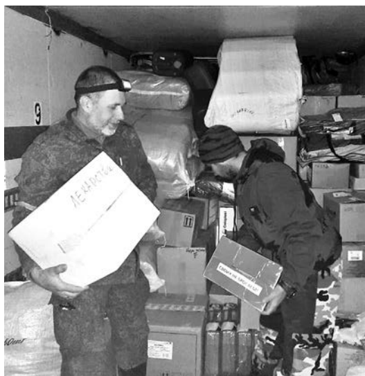
Гуманитарная помощь из Владимирской области в зону СВО.