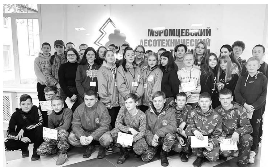
Ученики кадетского класса МБОУ «Стародворская СОШ» - участники областного слета «К поиску готов!».