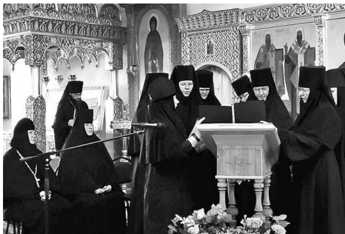
Поет хор сестер Покровского монастыря.