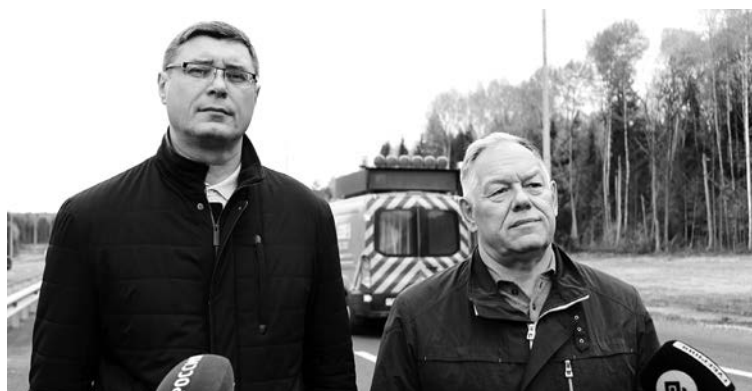
Глава региона А. Авдеев и председатель правления госкомпании «Автодор» В. Петушенко

По словам дорожников, открываемый отрезок второго этапа строящейся трассы фактически готов, осталось только получить разрешение на ввод в эксплуатацию. Движение по нему начнется на два года раньше планового срока. Вводимый в эксплуатацию участок - это первые 26 километров из 220 километров трассы М-12 Москва - Нижний Новгород - Казань, которые проходят по территории Владимирской области.