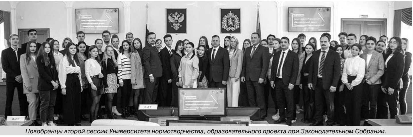
Новобранцы второй сессии Университета нормотворчества, образовательного проекта при Законодательном Собрании.