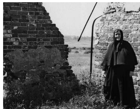
На руинах храма в с. Менчаково, 1994 год.