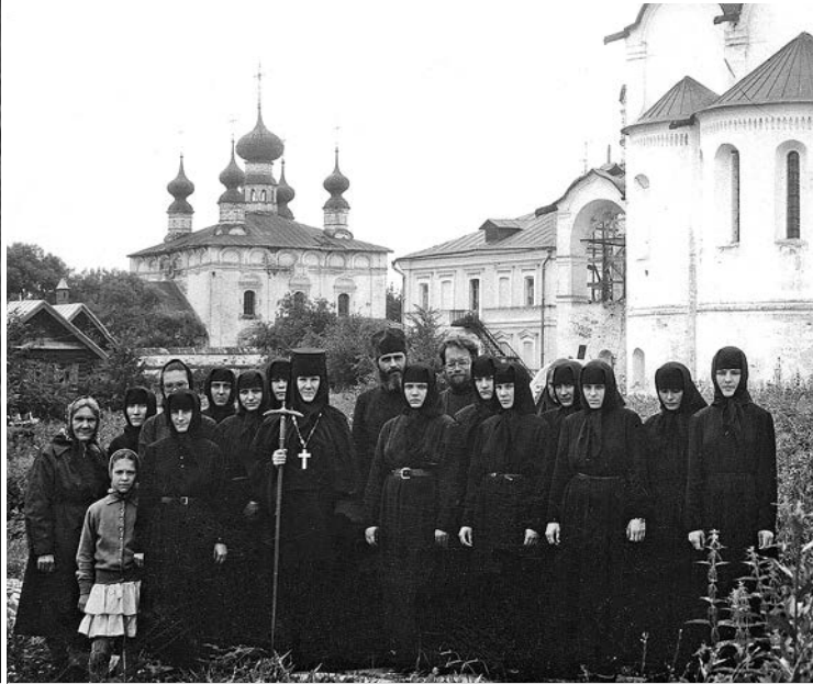
Первые сестры Покровского монастыря, 1993 год.