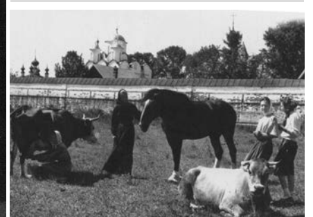
На монастырском поле, 1994 год.