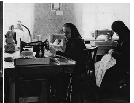
В швейной мастерской.