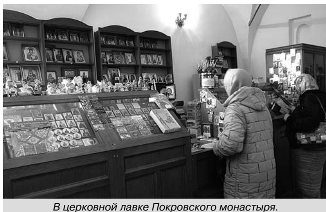
В церковной лавке Покровского монастыря.