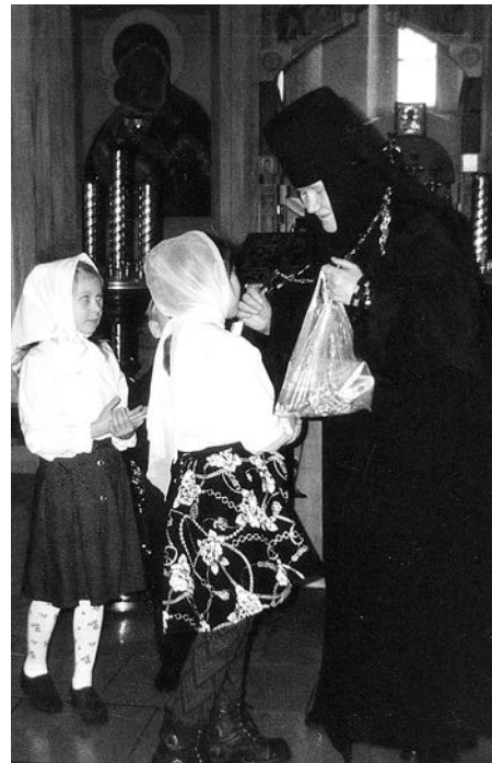
Подарки на Пасху учащимся воскресной школы, 1999 год.