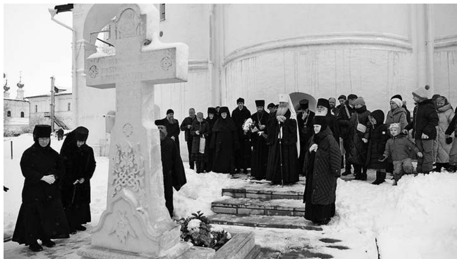
Место захоронения матушки Софии у алтаря Покровского собора.

В 2006 году Святейший Патриарх Алексий II наградил ее медалью прп. Серафима Саровского II степени. В 2014 году в связи с 650-летием Покровского монастыря владыка митрополит Евлогий наградил матушку игумению епархиальной медалью св. князя Андрея Боголюбского I степени.