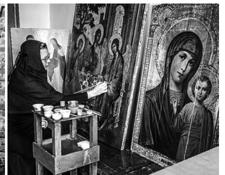
В иконописной мастерской.