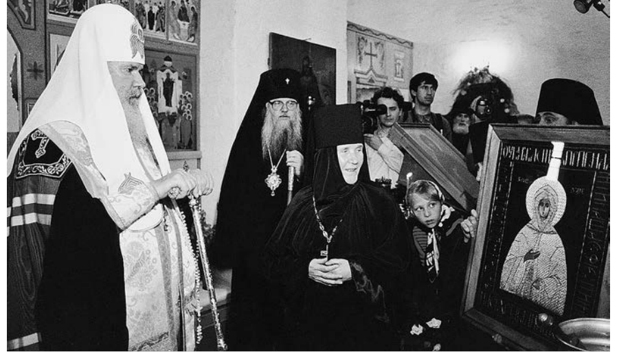
Приезд Патриарха Московского и всея Руси Алексия II в обитель, 1995 год.

Игумения София осталась в памяти знавших ее теплым, светлым человеком. Людей привлекали в ней отзывчивость, простота, жизненный опыт. Многие, вырываясь из суеты дел, стремились к ней в Покровскую обитель.