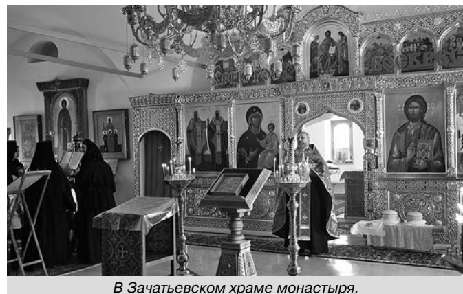
В Зачатьевском храме монастыря.