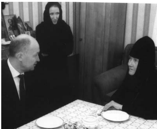
С председателем Законодательного Собрания области В. Киселевым, 2013 год.