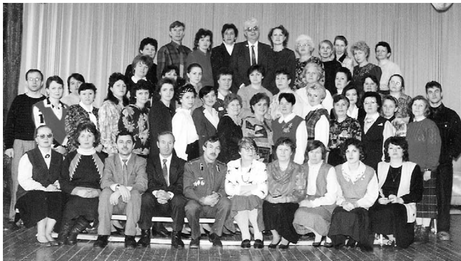
Коллектив школы №1 г. Суздаля, 1995 г.

Моим наставником я считаю также Ярослава Львовича Скворцова, декана факультета международной журналистики МГИМО МИД России. Я благодарна ему за помощь в открытии в первой школе Суздаля современного кабинета русского языка и