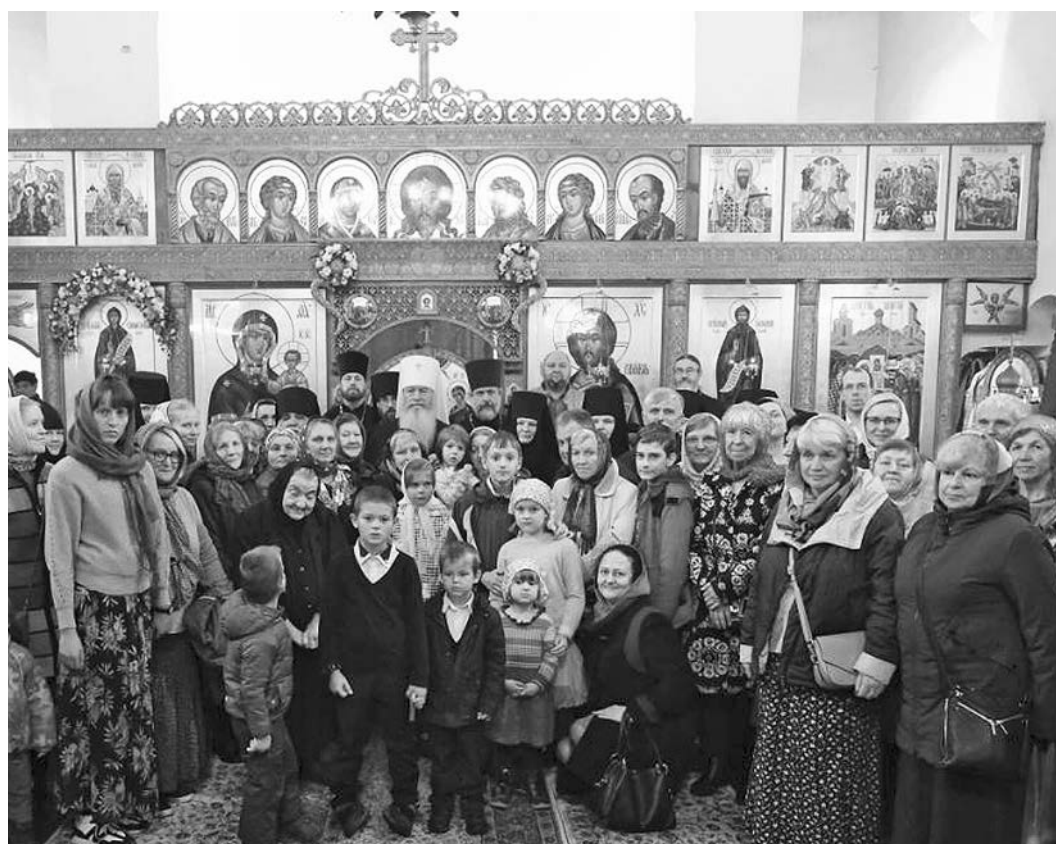
Фотография на память прихожан с владыкой Тихоном после праздничной службы.