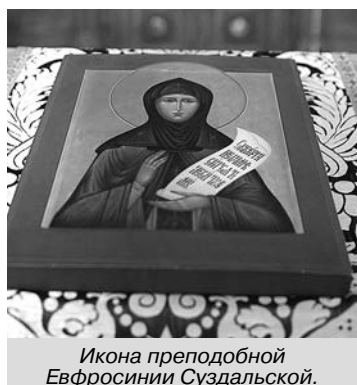
Икона преподобной Евфросинии Суздальской.

1 октября 2022 года, в день памяти преподобной Евфросинии Суздальской, на Торговой площади города Суздаля традиционно прошла Евфросиньевская ярмарка.