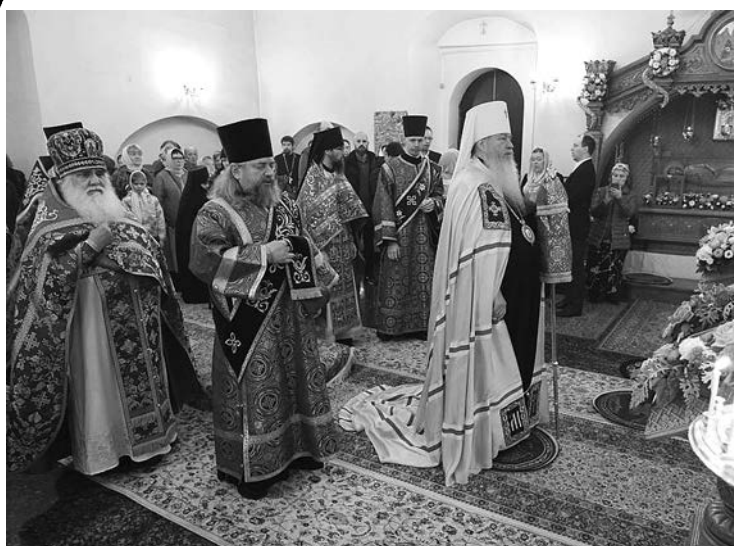
На Божественной литургии в Ризоположенском монастыре. Служит владыка Тихон.