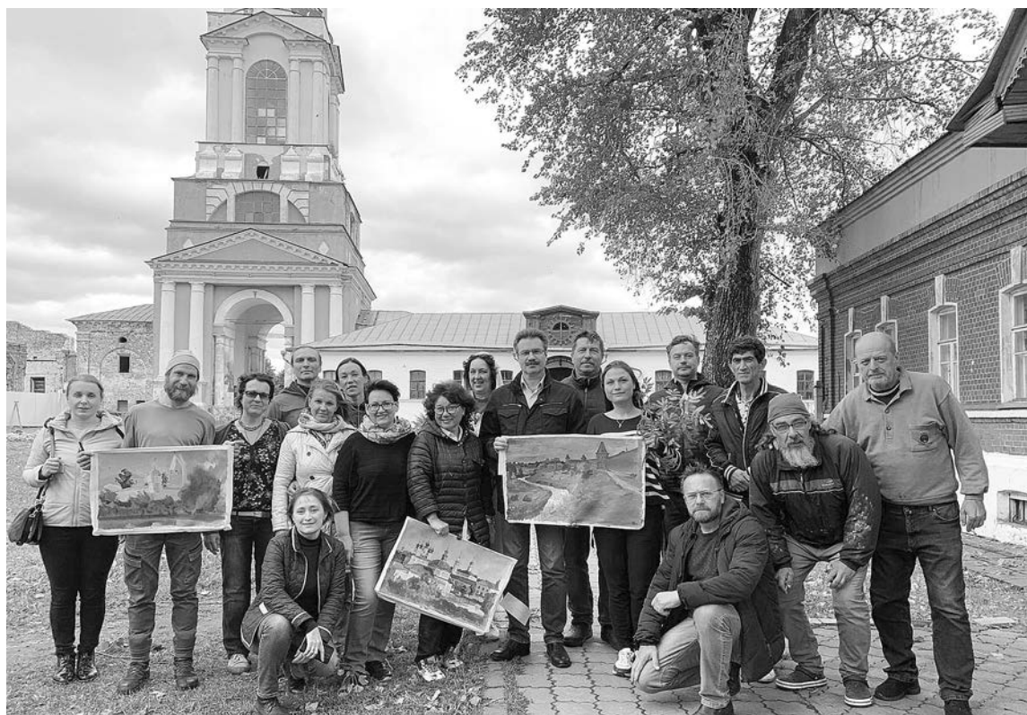
Участники пленэра «Русская Атлантида» - 2022 в Суздале.