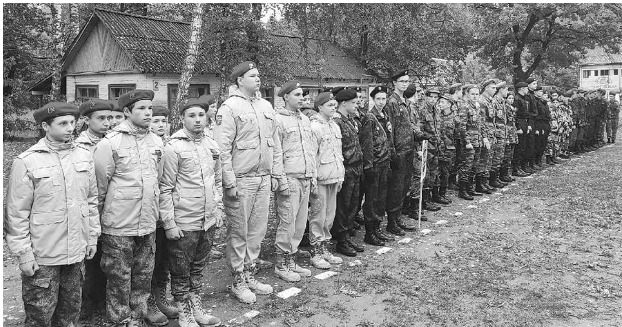
Общее построение участников. Слева команда Садовой средней школы.

Прием будет проводиться по адресу: г. Суздаль, ул. Ленина, д. 78 (районная библиотека), 2 этаж.