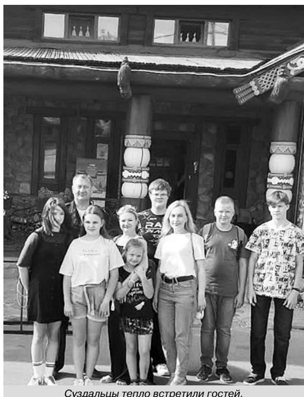
Суздальцы тепло встретили гостей.