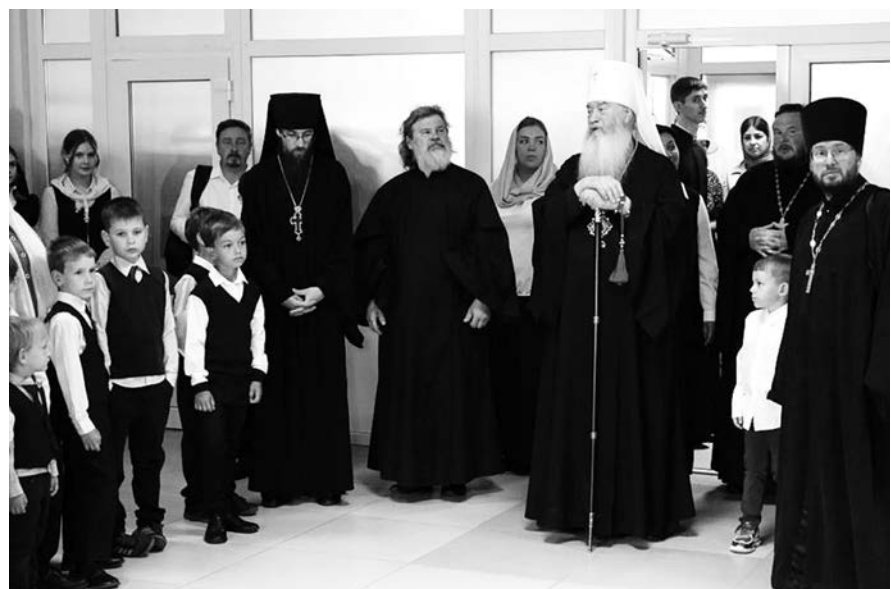
Во время посещения православной школы имени Арсения Элассонского.