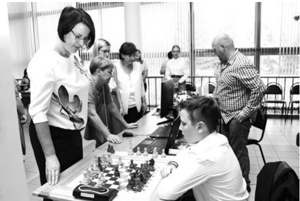
Перед началом конференции у ее участников была возможность познакомиться с тематическими выставками, презентациями передового опыта, результатами творческой деятельности учеников и педагогов школ Суздальского района.