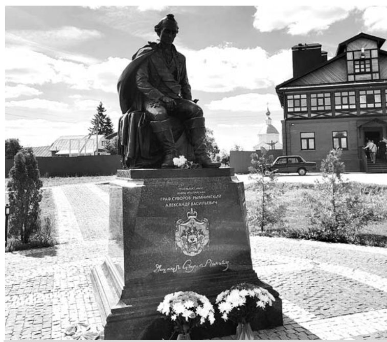
Памятник полководцу Александру Суворову в с. Кистыш.