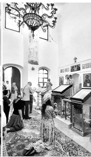
На литургии в День памяти Святого Пророка Илии.