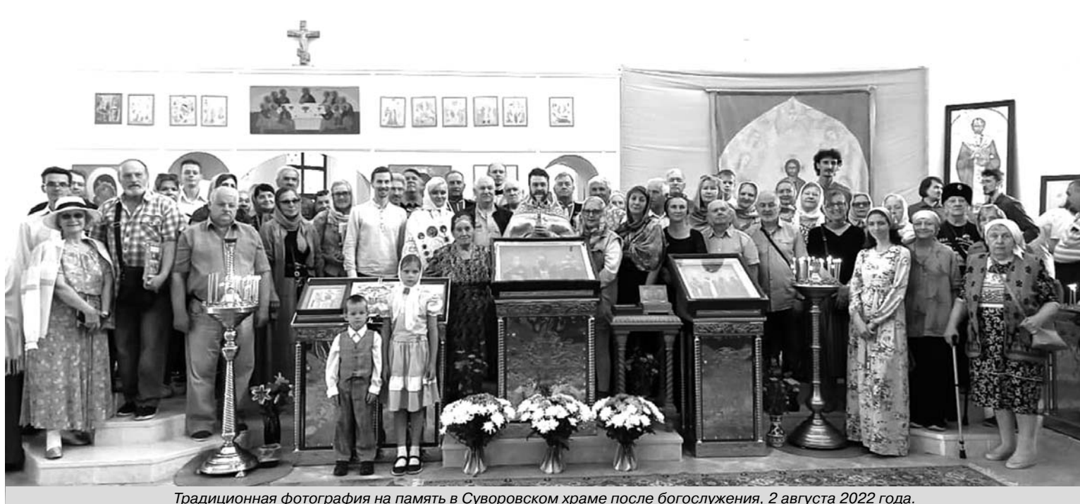
Традиционная фотография на память в Суворовском храме после богослужения, 2 августа 2022 года.