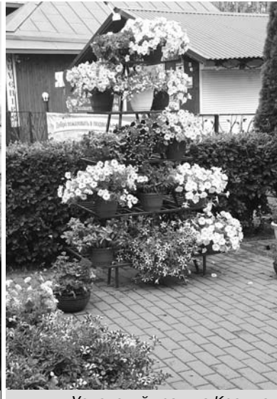
Успенский храм на Кремлевской поражает обилием цветов.