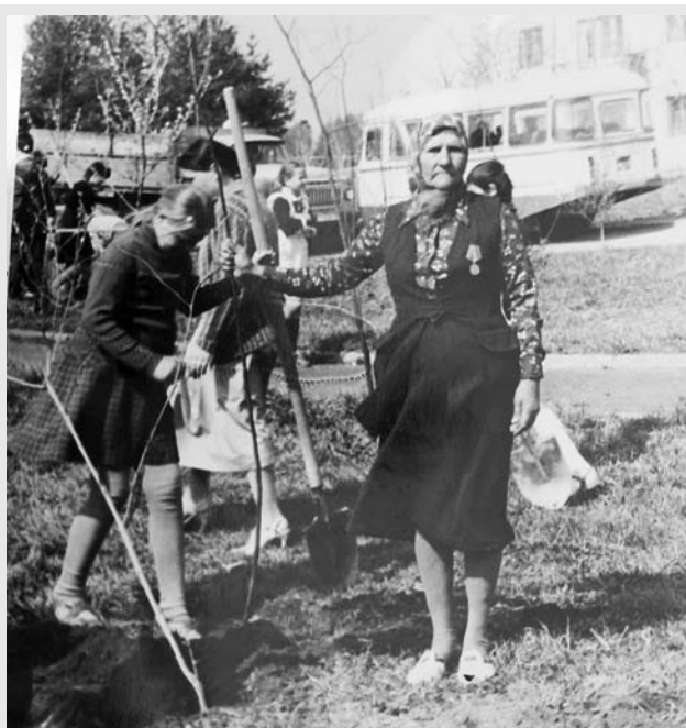
Закладка Аллеи памяти в 1987 году. Эти фотоснимки уже история поселка Красногвардейский. Они как и многие другие будут размещены на стенде, установленном на Аллее памяти.