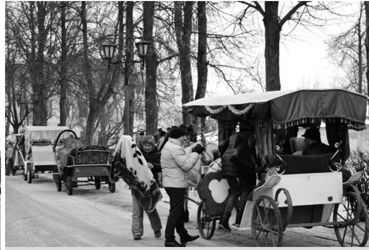
И в будни, и в выходные дни услуги лошадиного извоза всегда востребованы.