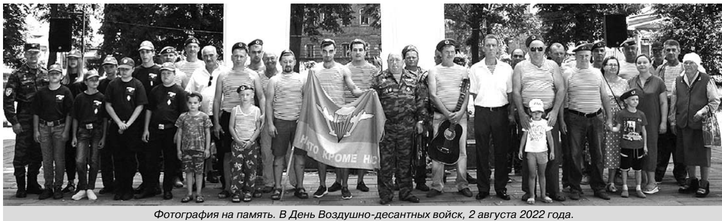
Фотография на память. В День Воздушно-десантных войск, 2 августа 2022 года.