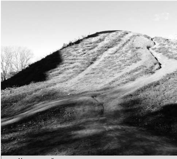
«Умирающий» вал – памятник градостроительства.