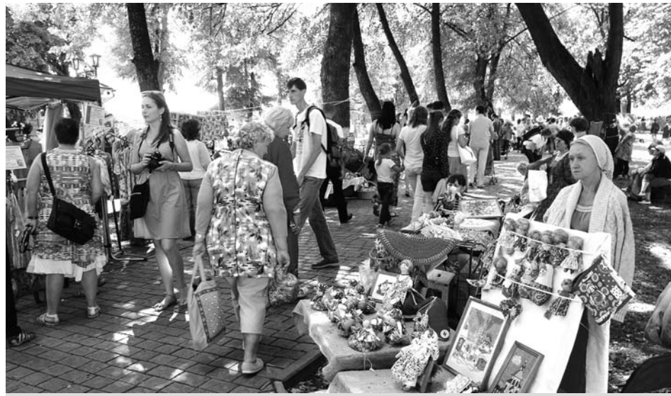
Бойкая торговля приезжих мастеров на Кремлевской улице.

Отменить услугу лошадиного извоза, которая несмотря на очень высокие цены востребована, конечно нельзя. Много вопросов возникает с точки зрения правил дорожного движения. Вопрос об ограничении количества животных в кремле назрел уже давно. Для всех уже очевидно, что 15 верховых лошадей, пони и повозок – это тот максимум, который возможен в кремле со всех точек зрения: и со стороны безопасности, и со стороны экологии. А сейчас в выходные дни их количество достигает полусотни. Для остальных извозчиков необходимо определить другие места парковки и маршруты или составить график работы на ул. Кремлевской, исходя из допустимого количества лошадей. Сильный запах от испражнений животных проникает и в Успенский храм, и в магазины, и в дома жителей, не говоря уже о том, какое