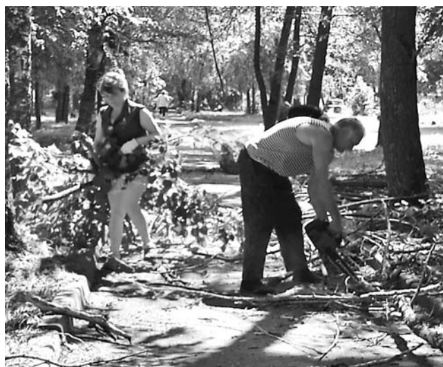
Работы на субботнике было много и ее хватило всем – и молодым, и пожилым, и даже детям.