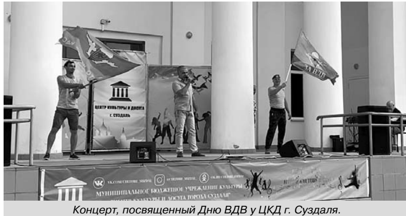
Концерт, посвященный Дню ВДВ у ЦКД г. Суздаля.