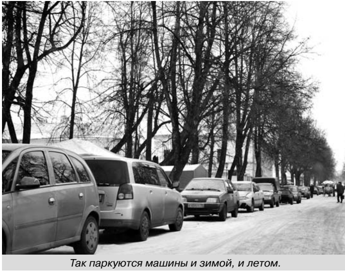
Так паркуются машины и зимой, и летом.