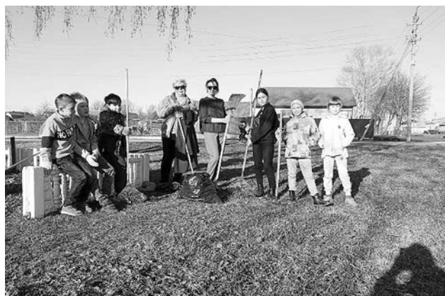
Волонтеры культуры и жители Суздальского района – участники акции «Заботимся, помним, гордимся!»

помощи жителям Донбасса, которые были вынуждены покинуть свои дома из-за угрозы военных действий со стороны вооруженных сил Украины.