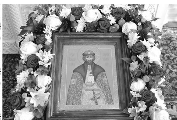
Икона св. бл. великого князя Андрея Боголюбского.

Владыка поздравил всех с престольным праздником и обратился ко всем присутствующим с назидательным словом.