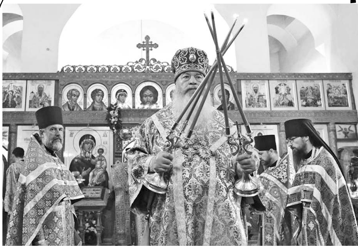
Митрополит Владимирский и Суздальский Тихон на литургии в Ризоположенском женском монастыре.