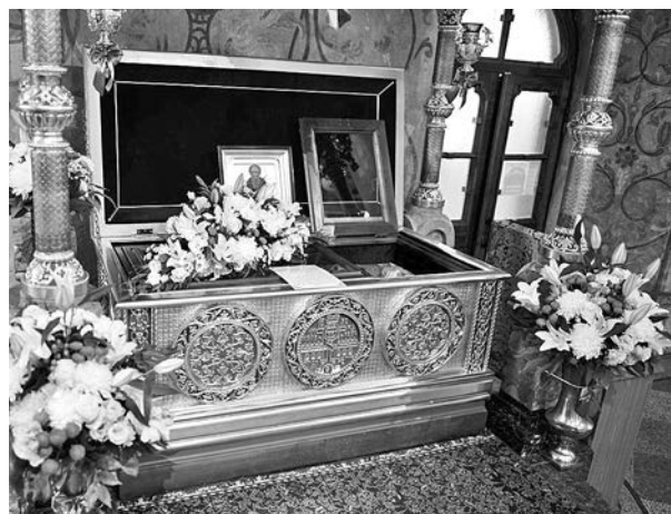
Рака с мощами св. пр. Евфимия.