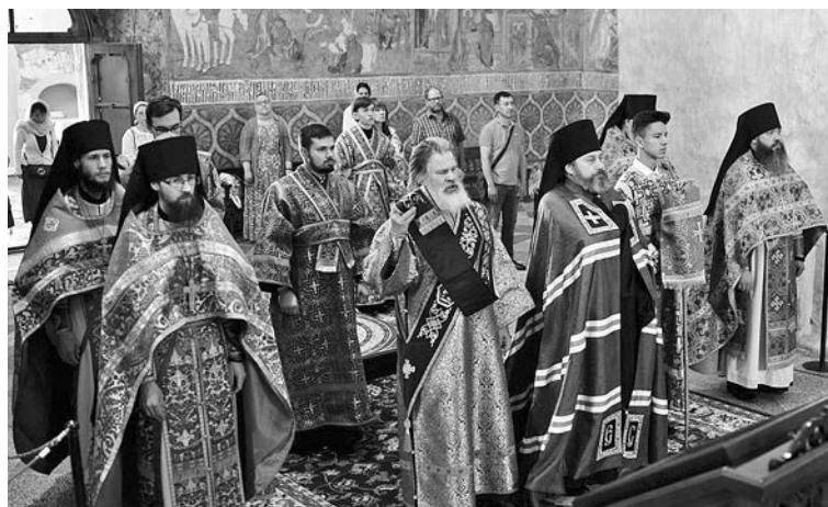
Божественную литургию возглавил епископ Ковровский Стефан.