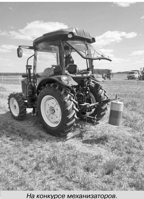
На конкурсе механизаторов.