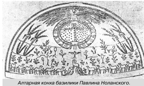
Алтарная конха базилики Павлина Ноланского.

В 2011 году при проведении археологических работ в интерьере собора был найден омфалий («пуп») – крупный камень с розовым оттенком круглой формы, который занимал особое место среди церкви. Камень отмечал положение священнослужителей и архиерея во время некоторых служб. Эта традиция попала на Русь с мастерами и не была повсеместной. Несомненно, что омфалий являлся следствием выдающегося заказа. Каменный омфалий в Кидекше уникален. В древнерусской архитектуре домонгольского периода известен только мозаичный экземпляр X в. в Десятинной церкви Киева.