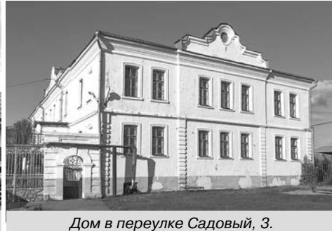
Дом в переулке Садовый, 3.