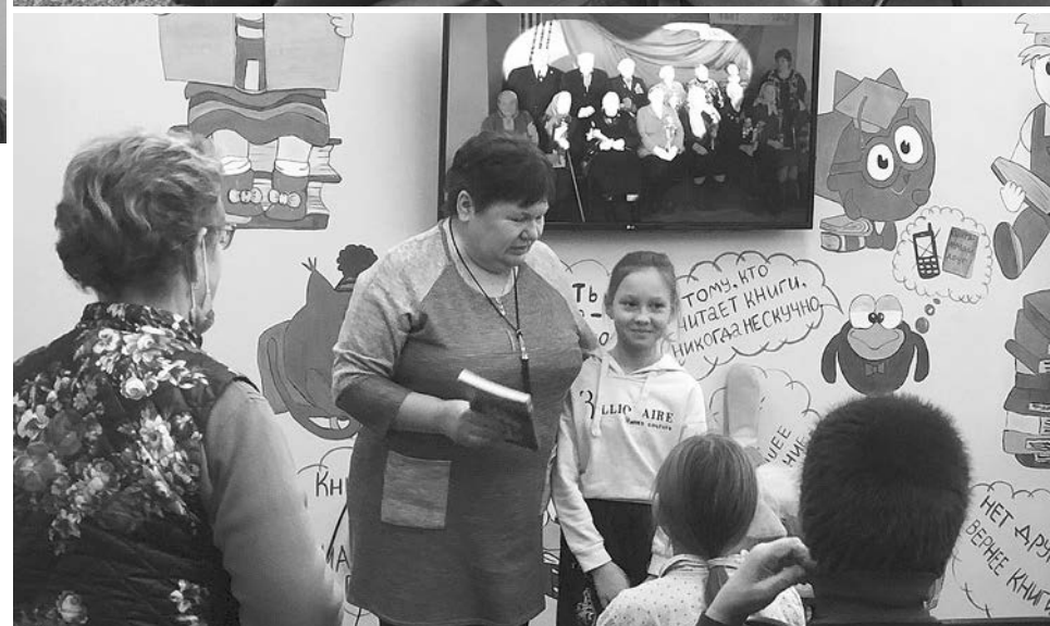
На премьере фильма «Дети войны – дети Победы».