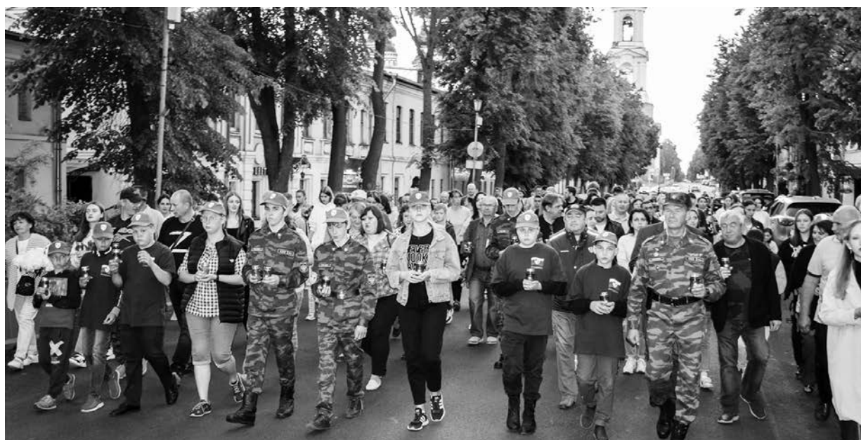
Колонна участников акции «Свеча памяти» направляется к Вечному огню.