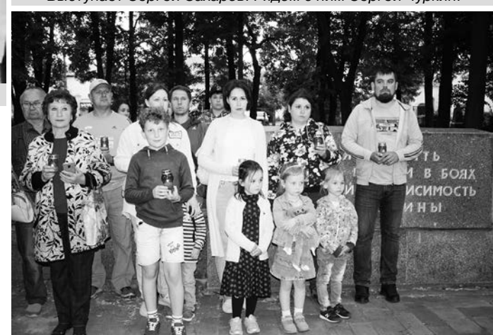
Многие жители к Вечному огню пришли вместе с детьми.