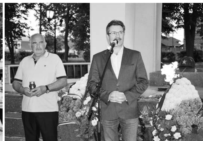
Выступает Сергей Сахаров. Рядом с ним Сергей Чуркин.