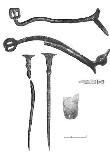
На фотографии: шпоры (вверху), писала (внизу слева), книжная застежка (внизу справа)

Обращает на себя внимание тот факт, что такие массовые категории находок как свинцовые товарные пломбы и амфоры встречаются во всех районах города, при этом фрагменты амфорной тары фиксируются почти повсеместно. Значительно реже встречаются находки, связанные с элитой средневекового общества (книжные застежки, писала, актовая печать, изделия из драгоценных металлов, стеклянная посуда), в том числе профессиональными войнами (элементы парадной сбруи, в том числе декорированной медной наводкой, стремена, шпоры, копы, булавы, броневые стрелы). Зачастую на одном дворе фиксируются находки, относящиеся к разным категориям. Не удается выделить какие-то «аристократические» районы города. Напротив, элита глубоко инкорпорирована в городскую среду: усадьбы с богатым и разнообразным набором инвентаря фиксируются как на участках защищенных стенами кремля и острога, так и на неукрепленных посадах.