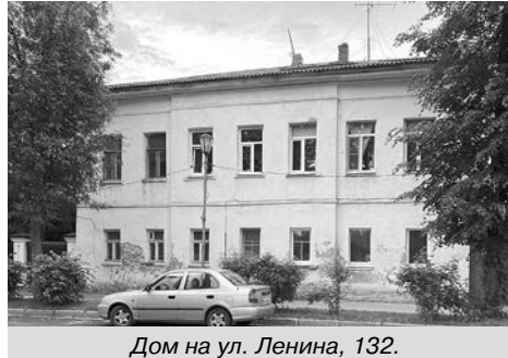
Дом на ул. Ленина, 132.