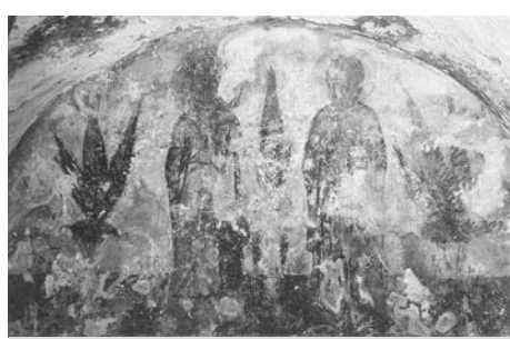
Святые Мария и Ефросиния. Роспись северного аркосолия церкви Бориса и Глеба в Кидекше. Фото С. 164 А. Скворцова «Белокаменное зодчество».

В алтаре сохранились фрагменты пелен-уброров (полотенец) с изображением растительных мотивов в виде семисвечников – символов Богоматери. На фрески этот мотив перешел видимо с тканевых завес, которыми в первые века христианства отделяли помещения для молящихся. Такие же пелены присутствуют на столбах в северной и южной части храма.