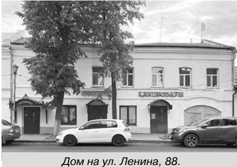
Дом на ул. Ленина, 88.