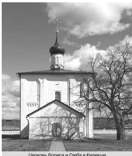
Церковь Бориса и Глеба в Кидекше.

В алтарной конхе (перекрытие в форме полукупола) изображена рука из облаков – символ соизволения Бога-Отца. В круглом медальоне, усеянном звездами, находится крест, обозначающий искупительную жертву Христа, священный символ вечной жизни и избавление от страданий. Святая Троица: Христос в виде Агнца, Бог-Отец говорящий с неба, Святой дух в виде голубя. Гора обозначает церковь. Четыре ручья – реки райские: Фисон, Гион, Тигр, Евфрат, позднее обозначали четырех евангелистов, распространявших учение Христа по странам света. Агнец с нимбом на горе у подножия креста – Христос. Овцы – символы душ праведников, двенадцать Агнцев-апостолов. О значении Христа говорит его положение в центре композиции, симметричные позы овец, повернувшихся к нему. Можно также предположить, что птицы вокруг креста – орлы. Они, улетающие в заоблачную высь, символизируют Вознесение Христа, а опускающиеся на землю олицетворяют нисхождение Божьей Милости. Количество птиц двенадцать, предположительно символизируют двенадцать апостолов. Мастера пришли к Юрию Долгорукому из Галицкой Руси, принесли не только архитектурные формы, но и живопись. Искусство этих мастеров было связано со странами Балканского полуострова – Македонией, Болгарией, Сербией. Совместная работа суздальских мастеров с пришедшими строителями и художниками привела к появлению новых тенденций в искусстве Суздальской Руси. Постепенно закладывались основы Владимиро-Суздальской живописной школы.