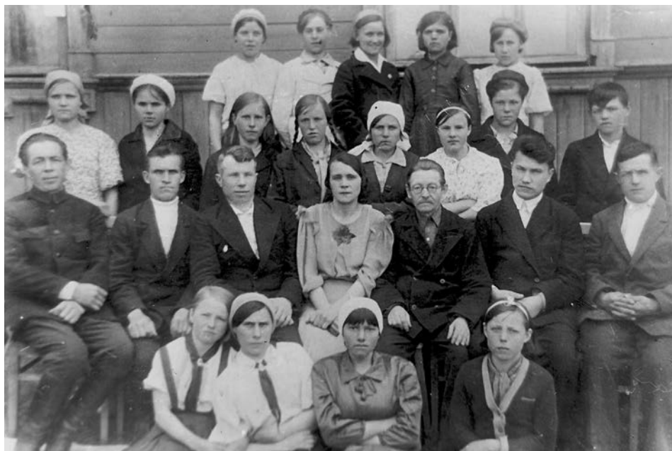
Выпускники Павловской семилетней школы и их учителя. Снимок сделан за несколько дней до войны...

«Великая Отечественная началась для меня с первых дней, хотя я ещё не была на фронте. Горький – город и автозавод – являлись для немцев ориентиром номер один. Мы, комсомолцы, принимали участие в рытье котлованов, в дежурстве на