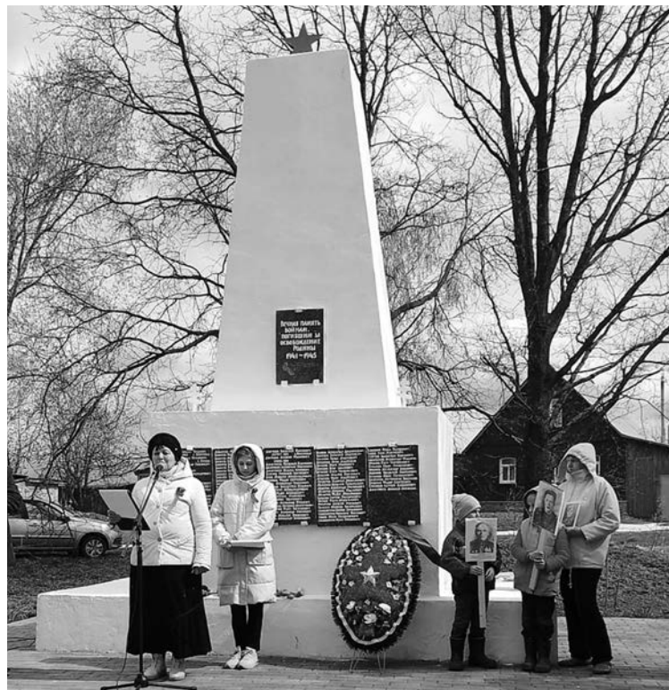
На праздничных мероприятиях 9 Мая.