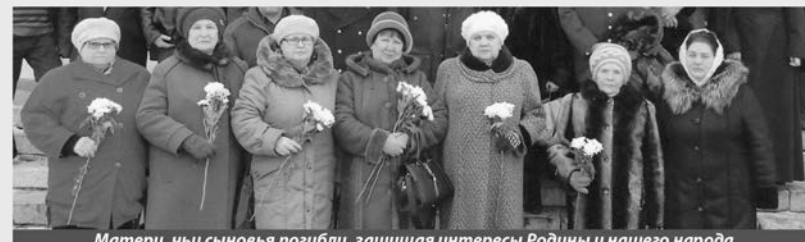
Матери, чьи сыновья погибли, защищая интересы Родины и нашего народа.