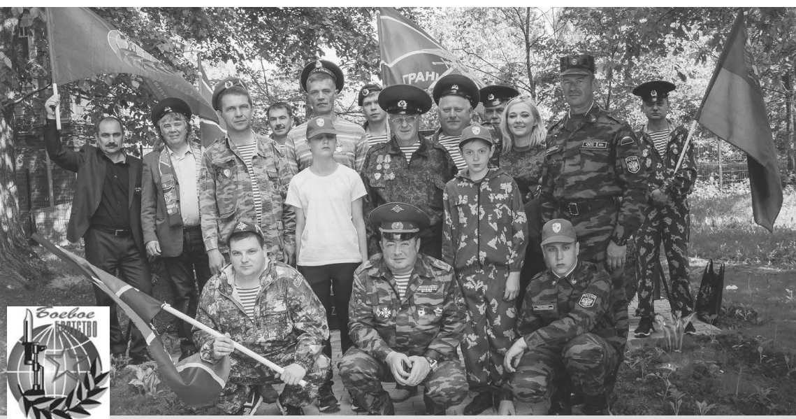
На одном из мероприятий с участием членов «Боевого братства».

фронтах Великой Отечественной войны, в Афганистане и Чечне, на Северном Кавказе и в других горячих точках. Знайте, что все они сражались ЗА РОДИНУ. И наш долг – о них и об этом всегда помнить. Рассказывать своим детям и внукам.