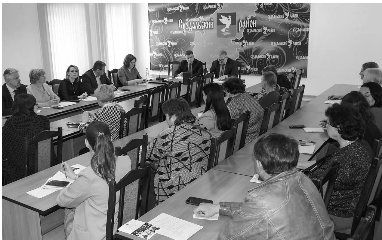
На встрече в администрации с предпринимательским сообществом Суздальского района.