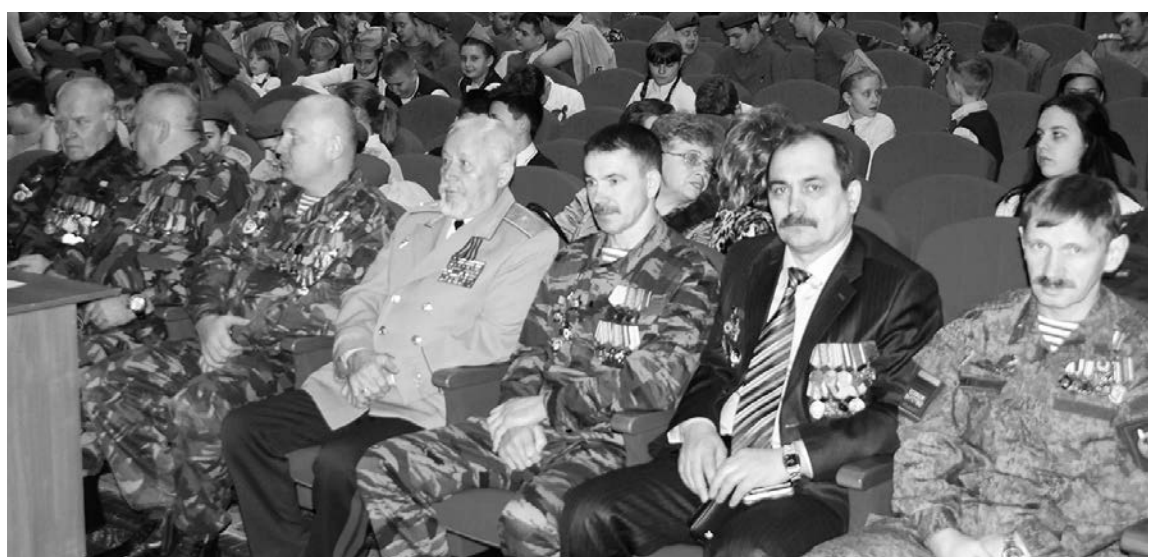
Ветераны - участники локальных войн и военных конфликтов в Афганистане и Чечне.