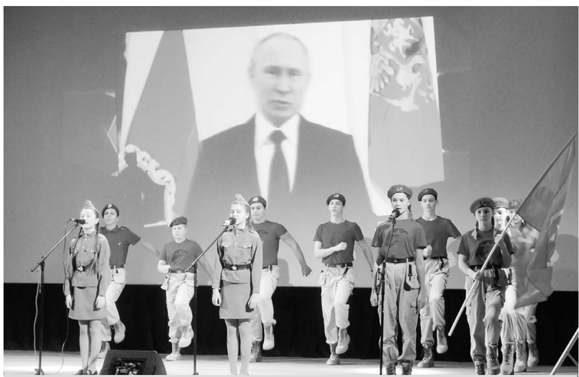
Юнармейцы Суздальского района - будущие защитники Отечества.

Хочется поклониться до земли всем родителям, воспитавшим своих сыновей патриотами. Давайте помнить о тех, кто отдал свой воинский долг Родине. Наша задача сейчас – отдать им наш долг – ПАМЯТИ И ЧЕСТИ!