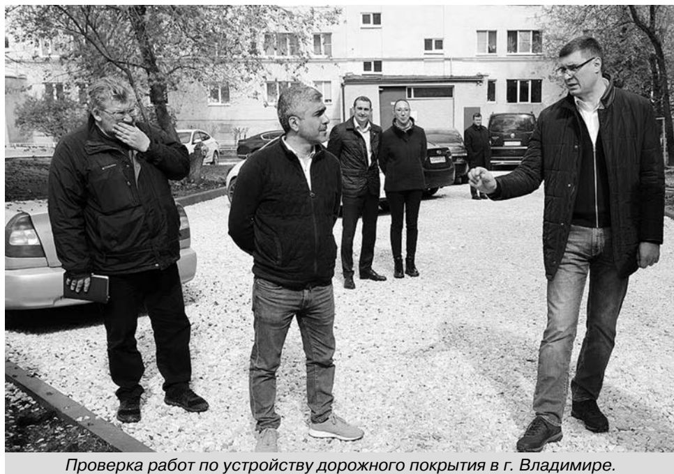
Проверка работ по устройству дорожного покрытия в г. Владимире.