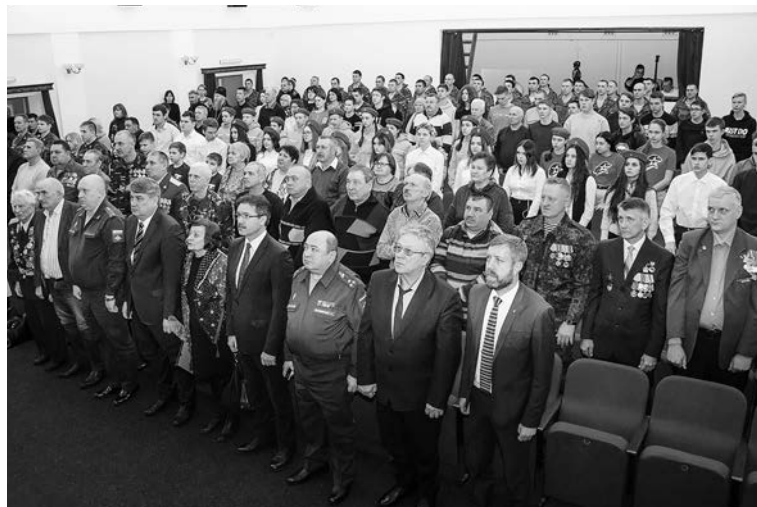
Минута молчания. Вечная память всем, кто погиб защищая Родину.

правоохранительных органов района, ветераны боевых действий, члены «Боевого братства», юнармейцы Суздальского района, матери и родные погибших ребят.