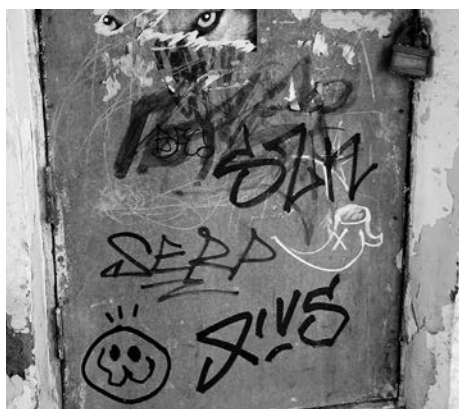
Такую картину часто можно встретить в Суздале.

В нашем городе тоже есть успешные примеры борьбы с «визуальным мусором», к которому, кстати, относятся различные объявления и реклама, если они размещены не в предназначенных для этого местах. Так взрослые выяснили, что за подросток сделал надписи на одном из памятников архитектуры Суздаля. Сообщили об этом его папе. Отец провёл разьяснительную работу с сыном, а затем они вместе привели испорченную поверхность в порядок. А вот совсем свежий пример этого года. Городские власти нашли владельца строительной фирмы, расклейки рекламы которой бездумно