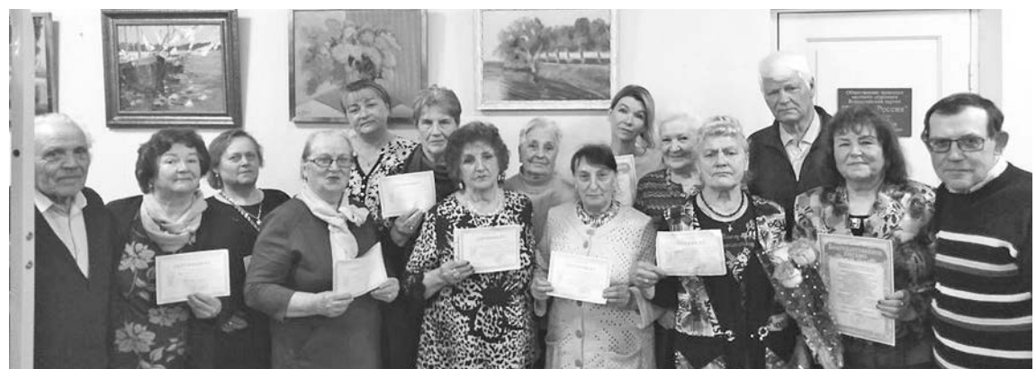
Слушатели университета третьего возраста при Комплексном центре социального обслуживания населения Суздальского района с полученными сертификатами.