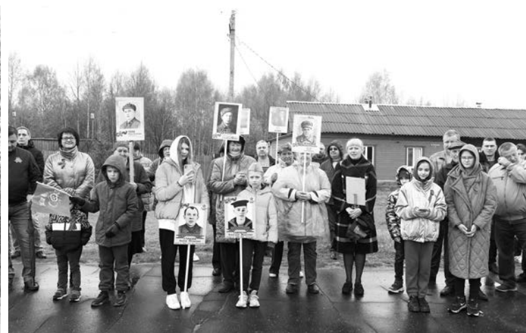
Участники митинга в с. Ляховицы.