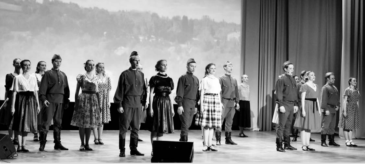
«От Москвы до Бреста» - на концерте Государственного вокально-хореографического ансамбля «Русь» в ГТК «Суздаль».

...Подъезжая к предприятию «Промрукав», нельзя не обратить внимание на большой баннер, на котором изображен знак Z с выразительной надписью - СВОИХ НЕ БРОСАЕМ! Это один из символов поддержки