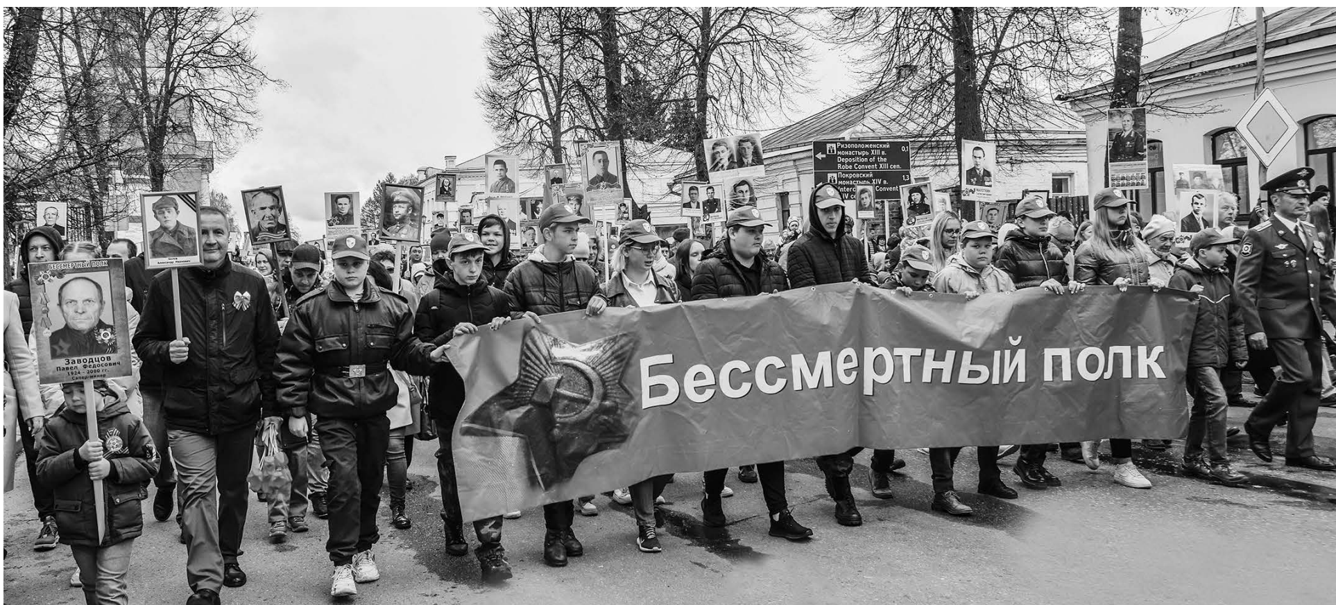
Праздничные мероприятия в Суздале, посвященные 77-й годовщине Победы в Великой Отечественной войне. «Бессмертный полк» и парад.

Существует предварительная запись по телефону 8(49231) 2-05-17.