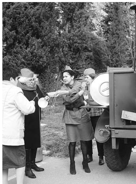
На празднике угощали солдатской кашей из полевой кухни.