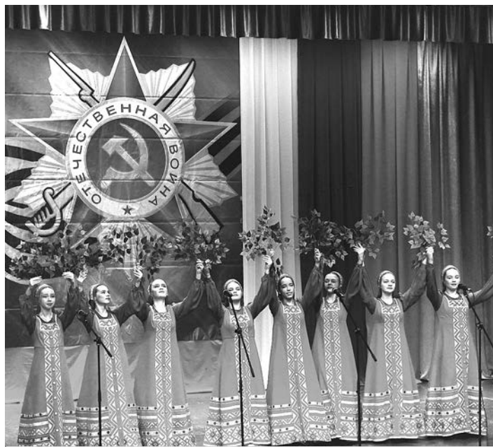
Танцевальный коллектив «Весна» открывает концерт.