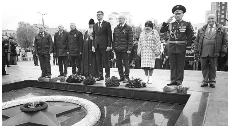
У Вечного огня. Отдавая дань памяти погибшим...