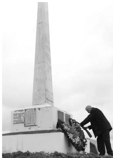
Памятник погибшим землякам в с. Троица-Берег.