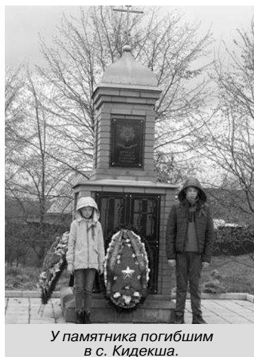
У памятника погибшим в с. Кидекша.