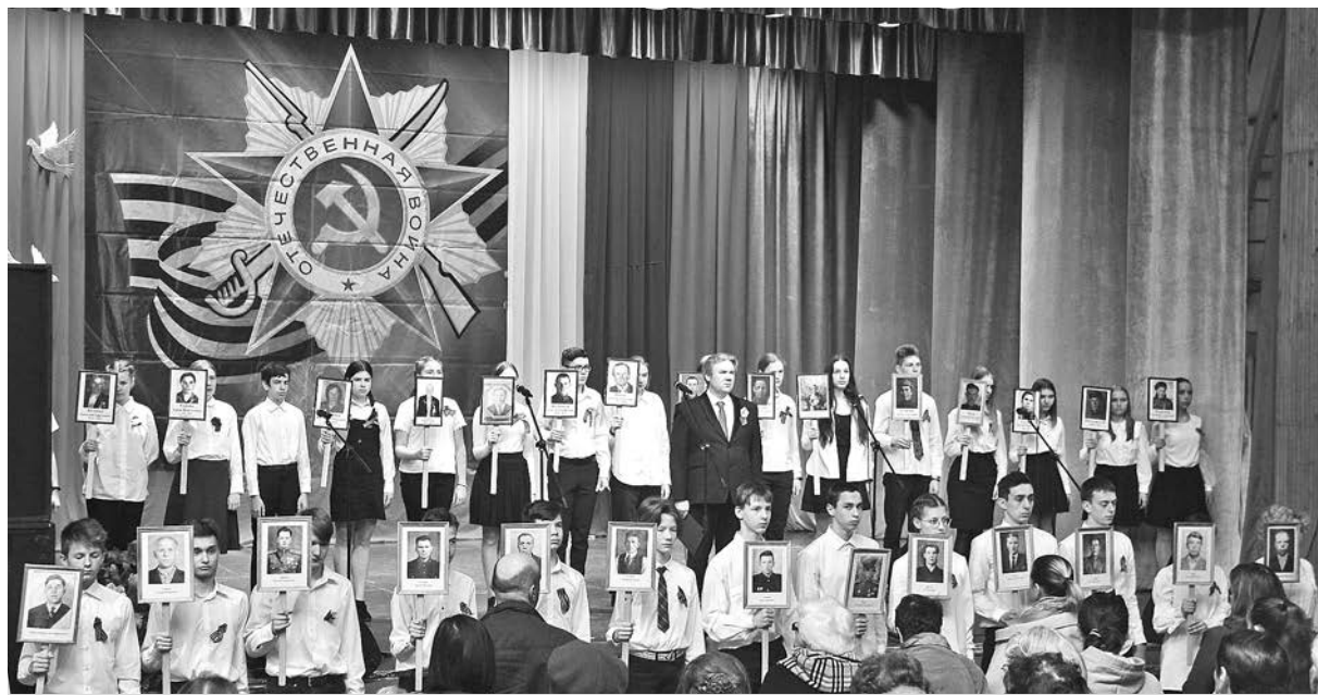
Школьники Суздальского района с портретами погибших на войне земляков - «Бессмертный полк».