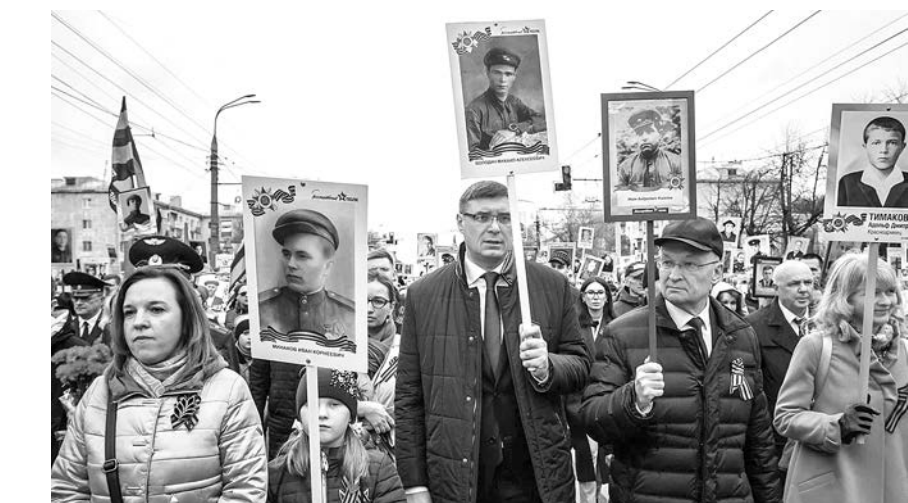
В рядах «Бессмертного полка» глава региона Александр Авдеев и спикер Законодательного Собрания Владимир Киселев.

Конечно, Великая Отечественная война коснулась каждой семьи в нашей большой стране, поэтому празднуют День Победы в