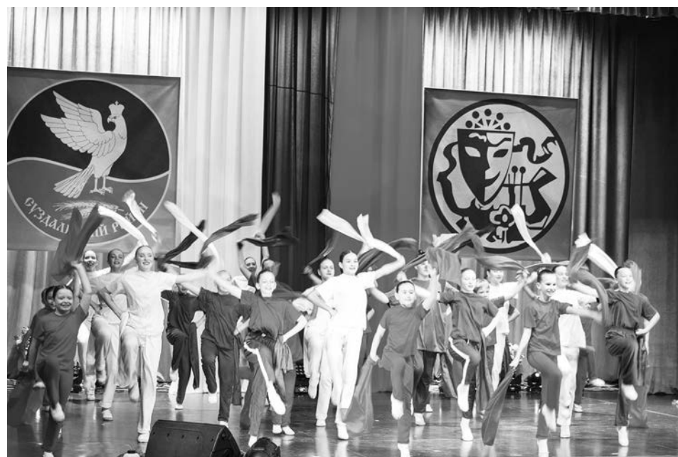
Танец «Моя Россия» исполняет образцовый хореографический ансамбль «Весна».