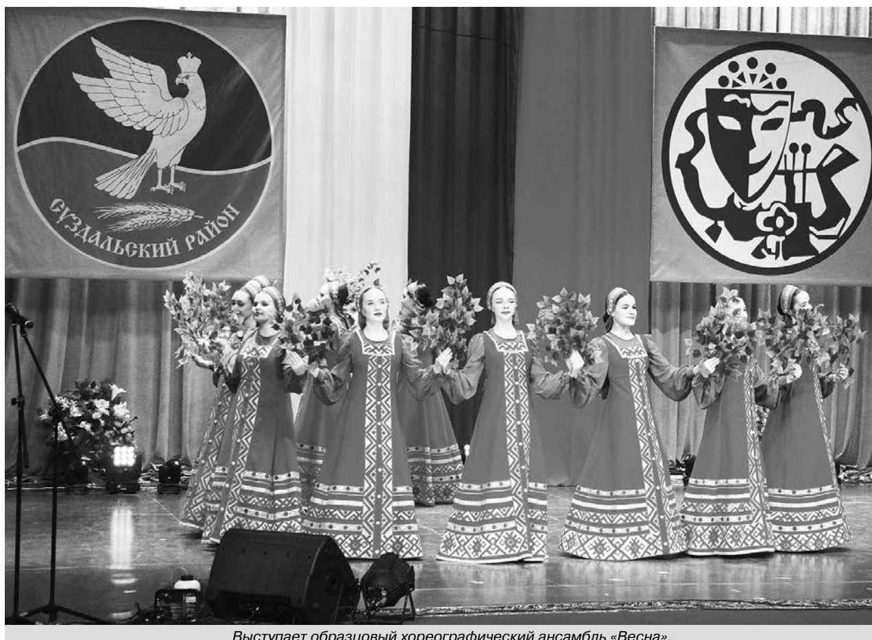
Выступает образцовый хореографический ансамбль «Весна».