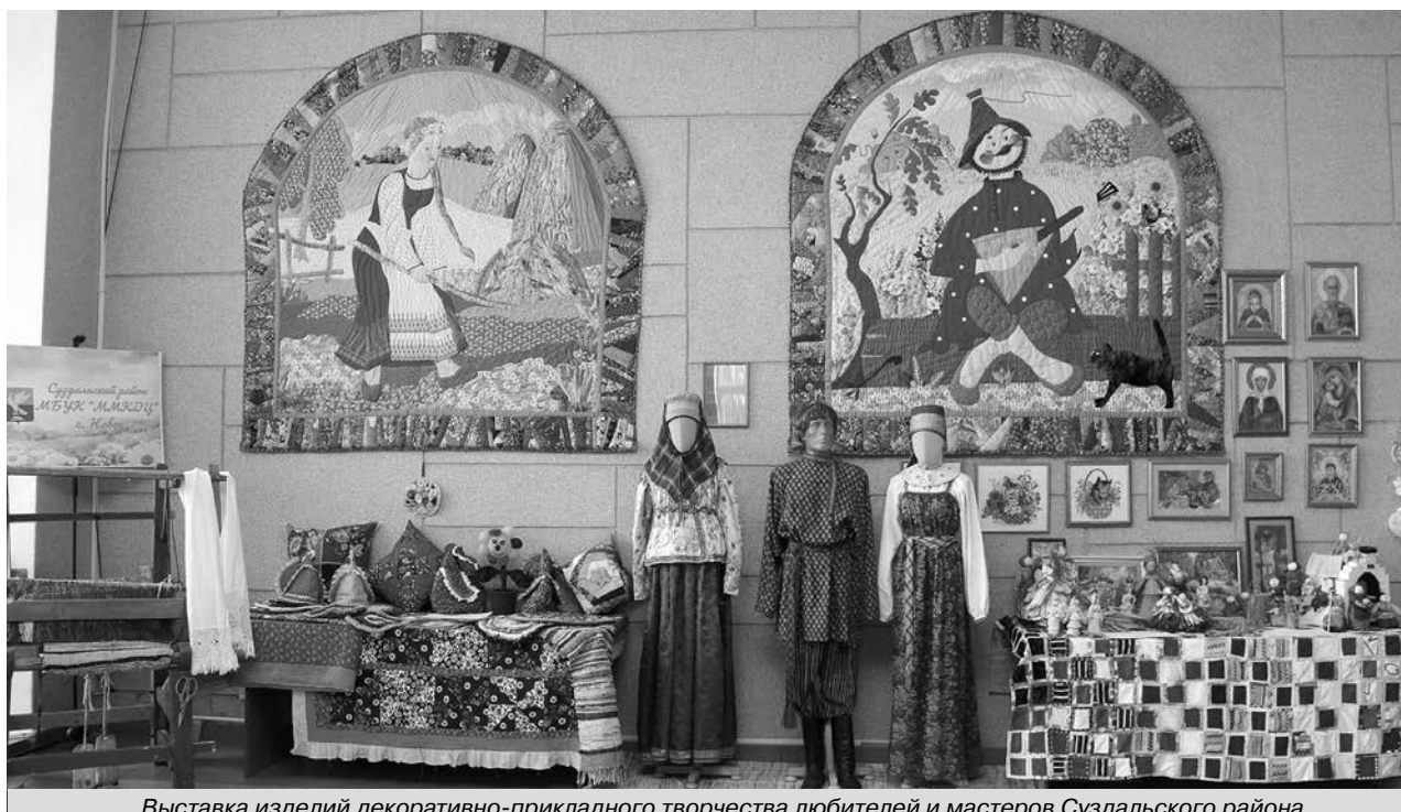
Выставка изделий декоративно-прикладного творчества любителей и мастеров Суздальского района.

8 апреля главная сценическая площадка Суздальского района в Новом селе стала местом проведения четвертого по счету районного фестиваля «ЗАЖЕЧЬ СЕРДЦА – ВЕЛИКОЕ ПРИЗВАНЬЕ» - яркого и массового культурного мероприятия, в котором приняли участие лучшие творческие коллективы учреждений культуры нашего района, любители и мастера декоративно-прикладного творчества (о фестивале читайте на 4-5 стр.).