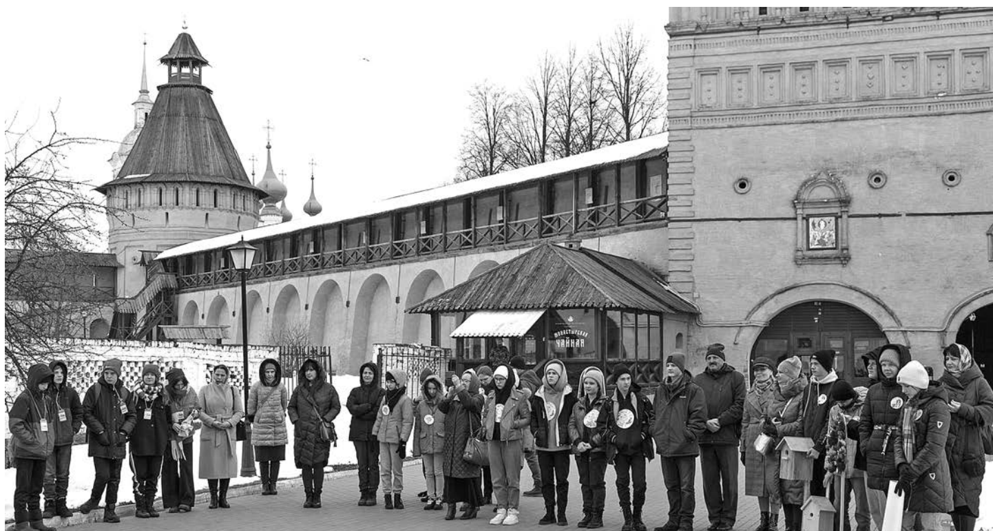
Участники праздника День птиц на территории Спасо-Евфимиева монастыря.