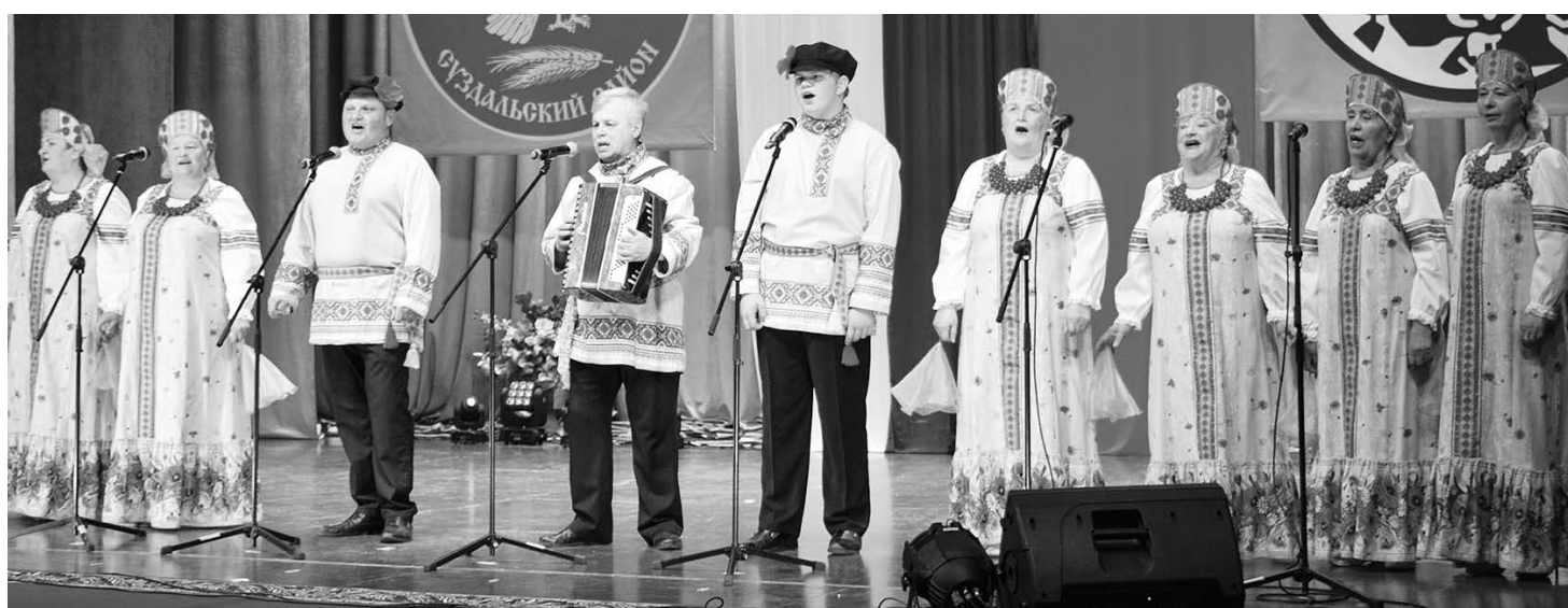
Народный хоровой коллектив «Березка» Кутуковского дома культуры.