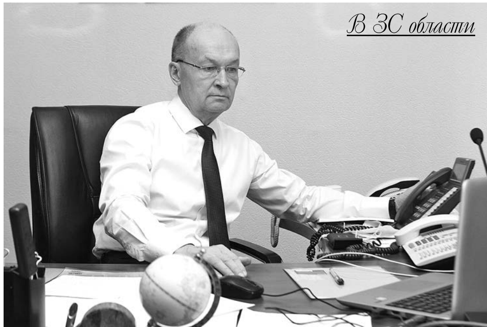
В ЗС области