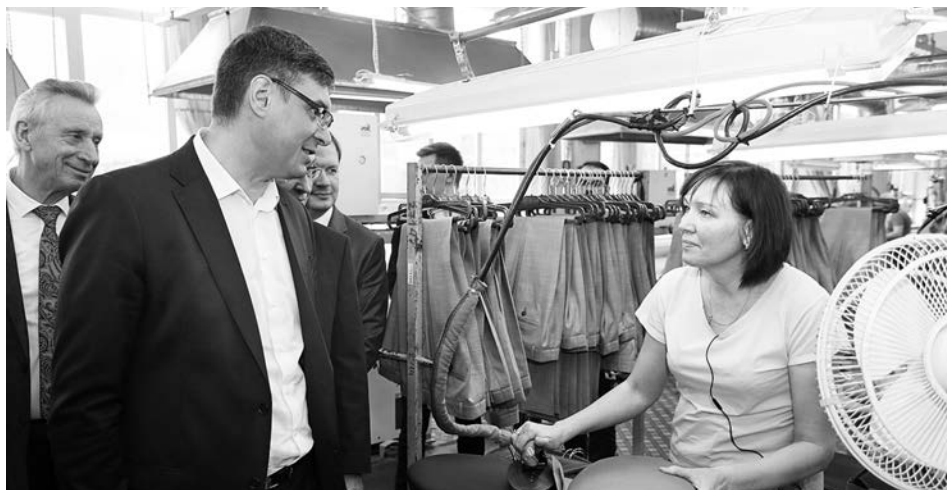
Во время рабочей поездки в Ковров. Знакомство с работой швейной фабрики «Сударь».

Глава региона особо отметил, что наряду с крепкой оборонной составляющей,