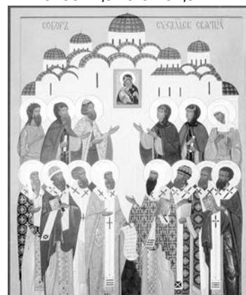
Икона Собор Суздальских святых.