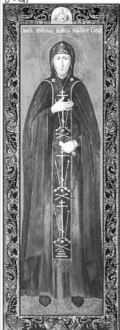
Икона преподобной Софии Суздальской