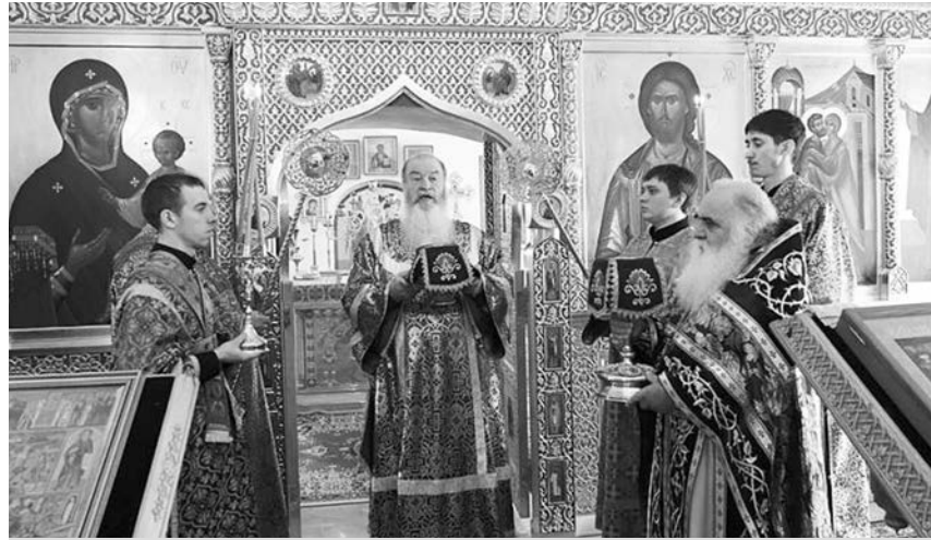
Владыка Тихон совершает Божественную литургию в Покровском монастыре.