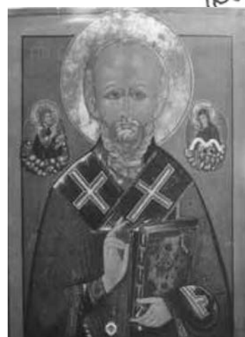
Икона свт. Николая Чудотворца с частицей его мощей.

Память прп. Софии (в миру великой Московской княгини Соломонии Сабуровой, супруги царя Василия III) почитается в обители на протяжении веков. Ее мощи были обретены 14 августа 1995 года.