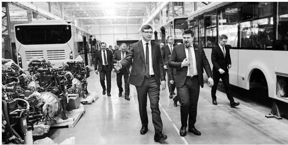
Глава региона Александр Авдеев во время посещения предприятия «Бакулин моторс групп» по выпуску автобусов Volgabus в Собинском районе.

работы на предприятиях региона. Привлечь их можно инфраструктурой, качеством жизни, возможностями для досуга и, конечно, жильём. Уже сейчас мы активно прорабатываем вопрос строительства жилья для работников предприятий», – подчеркнул Александр Авдеев. – Транспортерам страны необходим новый