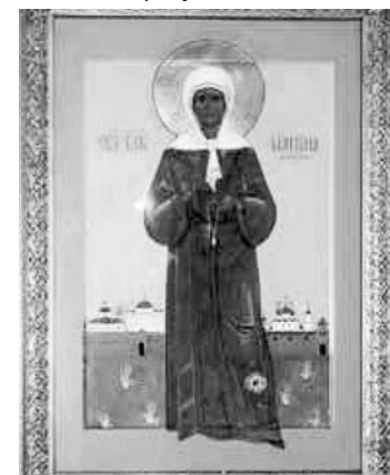
Икона блж. Матроны Московской с частицей ее св. мощей.