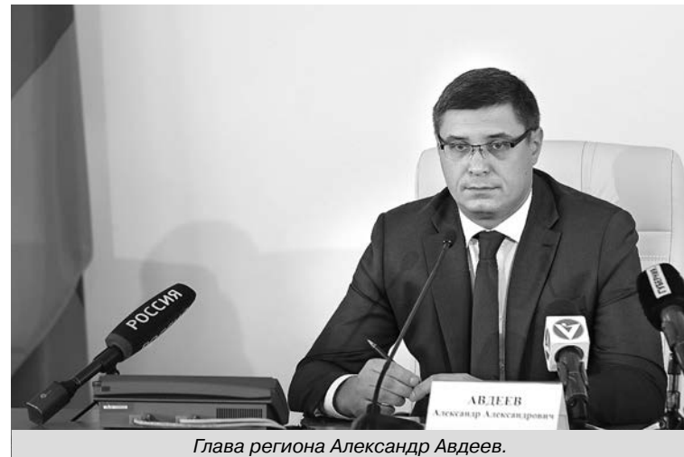
Глава региона Александр Авдеев.

Из них на реконструкцию здания материального скла-