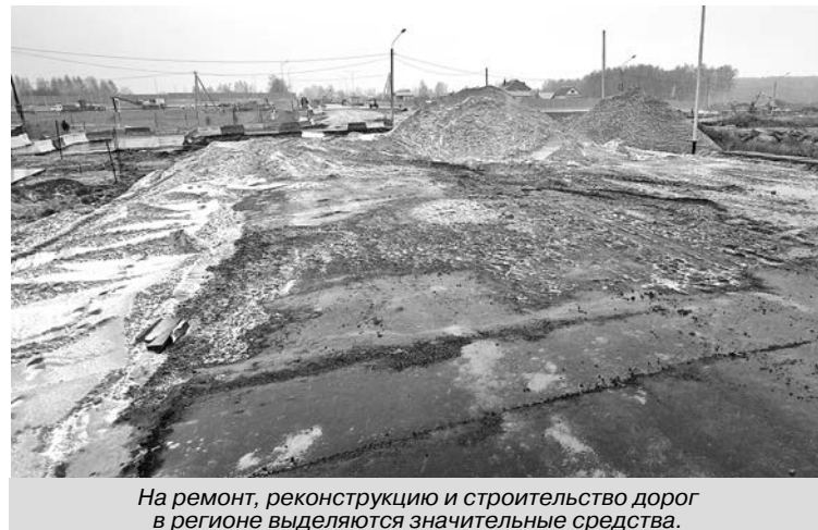
На ремонт, реконструкцию и строительство дорог в регионе выделяются значительные средства.

«Подобное состояние федеральной трассы необходимо сроч-