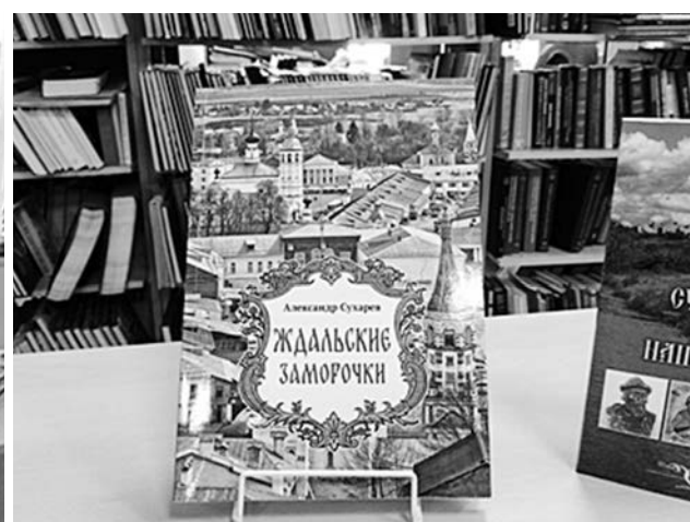
Книги, подаренные Суздальской библиотеке.

Совсем недавно в области проходила Неделя книгодарения, в которой активное участие приняли жители, гости Суздаля и Суздальского района. За что Суздальская библиотека выражает всем им большую благодарность.