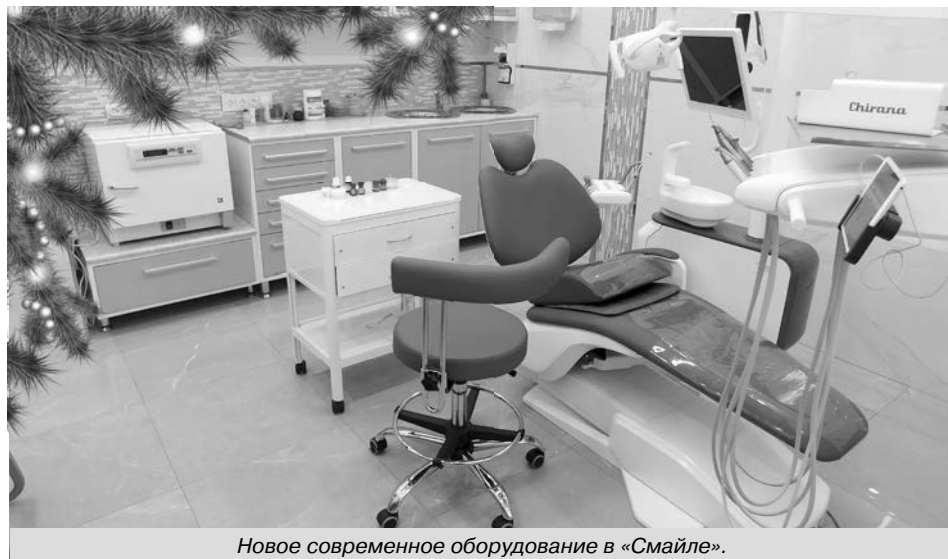
Новое современное оборудование в «Смайле».