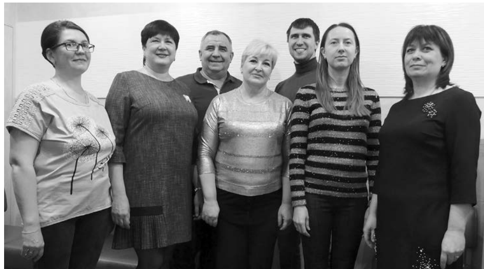
Дружный коллектив стоматологий «Смайл» и «Доктор+».