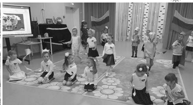
В День народного единства.