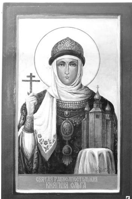
Икона святой равноапостольной княгини Ольги.