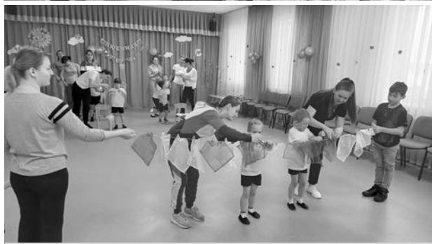
Спортивные состязания с мамами.