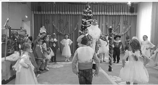
На новогоднем утреннике.

Большая подготовка у нас в детском саду была проведена ко Дню матери, который отмечается в ноябре. Дети разучивали стихи, песни, посвященные мамам, рисовали рисунки, делали мамам подарки. Накануне праздничного дня в разновозрастной группе «Цветик-семицветик» прошли спортивные игры «Я и мама - самые спортивные». Дети вместе с мамами участвовали в разных спортивных соревнованиях. Все участницы-мамы имели кар-коды. Также была организована фотовыставка фотографий мам с детьми «Моя мамочка».