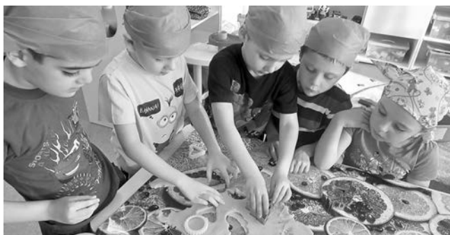
На День повара дети готовили печенье.

Большое внимание наши воспитатели стараются уделять патристическому воспитанию ребят. Поэтому проведение праздника - Дня народного единства было для нас крайне важным. В основу сценария проведения мероприятия легли тщательно продуманные беседы на историческую тематику, детям рассказали и объяснили им в доступной форме такие понятия как Родина, дружба, помощь, взаимовыручка, русский язык, народ, единство. Важность этого праздника и его значение, конечно, не подвергается никакому сомнению, с малолетства нужно воспитывать в детях любовь к Родине, уважение к государству, к своему народу.