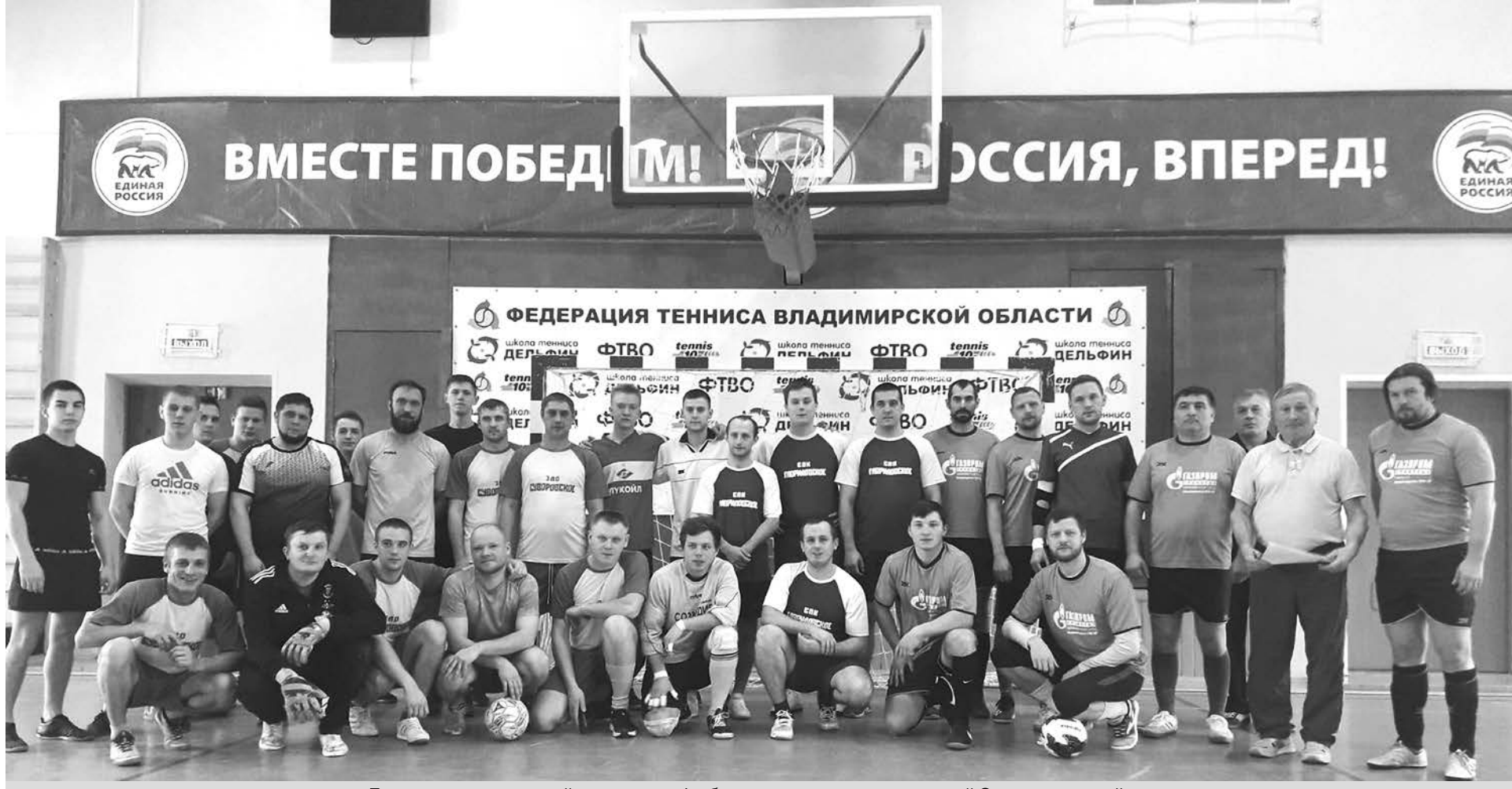
Призеры первенства района по мини-футболу среди сельхозпредприятий Суздальского района.