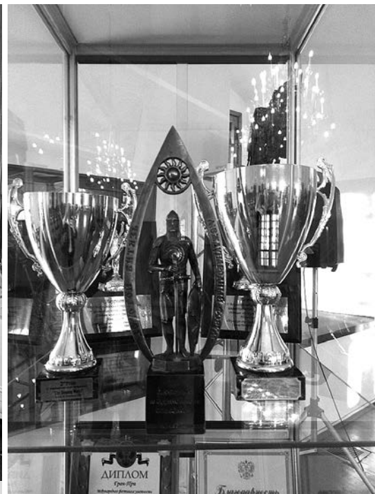
Награды мужской хоровой капеллы «Благовест»

славянского музыкального форума «Золотой витязь», основателем которого является народный артист России Николай Бурляев. В программе прозвучали песнопения, посвященные 800-летию со дня рождения князя Александра Невского, а также сочинения русской и зарубежной духовной музыки.