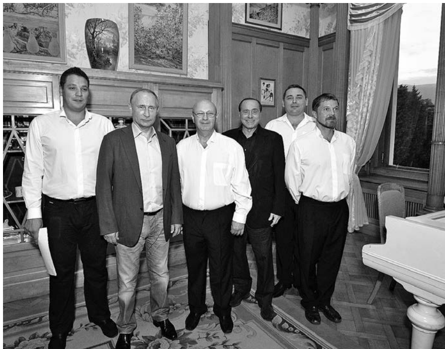
С Президентом России Владимиром Путиным и его гостями в Ливадийском дворце в Крыму.