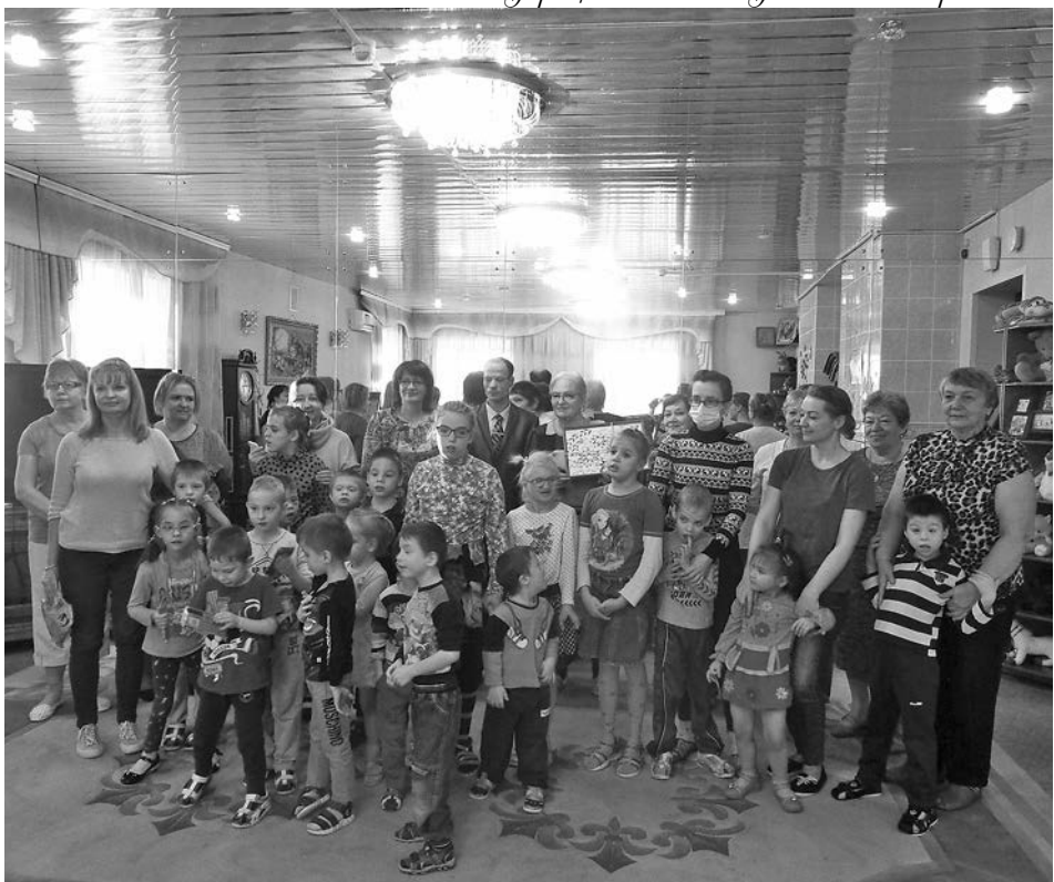
Участники встречи в Детском доме.

С текстом приложений можно ознакомиться на официальном сайте администрации МО город Суздаль в сети «Интернет» по адресу: www.gorodsuzdal.ru