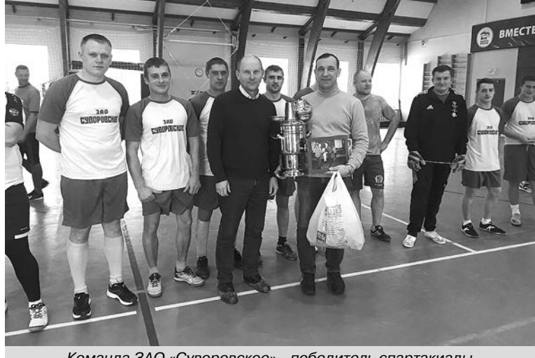
Команда ЗАО «Суворовское» - победитель спартакиады.