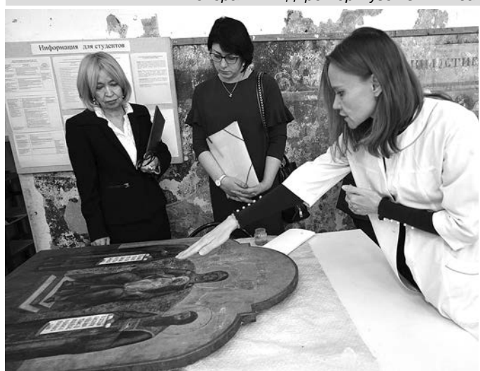
В реставрационных мастерских Суздальского филиала СПбГИК.