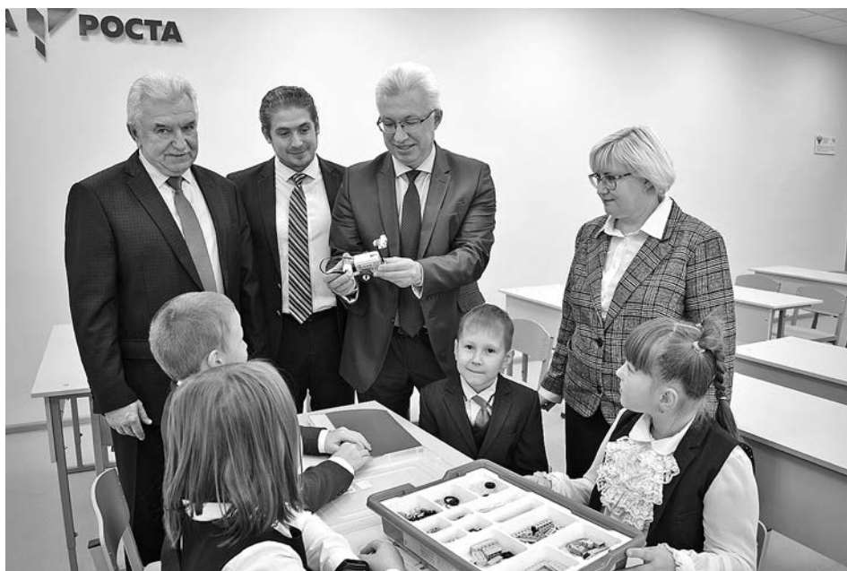
В одном из классов «Точки роста» Боголюбовской школы Суздальского района.