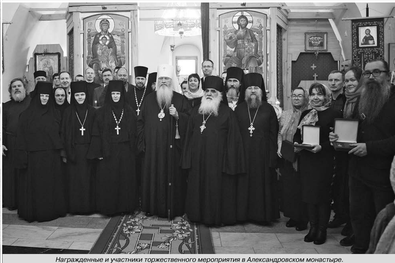
Награжденные и участники торжественного мероприятия в Александровском монастыре.