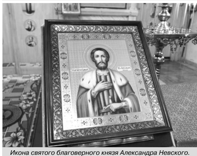
Икона святого благоверного князя Александра Невского.