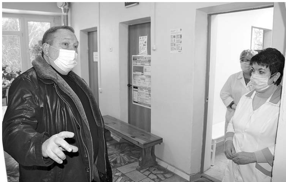
Врио заместителя Губернатора Константин Баранов проверяет прививочные кабинеты в Суздальской поликлинике.

Для вакцинации необходимо предъявить паспорт, снилс и полис обязательного медицинского страхования.