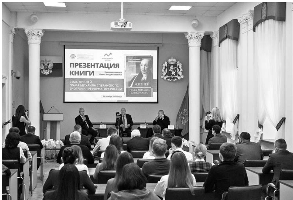
На презентации книги, посвященной Михаилу Сперанскому.