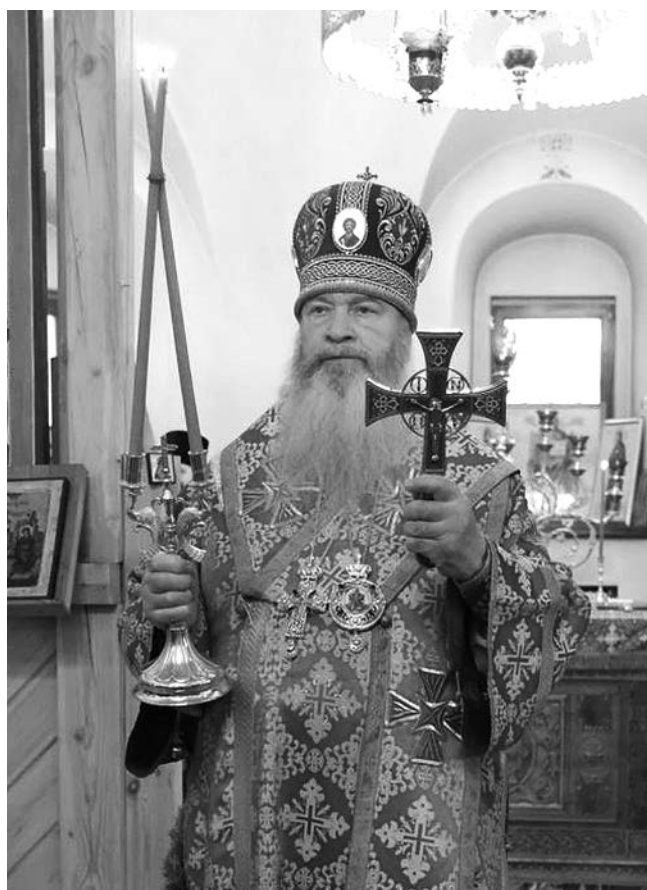
Митрополит Владимирский и Суздальский Тихон на Божественной литургии.