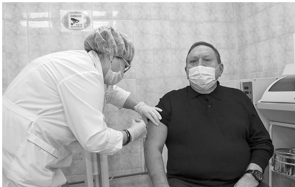
Врио вице-губернатора ревакцинировался от коронавируса препаратом «Спутник Лайт».