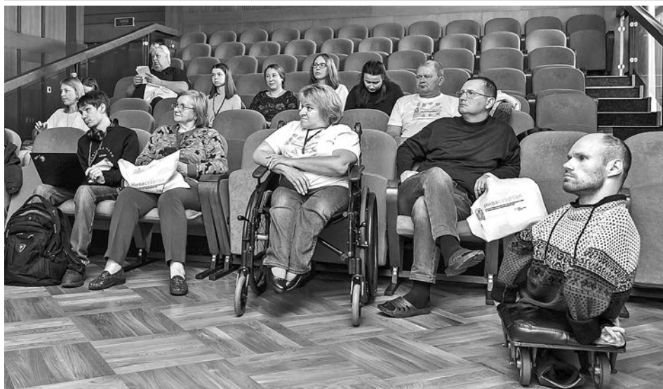
На одной из дискуссионных площадок форума.