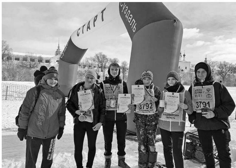
Студенты колледжа активно занимаются спортом.

Лучшие студенты регулярно становятся обладателями именных стипендий Губернатора Владимирской области и Главы администрации Суздальского района, стипендиатами администрации области «Надежда земли Владимирской».