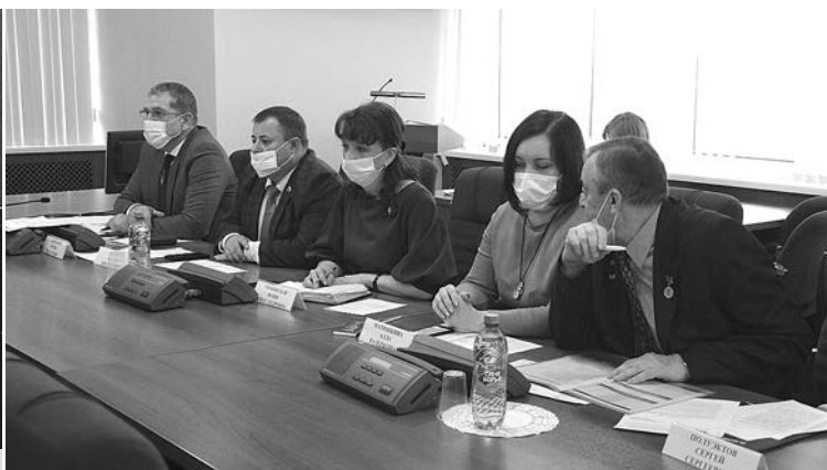
Представители общественности региона на бюджетных слушаниях.

Бюджетные слушания – фактически, самый важный этап формирования бюджета региона. Главный финансовый документ уже прошел «нулевое» чтение с учетом рекомендаций депутатов Законодательного Собрания. Теперь очередь жителей Владимирской области. На слушаниях со своими предложениями выступили видные общественники: как члены Общественной палаты Владимирской области, так и представители различных общественных организаций. Их заметки и комментарии будут в обязательном порядке учтены при формировании бюджета, и только после этого соответствующий законопроект вынесут на голосование в Законодательное Собрание.