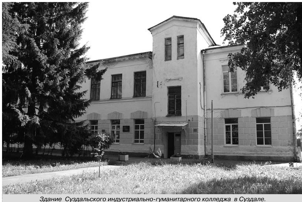
Здание Суздальского индустриально-гуманитарного колледжа в Суздале.

СУЗДАЛЬСКОМУ ИНДУСТРИАЛЬНО-ГУМАНИТАРНОМУ КОЛЛЕДЖУ - 90 ЛЕТ!