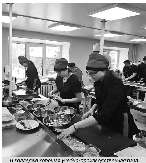
В колледже хорошая учебно-производственная база.

Большие трудности выпали на долю коллектива учебного заведения в годы Великой Отечественной войны. Многие преподаватели и учащиеся ушли на фронт, но несмотря на дефицит кадров, учебный процесс продолжался. Контингент, в основном, составляли девушки, изъявившие желание