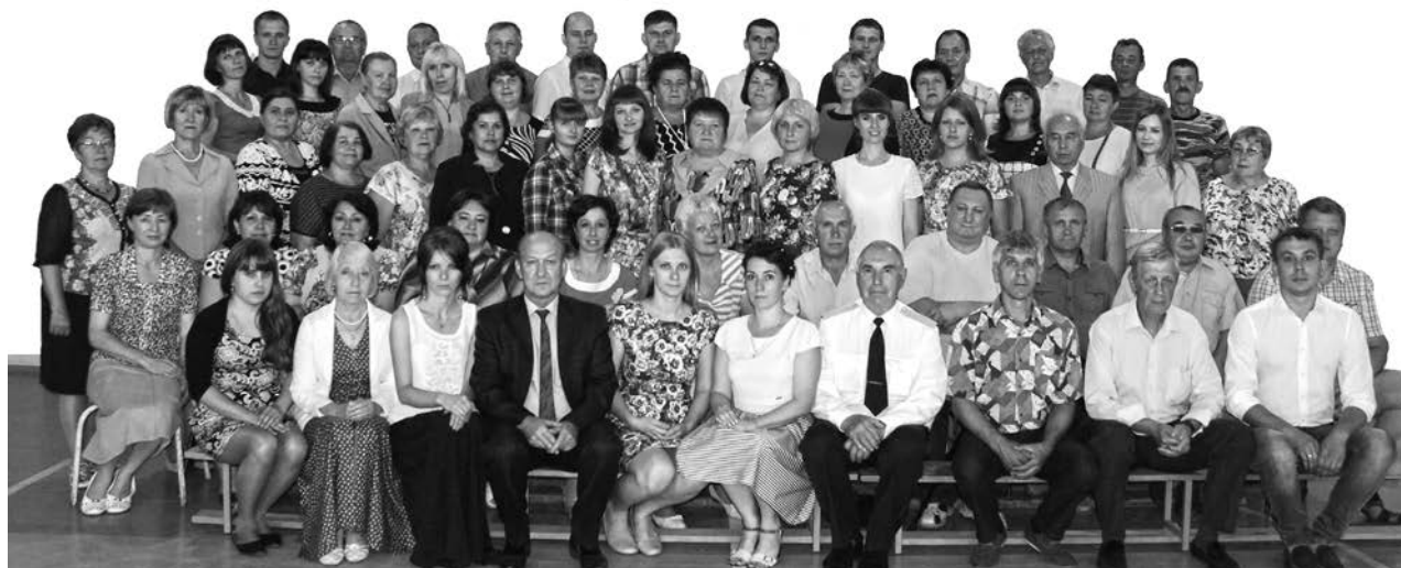
Ежегодно преподаватели колледжа повышают свою квалификацию, участвуют в областных конкурсах профессионального мастерства, ведут большую методическую и общественную работу.

И сегодня педагогический коллектив является творческим, работоспособным и продолжает успешно решать задачи по подготовке квалифицированных кадров для народного хозяйства.