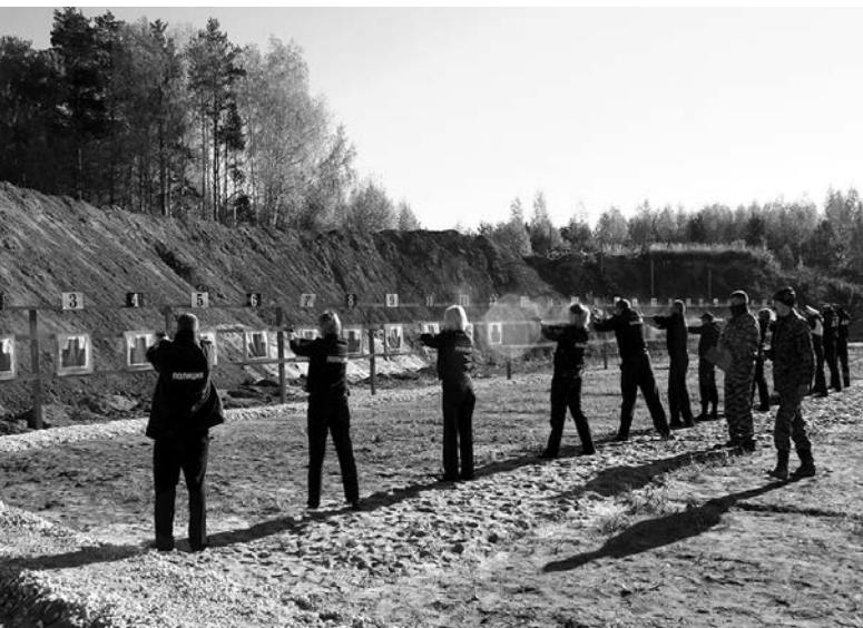
Сдача нормативов по стрельбе на новом стрелковом полигоне.