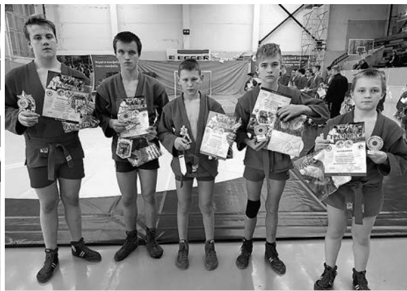
Суздальская команда самбистов.