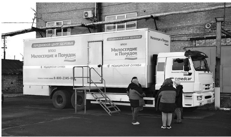
Передвижной центр здоровья в г. Судогде.

«Сотрудники нашего предприятия очень позитивно приняли предложение пройти обследования в передвижных центрах здоровья. Я сам посетил невролога и сделал УЗИ брюшной полости. Это очень удобно. Не надо тратить время на поездку в поликлинику, стоять в очереди. Здесь в порядке записи