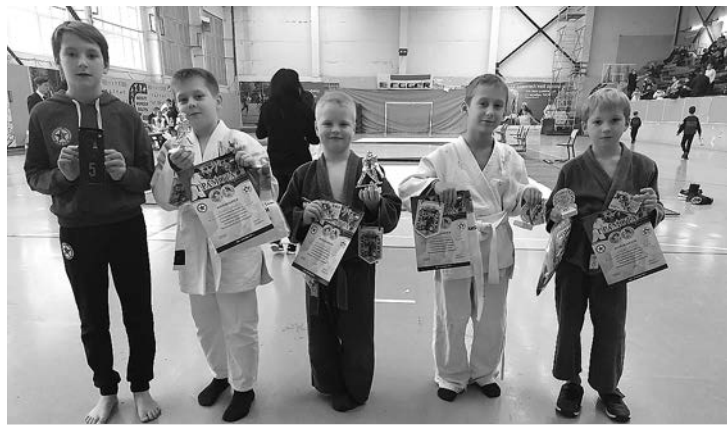
Юные дзюдоисты из Суздаля.