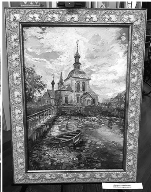
«Суздаль - душа России», 2020 г. Холст, картон, масло.