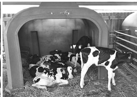
Племенной скот ООО ПЗ «Нива».

С 5 по 10 октября 2021 года в Москве проходило самое масштабное в России событие в сфере АПК – Неделя агропромышленного комплекса, организованная Минсельхозом России. В ее рамках состоялась XXIII Российская агропромышленная выставка «Золотая осень-2021» – крупнейший в стране смотр достижений сельского хозяйства. Это главный аграрный форум страны на протяжении уже более 20 лет. Российские аграрии и производители привезли то, чем можно гордиться. В этом престижном для сельского хозяйства страны мероприятии приняли участие и наши земляки – ООО Племзавод «Нива» и ФГБНУ «Верхневолжский ФАНЦ».