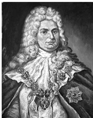
Павел Иванович Ягужинский, первый Генерал-прокурор Сената.

- осуществление надзора от имени государства за законностью действий всех органов власти, хозяйственных учреждений, общественных, частных организаций и частных лиц путем возбуждения уголовного