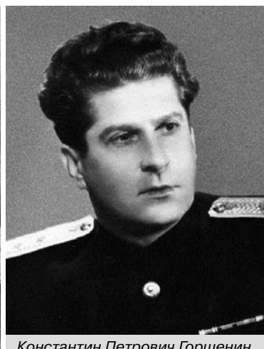
Константин Петрович Горшенин, первый Генеральный прокурор СССР.

преследования против виновных и опротестования нарушающих закон постановлений; - непосредственное наблюдение за деятельностью следственных органов дознания в области раскрытия преступлений, а также за деятельностью органов государственного политического управления;