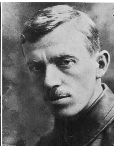
Иван Алексеевич Акулов, первый прокурор Союза ССР.