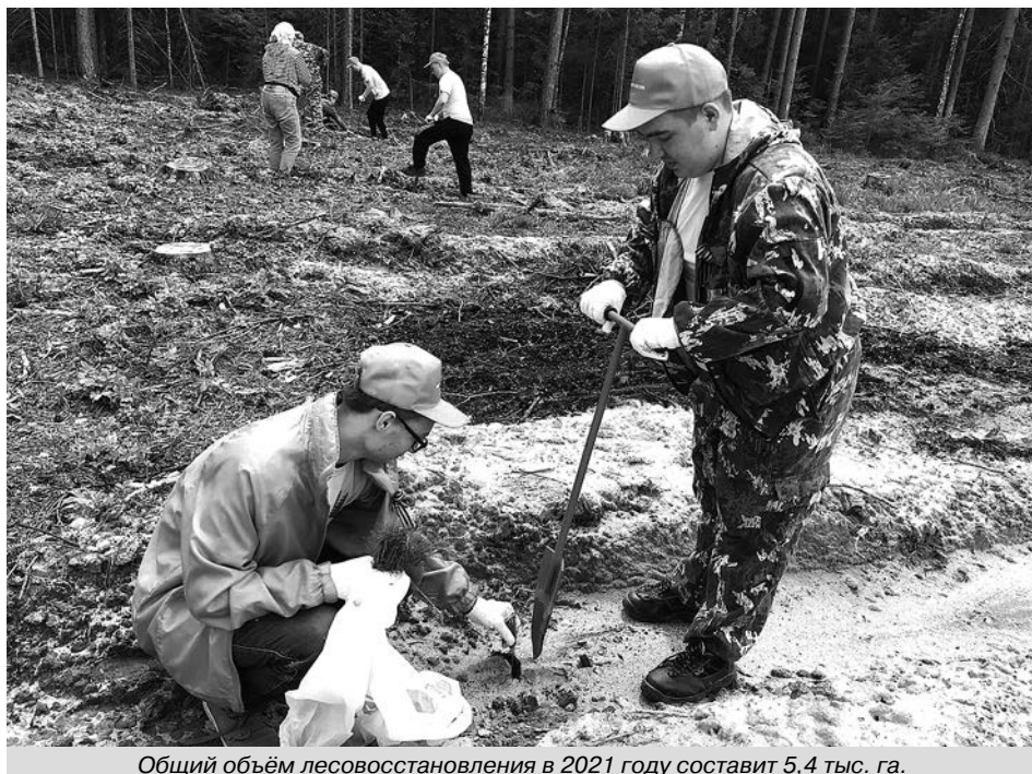
Общий объём лесовосстановления в 2021 году составит 5,4 тыс. га.

Добавим также, что Владимирская область предусмотрела дополнительно 84,7 млн рублей на приобретение 22 автомобилей скорой медицинской помощи. Они будут поставлены в ноябре этого года.