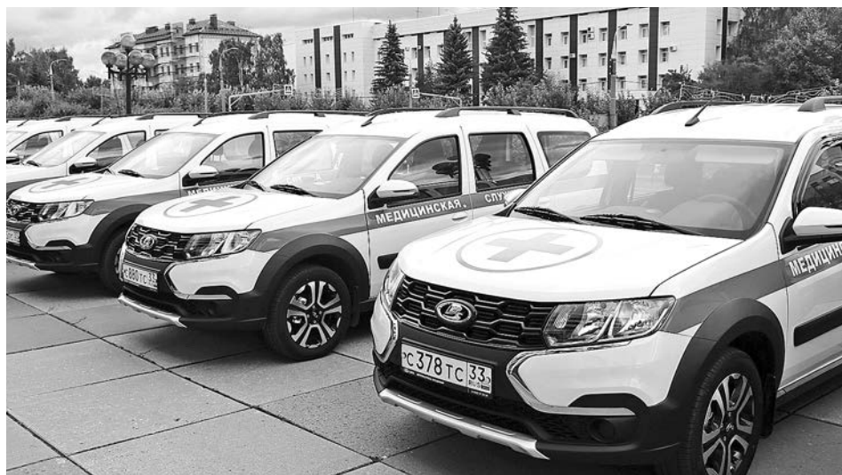
Транспорт приобретён в рамках госпрограммы «Развитие здравоохранения Владимирской области на 2021 год».

Уже утверждён перечень объектов регионального и межмуниципального значения, планируемых к реализации по дорожному нацпроекту в 2022 году. В него вошли участки автодорог в Александровском, Вязниковском, Гусь-Хрустальном, Камешковском, Киржачском, Ковровском, Меленковском, Муромском и Петушинском районах.