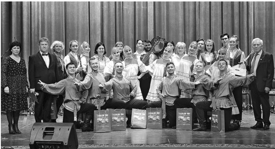
Фотография на память с гостями из Луганска.