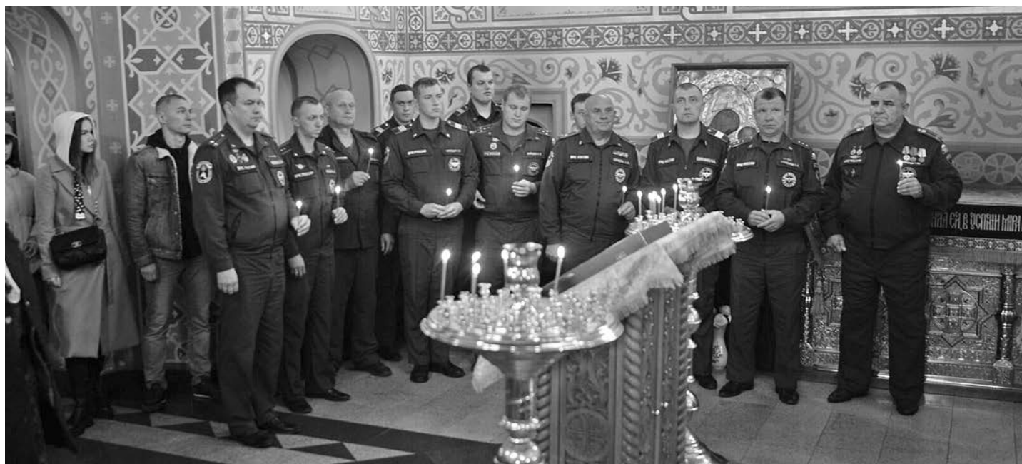
В храме Успения Божией Матери сотрудники Пожарно-спасательной части № 26 города Суздаля.