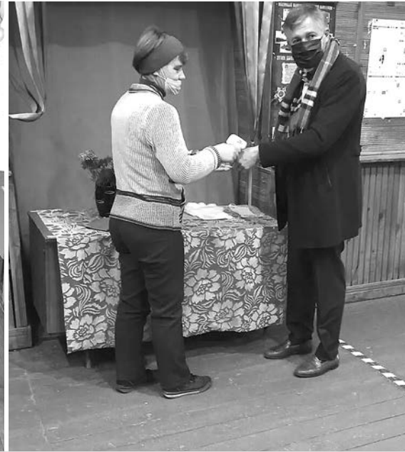
На выборах в Государственную Думу РФ VIII созыва голосуют жители Суздальского района.