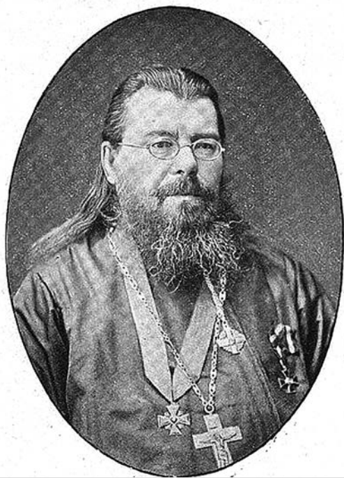
Михаил Иванович Херасков.

№ 73 (12238), среда, 22 сентября 2021 г.