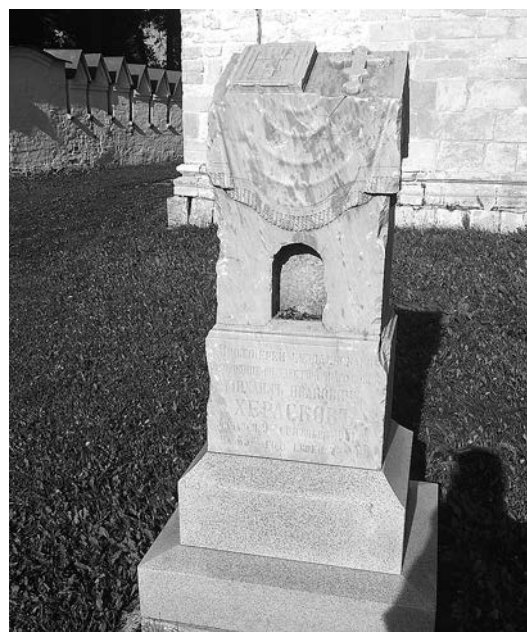
Мраморный постамент на могиле М.И. Хераскова около собора. Памятник найден и восстановлен музеем ровно 10 лет назад в год 110-й годовщины смерти М.И. Хераскова.