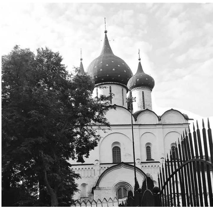
Богородице-Рождественский собор в Суздале.