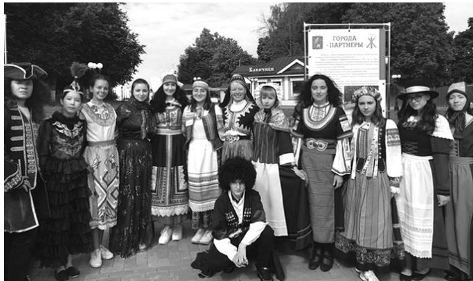
Истоковцы на молодежном форуме обрели много друзей.