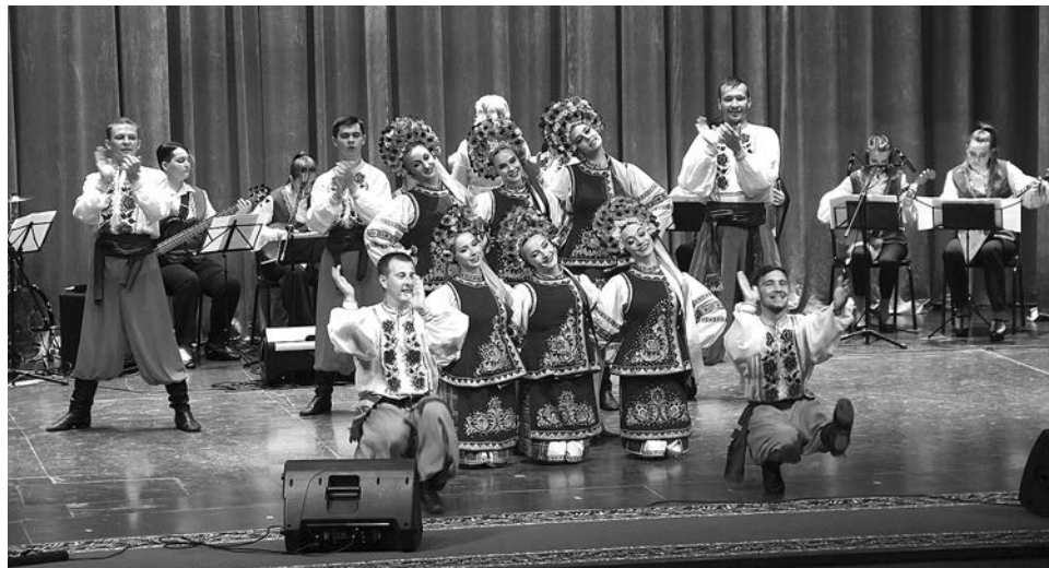
Танцует ансамбль танца «Рапсодия».