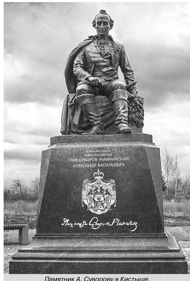
Памятник А. Суворову в Кистыше.