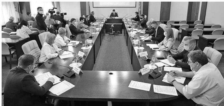
Рабочее совещание по вопросу обеспечения безопасности дорожного движения на автомобильных дорогах региона.