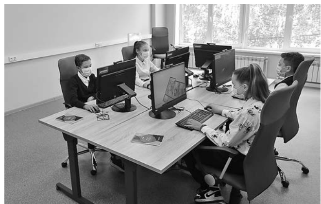
Центр опережающей профессиональной подготовки

Учёба проводится очно или дистанционно в зависимости от специфики курса, сроков обучения – от 1-2 месяцев (для взрослых) до учебного года (для школьников). Группы малокомплектные, поскольку основной