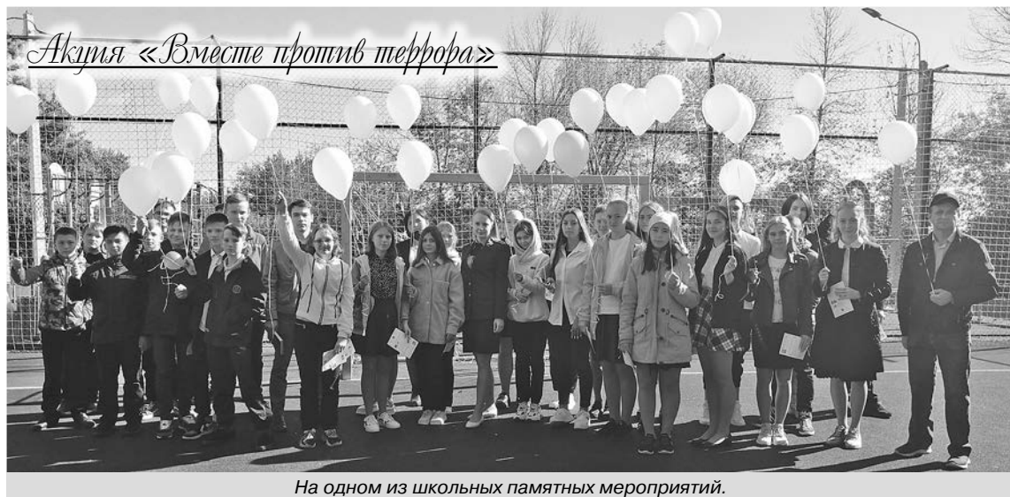
На одном из школьных памятных мероприятий.