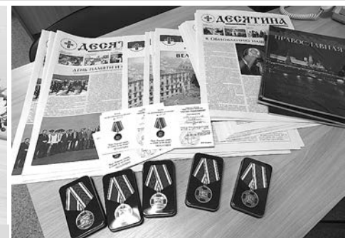
Памятные медали «За жертвенное служение», газета «Десятина».