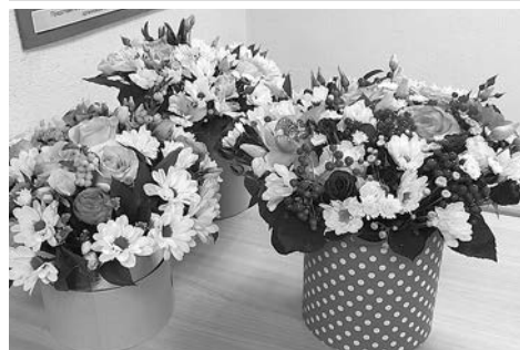
Эти цветы можно было бы вручить всем медикам Суздальского района, которые помогают людям бороться с ковидом.