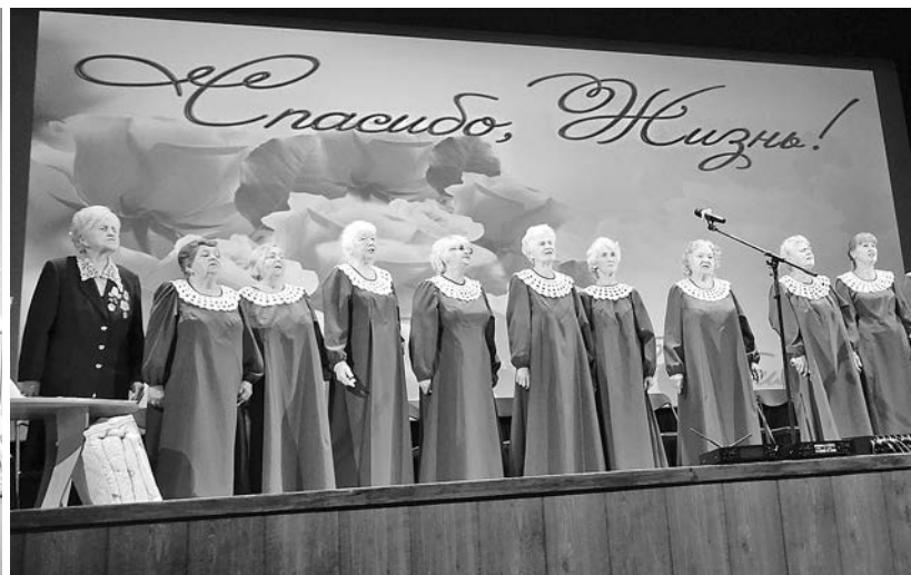
С любимым хором «Суздалянка».