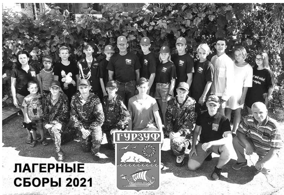
ЛАГЕРНЫЕ СБОРЫ 2021