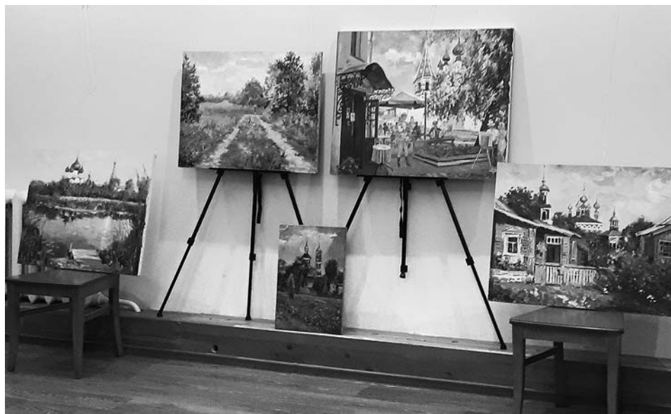
Работы участников пленэра.