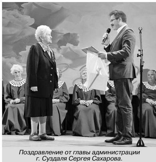
Поздравление от главы администрации г. Суздаля Сергея Сахарова.