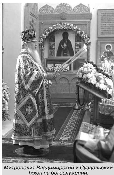
Митрополит Владимирский и Суздальский Тихон на богослужении.

14 августа, в день празднования Изнесения Честных Древ Животворящего Креста Господня, в день обретения мощей преподобной Софии Суздальской, в Свято-Покровском монастыре города Суздаля состоялись праздничные богослужения.