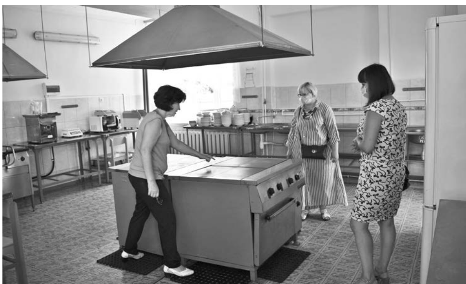
Пищеблок в Стародворской школе.