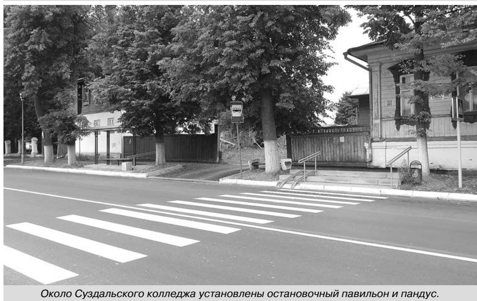
Около Суздальского колледжа установлены остановочный павильон и пандус.