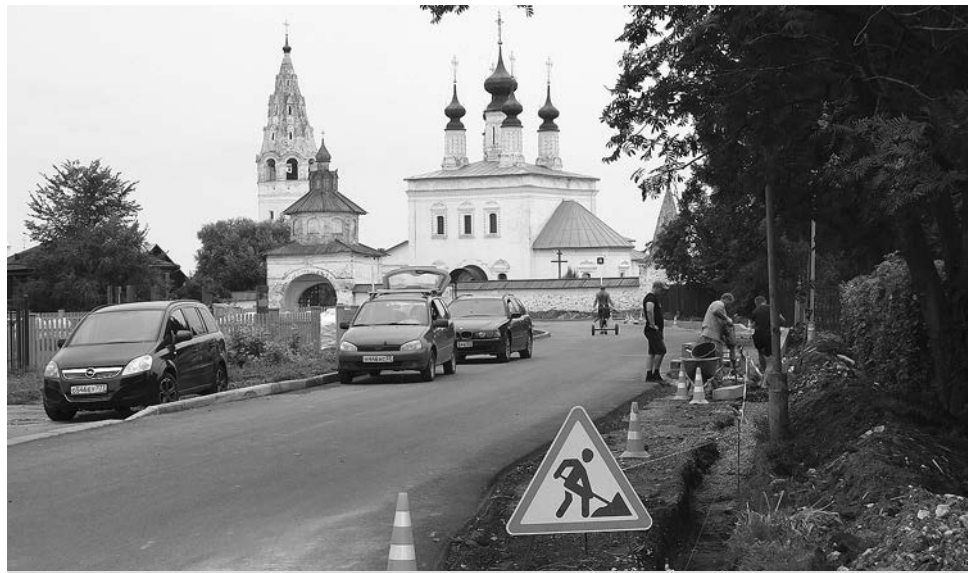
После дорожных работ преобразилась ул. Гастева.