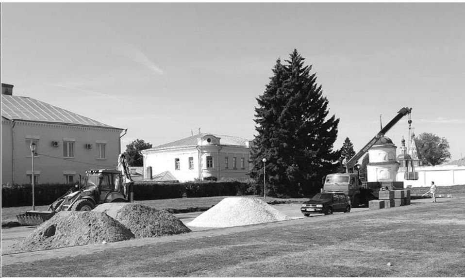
Долгожданный ремонт парковки у администрации г. Суздаля.