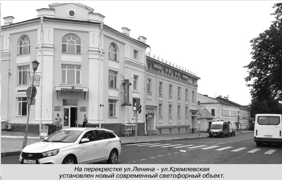
На перекрестке ул. Ленина - ул. Кремлевская установлен новый современный светофорный объект.