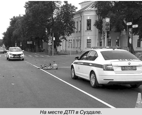
На месте ДТП в Суздале.

9 августа в 8 часов утра в Суздале на регулируемом перекрестке неравнозначных дорог центральной улицы произошло дорожно-транспортное происшествие.