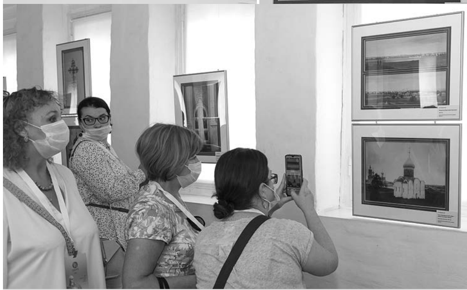
На фотовыставке «Александр Невский - 800 лет с Россией».