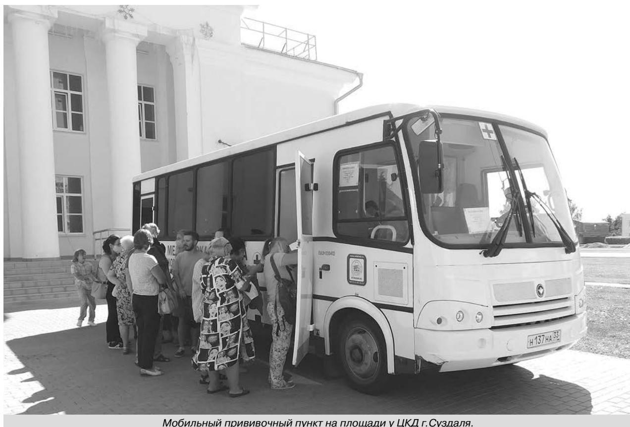
Мобильный прививочный пункт на площади у ЦКД г.Суздаля.

Прием проводится дистанционно по телефону 8(49231) 2-05-17.