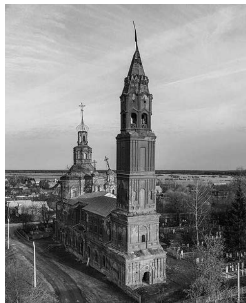
Храм Воскресения Христова.