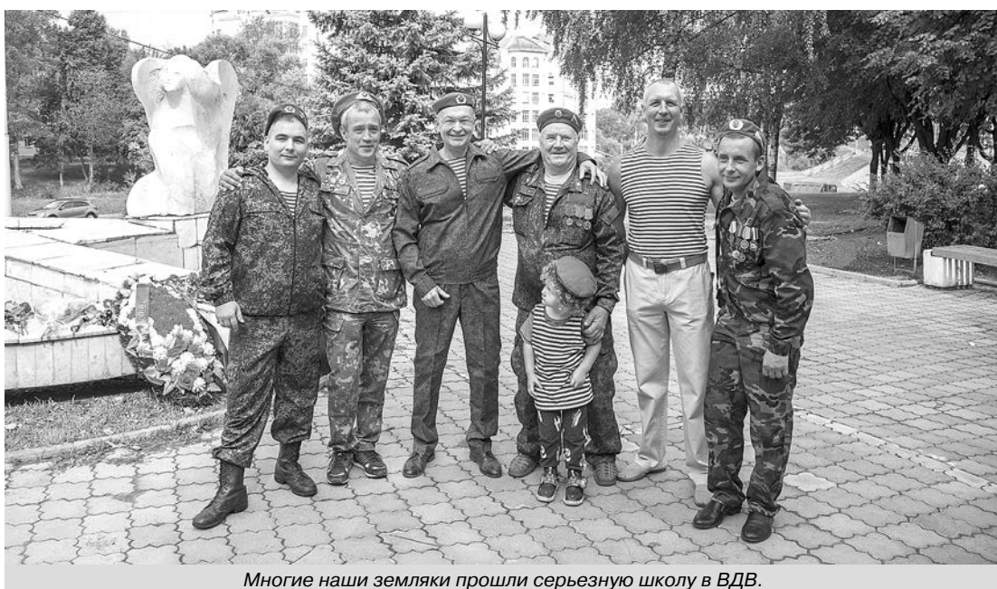
Многие наши земляки прошли серьезную школу в ВДВ.