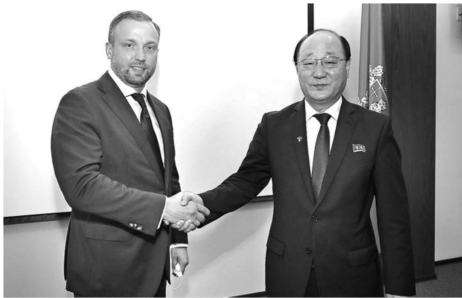
Высокого гостя из КНДР встречал Александр Ремига, и.о. Губернатора Владимирской области.